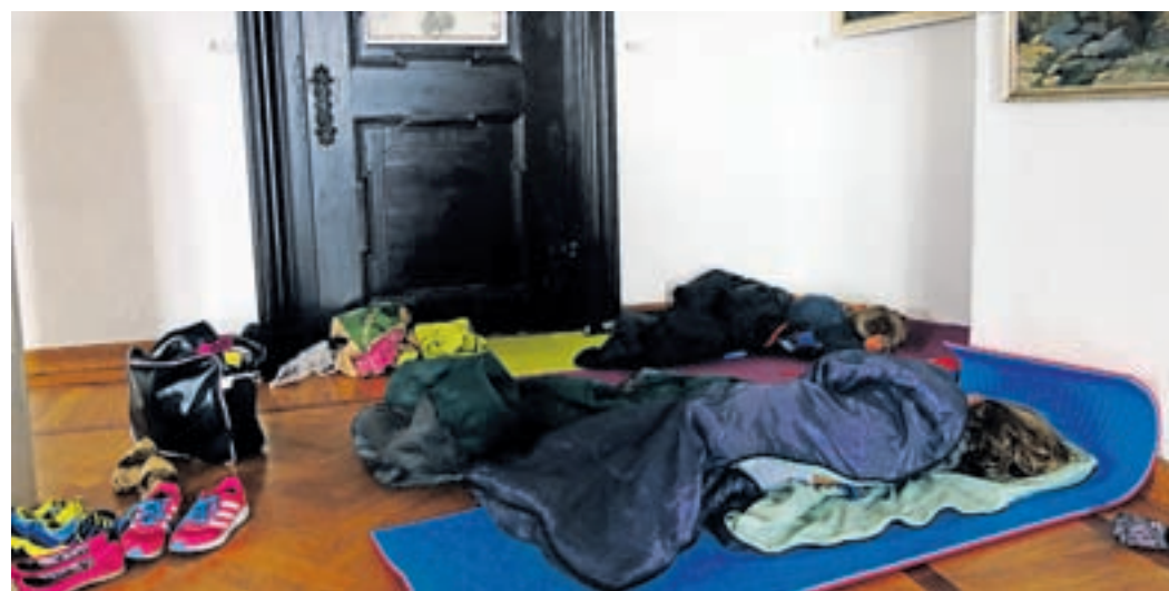
Družine so prespale v prostorih galerijske zbirke. Eni so se s trdimi tlemi težje sprijaznili, drugi pa mirno spali do zajtrka.

se imeli, in se veliko smejali. Najprej smo dobili pošiljko od Kunigunde – črno testo in naloge. Naredili smo žulice, spekli smo čokoladne kekse v obliki netopirja, duhca in mačke. Ob keksih smo spili poseben Kunigundin čaj. Ko smo preverjali, ali so vsa vrata zapahnjena, smo srečali Kunigundo, ki je začarala zmaja. Šli smo skoraj na vrh gradu in