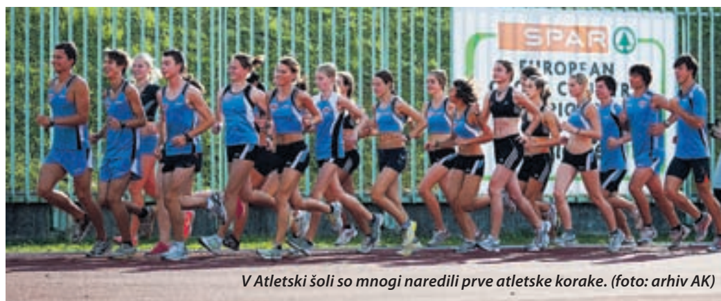
V Atletski šoli so mnogi naredili prve atletske korake.

Za uspešnimi člani stoji odlični podmladek, od kategorije U12, v kateri začinjajo otroke usmerjati v tekmovalno atletiko, do mladincev. »Imamo tudi lepo število reprezentantov in katego-