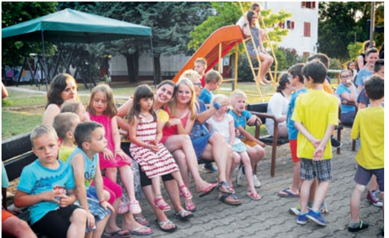
Mladi iz Šaleške doline so tudi letos v koloniji izjemno uživali. Nova prijateljstva, tudi ljubezni, so se rojevala prav vsak dan.

Kljub visokim dnevnim temperaturam je bila konec junija temperatura morja še sveža. Otrok to seveda ni motilo. Tisti, ki niso znali plavati, so se večšine učili v toplem bazenu. V času kolonije so številni splavali, tisti, ki so bili v vodi še malce okorni, pa so okrepili plavalne veščine. Dopoldnevi in popoldnevi so bili vsak dan zapolnjeni s kopanjem, po kosilu so vsak dan ustvarjali v različnih kreativnih delavnicah in sodelovali v športnih igrah. Čeprav so na soncu in