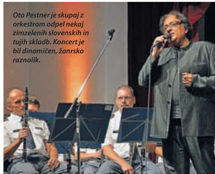
Oto Pestner je skupaj z orkestrom odpel nekaj zimzelenih slovenskih in tujih skladb. Koncert je bil dinamičen, žanrsko raznolik.

Velenje, 13. julija – Zagotovo bi bil koncert odličnega Pihalnega orkestra Slovenske policije z gostom Otom Pestnerjem še bolj čaroben, če bi ga lahko prejšnjo sredo zvečer izvedli na čudovitem vrtu vile Herberstein. Žal je to preprečilo poslabšanje vremena, ki je v dvorani velenjskega doma kulture zaradi poldanske toče dodatno oklesti-