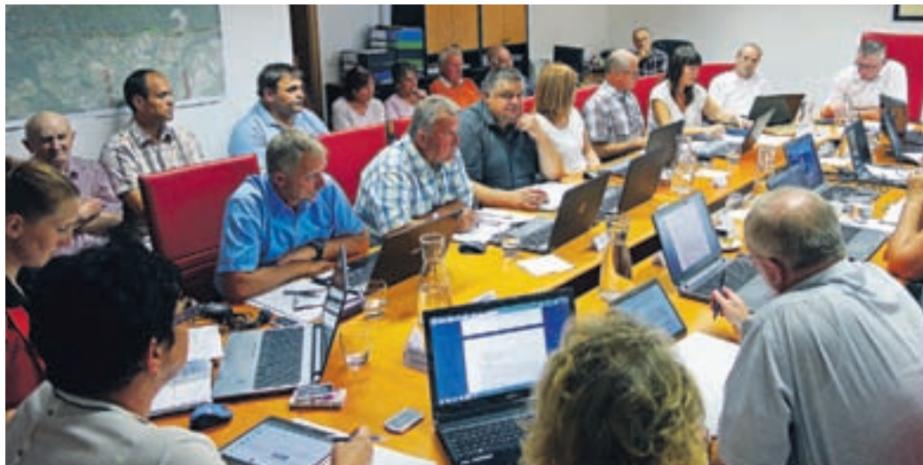
Poleg vseh svetnikov je seji prisostvovalo tudi nekaj krajanov.

Svet Občine Šmartno ob Paki je že v času lanske javne razgrnitve osnutka državnega prostorskega načrta od priključka Šentrupert na avtocesti A1 Sentilj–Koper do priključka Velenje jug podal »celo vrsto pripomb, pobud, predlogov. V tem času je bila večina zavrnjena. Nato je ministrstvo pristopilo k optimizaciji trase, občina pa je pri tem ves čas sodelovala in postavljala zahteve in pogoje, od katerih velika večina ponovno ni bila upoštevana. Najbolj se je zataknilo pri odvodnjavanju avtoceste in s tem povezane protipoplavne zaščite Hudega potoka in reke Pake, pri ureditvi ostale državne cestne infrastrukture na tem območju – predvsem mislim na most v Rečici, državno cesto Rečica–Podvin in železniški prehod v spodnji Podgori, za