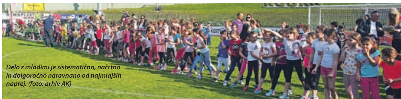
Delo z mladimi je sistematično, načrtno in dolgoročno naravnano od najmlajših naprej.