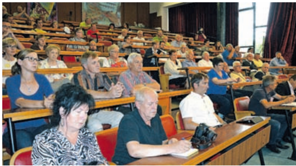
Predstavniki državnih institucij so prišli v Velenje dobro pripravljeno. Na večino vprašanih javnosti so lahko takoj odgovorili.

tudi v Braslovčah, kjer so predstavnike državnih institucij sicer pričakali s transparenti, na katerih so izražali nasprotovanje trasi, a so predstavitev in razpravo za razliko od Šmartnega ob Paki izpeljali. Spremenjena različica ceste bo dolga 13,6 kilometra, od tega bo 2,5 kilometra tekla po MO Velenje. Imela bo 4 priključke in eno počivališče z bencinskim servisom. Zaradi gradnje hitre ceste bo treba ob celotni trasi porušiti 118 objektov, od tega 46 zahtevnejših, ostalo so ute, nadstreški ipd. Rušitev bo več tudi zato, ker so se odločili, da bodo odkupili tudi objekte, ki bodo ujeti med ceste. V Velenju bo treba zaradi gradnje poruši-