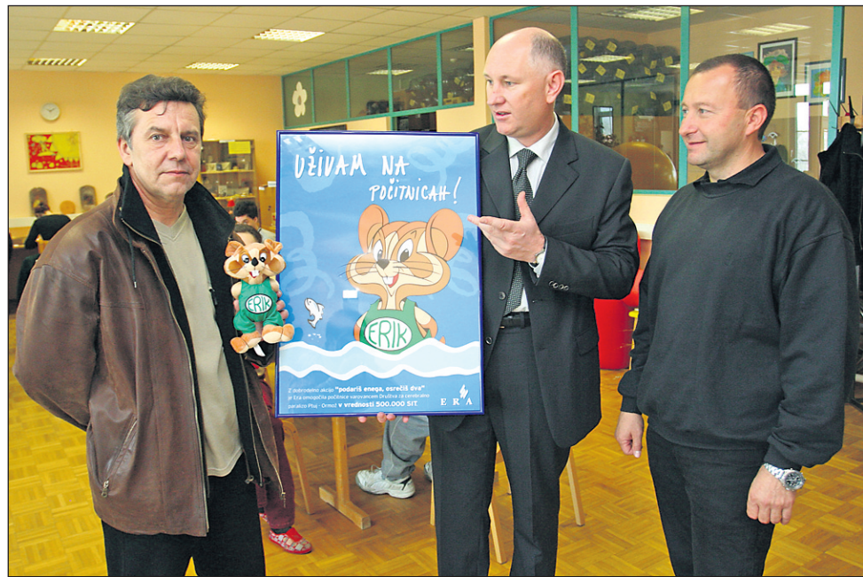
500 tisoč tolarjev za zdravstveno terapevtsko kolonijo

500 tisoč tolarjev so tako podarili centru Sonček Ptuj, varstvenemu delovnemu centru Ježek Velenje in centru Sonček Celje.