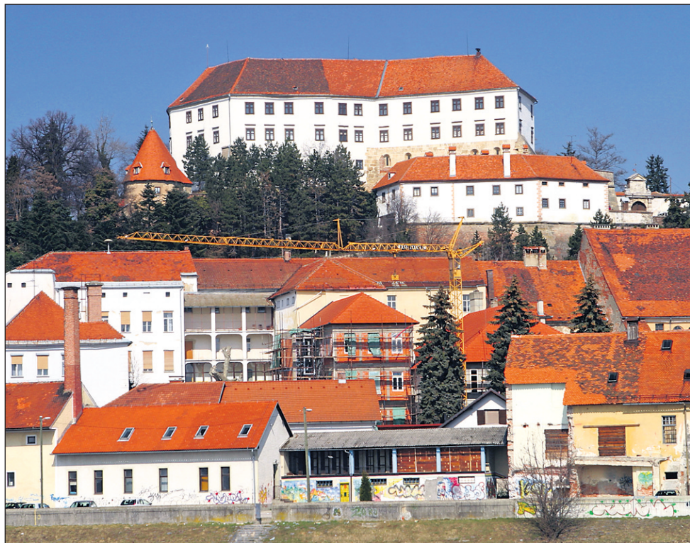
Ptuj v družbi zgodovinskih mest Slovenije

Predstavniki članic Zdrženja zgodovinskih mest Slovenije so se 10. marca v Škofji Loki seznanili s tem, da je skupni turistični prospekt združenja v zaključni fazi izdelave.