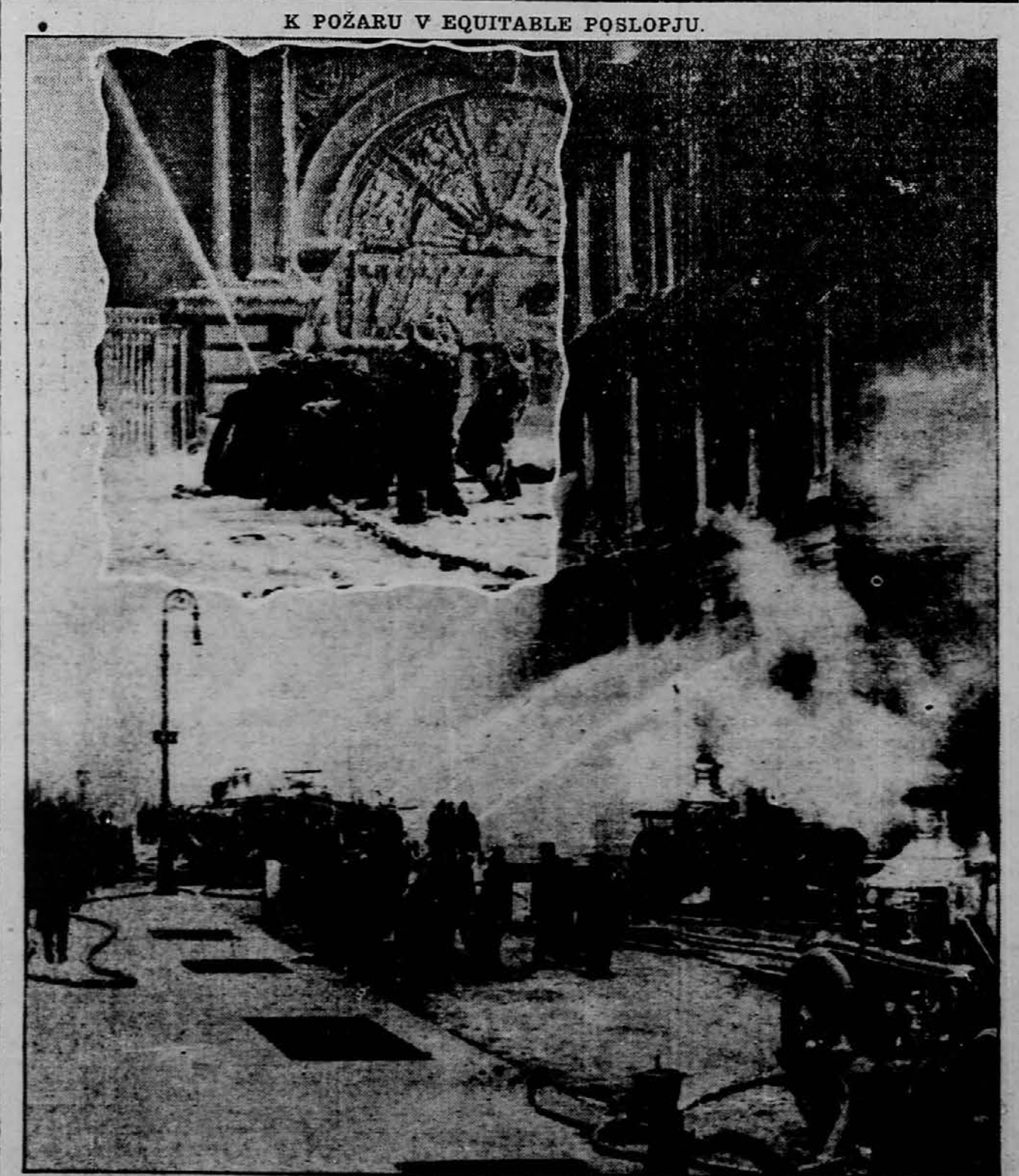
Danes prinašamo zopet sliko strašnega požara v Equitable poslopju. Is nje morete soditi, kako so morali trpeti ognjegasci vsled silnega mraza. — Manjša slika kaže glavna vrata pogorelega poslopja, ki se nahajajo še sedaj čisto v ledu.

Parnik od Austro-Americana odpluje dne 17. januarja. Voznja stane iz New Yorka do: Trsta in Reke $35.00, Ljubljane 35.60, Zagreba 36.20. Voznje listke je dobiti pri Fr. Sakser, 82 Cortland Street, New York.