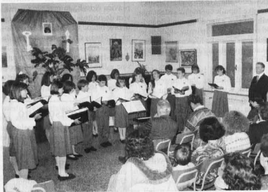
Dekliška pevska skupina »Vesela pomlad« poje na Slomškovi proslavi

Zadnje dni meseca novembra, ob obletnici rojstva velikega škofa Antona Martina Slomška, se leto za letom zvrstijo proslave v njegovo čast vse od zgraditve mladinskega doma v Bazovici, ki je tudi po njem imenovan.