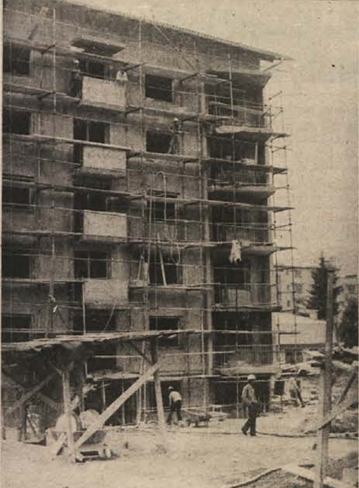
Gradbeno podjetje BETON iz Zagorja bo prihodnji mesec predalo kupcem 29 stanovanj v novem bloku. Večino stanovanj sta odkupili JUTRANJKA in LISCA, v začetku tedna je bilo neprodano le še 4no trisobno stanovanje. Minuli teden so pričeli tudi že z izkopi za 8 nadstropni blok s 55 stanovanji, dograjen naj bi bil prihodnje leto poleti. Predvideni so še trije taki bloki. Na sliki: v glavnem so na gradbišču le še obrtniki.

Sevnške trgovce tarejo skrbi zaradi velikih zalog. V sevnški Železnini imajo za milijon dinarjev zaloga, kateri predmet obrnoje le enkrat ali dvakrat na leto, morali pa bi ga v tej stroki 8-krat ali 10-krat. Prava, da imajo največje zaloge v celjski regiji. Da bi se tega rešili, bodo morali ali zmanjšati založenost ali pa doseči, da bi se kupci pogosteje oglašali v trgovinah.