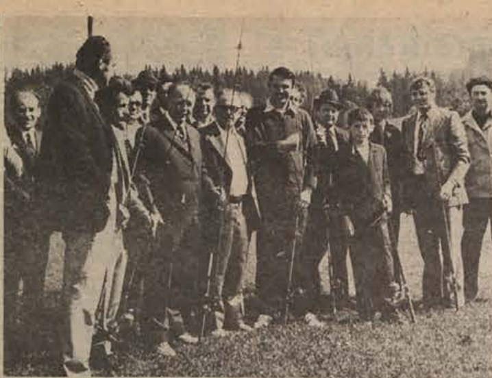
Člani ribiške družine Ribnica vsako leto prirejajo meddruštveno tekmovanje v suhi disciplini - „metu v tarčo“. Letos je bilo tako tekmovanje 20. maja v Velikih Laščah.