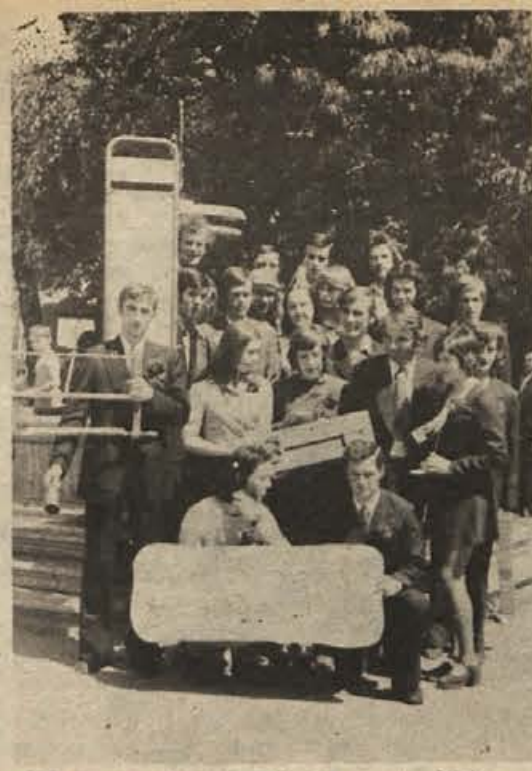
Ob koncu maja smo v Novem mestu videli sprevod prvih Novolesovih maturantov – lesnih tehnikov. Novoles bo v sodelovanju s tovarno IMV v letu 1973/74 odprl še en oddelek TSS lesne stroške v Novem mestu. Nova možnost za dolenske šolarje.