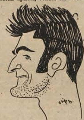
Zanesljivo drugi - Ponikvar

Borbeni Tržičani so se sicer poskušali upirati, vendar niso bili kos