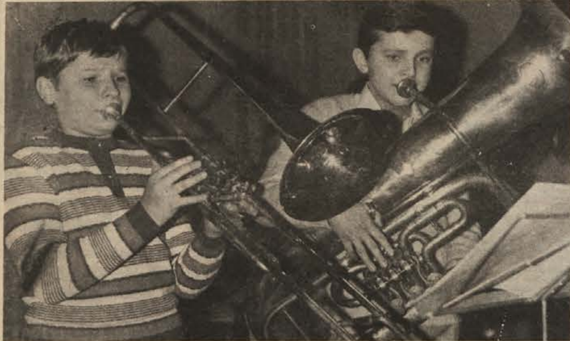
Nocoj bo v prosvetnem domu javni nastop učencev glasbene šole Brežice. Ob tej priložnosti bodo podelili zlate lire učencem, ki se letos poslavljajo od šole in ki so bili vsa leta vestni in prizadevni.

Za žive meje so na voljo javor, guster, smreka, tuhuja, javor, maklura in gledičija. Nekateri od teh sadik so posajene v polju, nilastih vrečkah in jih lahko dobite vse leto. Izbor okrasnih sadik je vodstvo drevesnice prikazalo na cvetlični razstavi v Brežicah, kjer so obiskovalci pokazali zanje izredno zanimanje. To je bila prva javna informacija o možnostih za nakup okrasnih rastlin v krški občini. J. T.