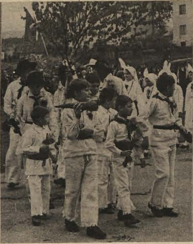
Na fotografiji: piskači in trobentači spremljajo zelenega Jurija na lanskem jurjevanju. Na letošnjem jubilejnim pričakujejo več tisoč obiskovalcev.

Na letošnji prireditvi, ki se bo začela v soboto ob 20.30 s kresovanjem in semiško ohceto, nadaljevala pa v nedeljo ob 9.30 z zelenim Jurijem, belokranjskimi koli in svatbenimi običaji ter nastopom gostov, bo sodelovalo vseh deset belokranjskih folklornih skupin. Prišli bodo iz Adlešičev, Bojancev, Črnomlja, Dragatuša, Metlike, Predgrada, Preloke, Semiča, Starega trga in z Vinice. Med gosti bo karlovska folklorna skupina, povabili pa so še skupino iz zamejske Režije ter oraje iz ptujske občine