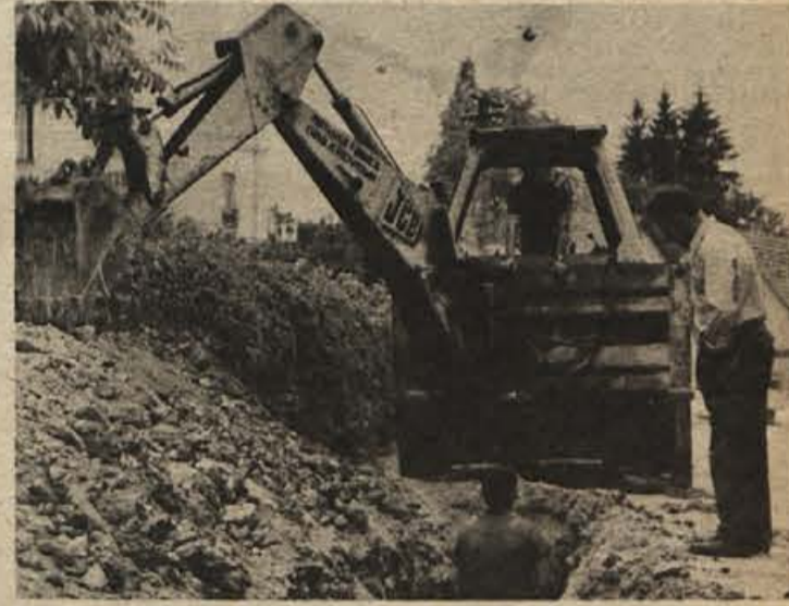
Na Ragovski cesti v Novem mestu so začeli z deli za napeljavo vode do novega naselja na Brudarjevih njivah, kjer bosta do jeseni zgrajeni tudi dve PIONIRJEVI stolpnici, kasneje pa še trgovina.