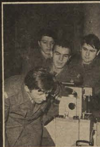
Kadeti pri elektronskem mikroskopu, kjer se lahko poglabljajo v molekularno zgradbo snovi