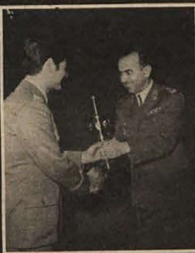
Načelnik akademije kopenske vojske general Mamula izročja pokal zmagoviti športni ekipi