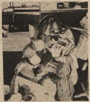
Operacija je najkrajši del posla!