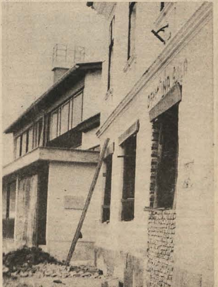
V tem trenutku je največje šolsko gradbišče v Velikem Gabru. Nova šola bo nared do 2. septembra, za občinski praznik. Te dni so pričeli preurejati tudi staro stavbo, ki bo poslej povezana z novo. Ker pouk še ni zaključen, dela v stari stavbi pa tečejo, imajo tri razrede že v novi stavbi. Brez samoprispevka ne bi bilo nove šole niti ne bi bilo s čim urejati stare.

V Trebnju so pripravili dva predloga za samoprispevek: po prvem bi plačevali od svojih osebnih dohodkov 1,5 odstotka, po drugem pa 2. Katastrski dohodek, od katerega plačujejo kmetje davke, že 10 let ni bil spremenjen: zato naj bi kmetje dali za samoprispevek po prvi in drugi 4 odstotke, po drugi pa 5 odstotkov od katastrskega dohodka. Obrtniki naj bi prispeva-