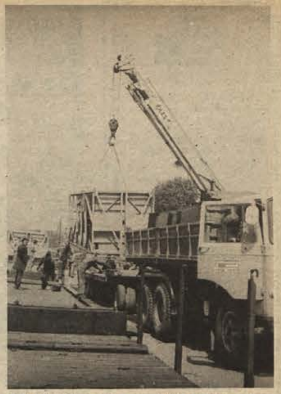
SGP PIONIR pošilja na gradbišče v Zakopane pošiljke mehanizacije in raznega materiala. Predvideno je, da bodo poslali na Poljsko več kot 6.000 ton gradbenega materiala in gradbene mehanizacije. Organizacijo transporta opravlja FERSPED iz Ljubljane.