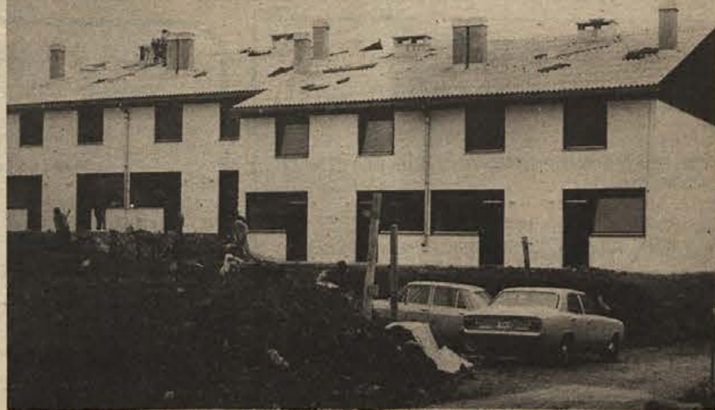
PIONIRJEVI delavci hite z zaključnimi deli na Volčičevi, da bodo vzorčne hiše „361“ do ponedeljka nared za radovedne goste