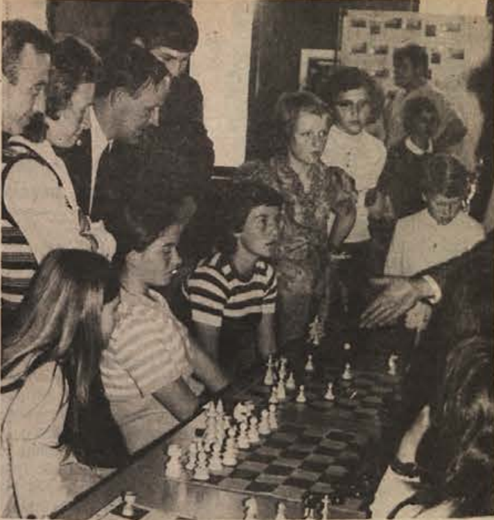
Osnovnošolci in srednješolci z Dolenjske so se letos dobro uvrstili na slovenskih finalnih tekmovanjih. Na fotografiji S. Mikulana: zanimanje za finale v šahu, ki je bilo na grmski osnovni šoli.