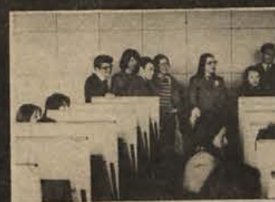
V sodobnem kabinetu za učenje tujih jezikov: vsak gojenec ima v svojem oddelku magnetofon s slušalkami in možnost nadzora lastne izgovorjave

Vojaška akademija kopenske vojske JLA je bila osnovana 21. oktobra 1944 v Beogradu. V prvi razred so prišli mladi borci partizanskih brigad in odredov z različnih bojišč ter najboljši mladinci, skojevci in mladi komunisti z osvobojenih in neosvobojenih področij iz vseh krajev naše domovine. Danes so to oficirji z visokimi čini in položaji v naši armadi.