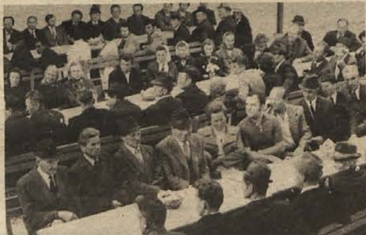
Kljub obilici dela v lepem vremenu se je v četrtek veliko kmetov udeležilo razgovora o tem, kako do večjega pridelka krompirja.

V ponedeljek in torek so sprejeli Mirenčani v goste svetovno znani češki mladinski pevski zbor iz Liberec. Češki zbor, ki je pred tem nastopil na mednarodnem pevskem festivalu v Celju, se je na Mirni predstavil najprej šolskim zborom iz trebanjske občine. Na večernem koncertu v ponedeljek pa je tovarna rastlinskih specialitet in destilacija DANA prevzela patronat nad mirensko osnovno šolo. Češki gostje so si ogledali DANO in se zabavali v mirenskem rekreacijskem parku.