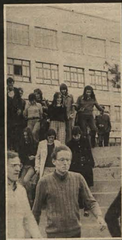
Študentje iz Ljubljane na sprehodu po parku okrog akademije