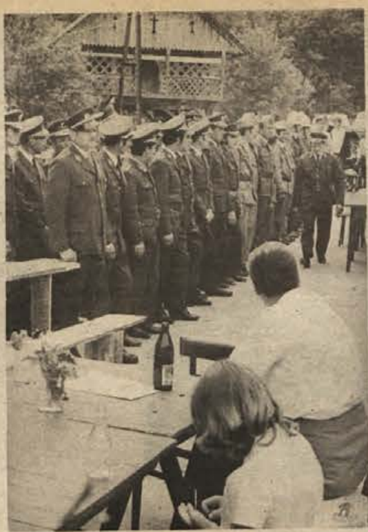
Krajevna skupnost Brusnice je v nedeljo praznovala svoj praznik. Proslavo z gasilskimi vajami, na katerih so sodelovali gasilci iz društev Gabrje, Brusnice, Smolenja vas in Ratež, je pripravilo PGD Ratež in s tem po polletnem obstoju prvič opozorilo nase.