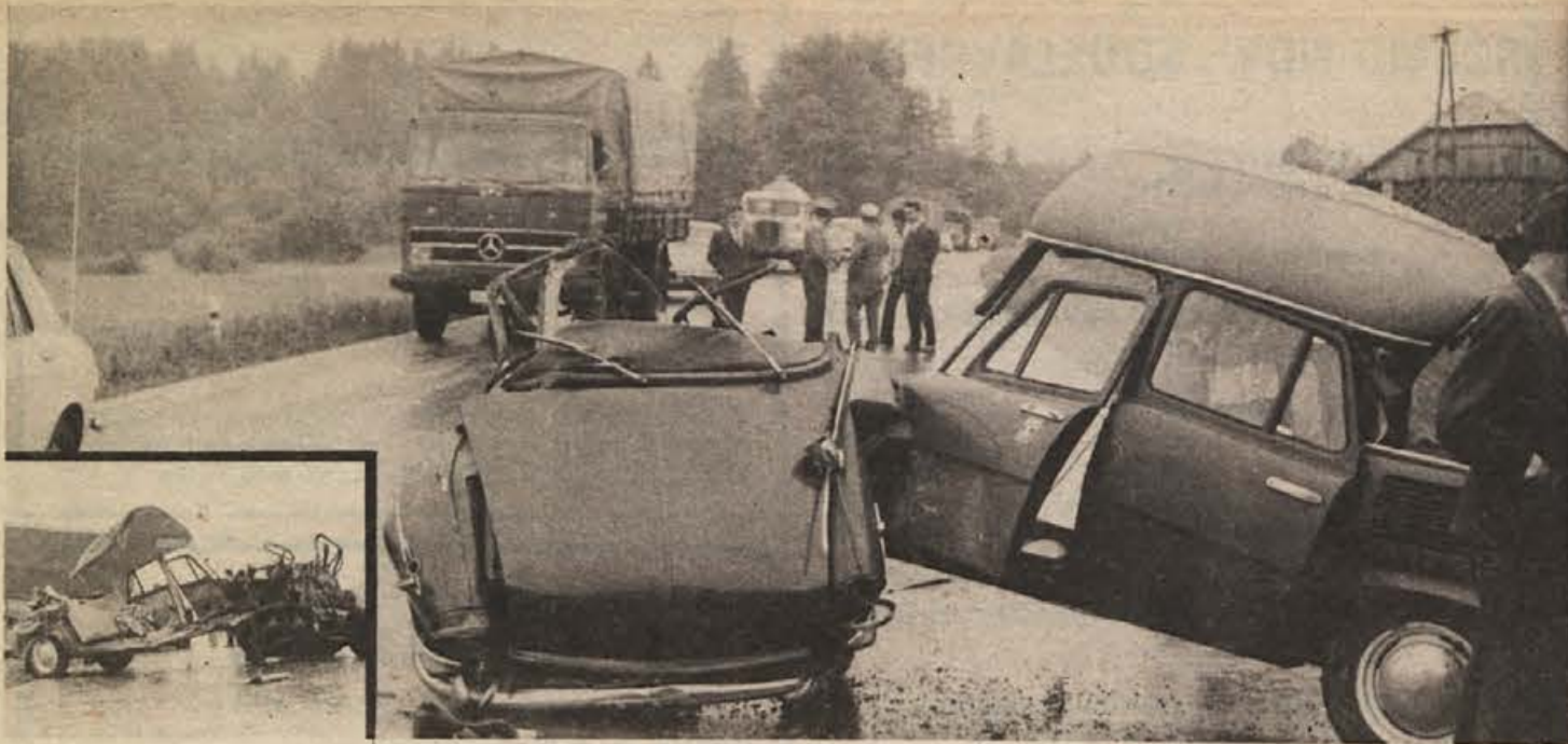
Zaviranje na mokri cesti se je končalo katastrofalno: s črno točko označena cesta pri Jezeru je pordela od krvi