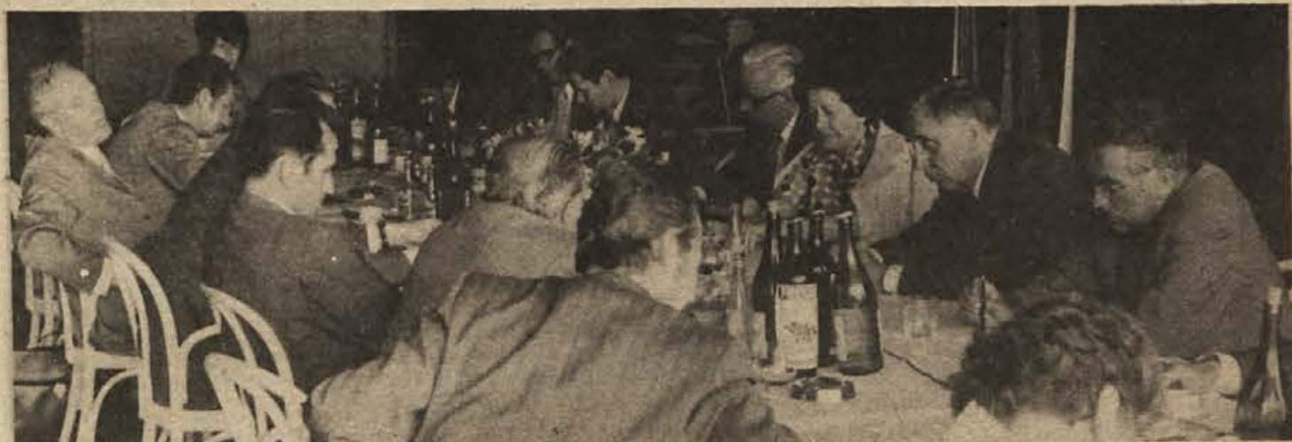
MEDREPUBLIŠKA IZMENJAVA MNENJ NA OTOČCU. V ponedeljek sta se na Otočcu sestali delegaciji ZK Slovenije in ZK Hrvatske ter izmenjali izkušnje in mnenja o družbenopolitičnih razmerah, posebej pa še o delovanju Zveze komunistov. Delegaciji so sestavljali najvišji predstavniki političnega življenja iz obeh republik.

V soboto in nedeljo bo v Črnomlju jubilejno jurjevanje pod pokroviteljstvom ljubljanskega Viatorja. Prva prireditev je bila namreč pred 10 leti, zato se bodo letos organizatorji še posebno potrudili. V soboto ob 20.30 bo kresovanje in semiška ohcet, v nedeljo ob 9.30 pa nastop zelenega Jurija, zaplesali bodo belokranjska kola, pokazali svatbene običaje, prisle pa bodo tudi folklorne skupine iz drugih krajev. Na fotografiji: lanski nastop Gorenjcev.