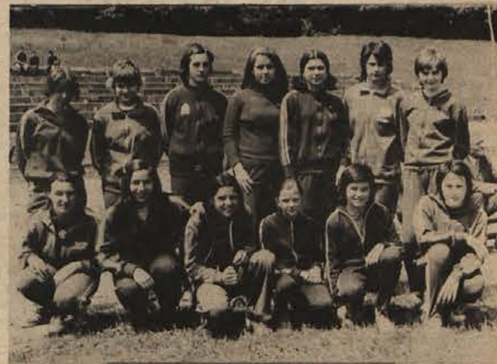
VELIK USPEH GRMSKIH ATLETOV - Pionirke - atletinje z Grma, ki so se v Kranju uvrstile na odlično drugo mesto.

Za ljubitelje košarke v Novem mestu pa bo še posebno zanimiva tekma, ki jo Novoteks v okviru letošnjih proslav ob 25. obletnici košarke pripravlja za prihodnji četrtek, 14. junija. Na Loki bo gostovala mladinska reprezentanca Slovenije.