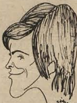
Sedme - Englova

Brežičanke so brez težav premagale tudi Olimpijo in se usidrale na sedmem mestu. Takoj v začetku so povedle s 4:0, potem pa so prednost branile in ob koncu celo povečale. Brežičanke so se izkazale v obrambi, v napadu pa so igrale do zanesljivega položaja za strel.