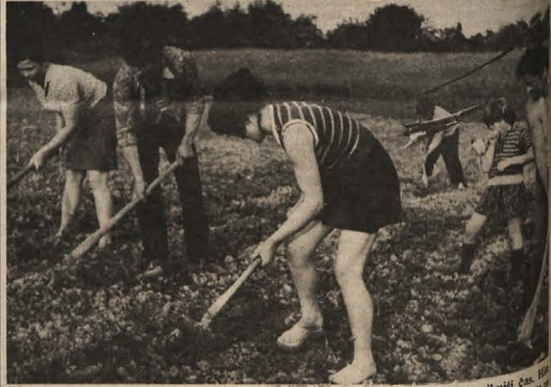
Kar veselje je pogledati na njivo, kjer dela toliko mladih rok. Zdaj je za kmete najhujši čas. Hiti okopavati koruzo, sušiti krmo in še delo v vinogradih jih čaka. Gornja fotografija je bila posneta na Zdolah.