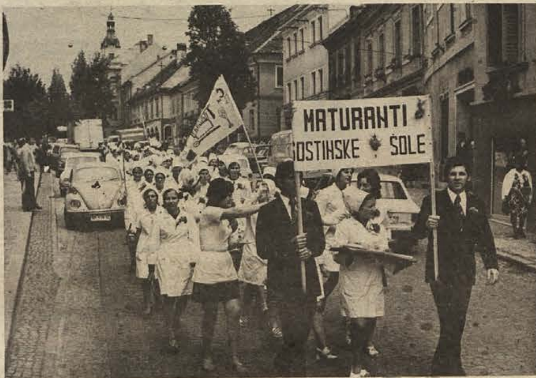
„Gaudeamus igitur“ (torej veselimo se) pojo te dni maturantje, ko pride radostni trenutek, konec štiriletnega šolanja. Vrata v življenje se odpirajo, in zadnjič so štiriletni tovariši skupaj, predno se razidejo. Tak trenutek je seveda treba primerno proslaviti. Na sliki maturantje gostinske šole.

V prvi polovici tedna so bili naši kraji pod vplivom jugozahodnih zračnih tokov, ki so povzročili občasne pooblačitve in v ponedeljek tudi nevihte. Do konca tedna se bo zadrževalo nestalno vreme, v popoldanskem času bodo plohe ali nevihte.