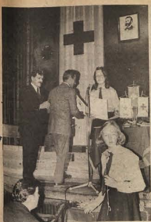
1. junija je bila v Novem mestu ob 20. obletnici krvodajalstva slovesnost in podelitev priznanj aktivistom Rdečega križa in organizatorjem krvodajalstva v novomeški občini. Prejeli so jih: IMV Novo mesto, gozdna obrata Podturen in Straža, Hmeljniki in KZ Novo mesto.