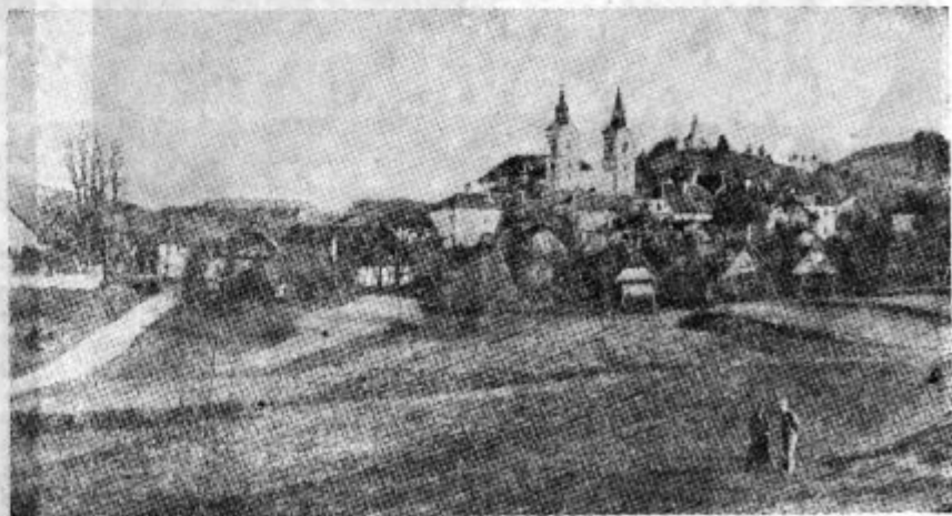
POGLED NA LASČE (slovenske Atene) (K ribniškemu večeru v soboto ob 20.)

so zelo umestne prireditve našega radijskega sporeda. Saj se na ta način najbolj neposredno seznanja naš podeželski človek, ki mu je glasba življenjska potreba, z domačo glasbeno produkcijo; spoznava, kaj je glasba njegove domovine, presoja, koliko je sorodna z njegovim lastnim svetom in koliko je temu svetu odtujena kot privesek tujih glas-