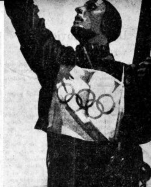
ZIMSKI OLIMPIJSKI ZNAK

Ves spored je usmerjen ne kot klasična, umetniška institucija,