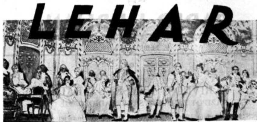
Prizor iz operete »Friderika«