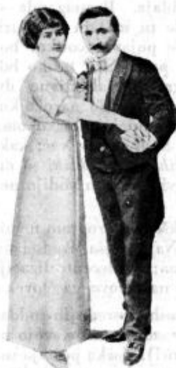
Valček iz »Vesele vdove«, ki so ob njem plesali naši starši

Prvi večji uspeh je doživel s svojimi »Rastelbinder«. Po tej opereti je Lehár postal nenadoma slaven. Sledeči deli nista obdržala koraka s tem uspehom. Niti »Göttergatte« niti »Juxheirate« se nista obdržala na odrih. Njim je sledilo nekaj čisto posebnega, otroška opereta »Peter und Paul reisen ins Schlaraffenland«. Ta je bila predhodnica za svetovni uspeh »Die lustige Witwe«, ki se je uprizorila na Dunaju l. 1905., torej v istem letu, ko se je v Brnu igrala »Tatjana«. Tako je postalo leto 1905. srečno leto za operetnega komponista Lehárja, pa tudi leto resignacije za opernega ustvarjalca Lehárja. Po treh zopet pozabljenih delih (»Mitislav«, »Der Mann mit den drei Frauen«, »Das Fürstkind«) je s svojim »Grofom Luksenburgskim« dosegel zmago, ker so ga igrali po vsem svetu. To mojstrsko delo izžareva dih in vonj elegancije, bohemske romantike in življenjskega veselja. V naslednjih dvanajstih delih se je utrdil Lehárjev svetovni sloves bolj in bolj; četudi ni vsako delo tako udarilo v svet kakor »Grof Luksenburgski«, vendar dokazujejo o neovrgljivem umetniškem napredku. Iskreno prijateljstvo, ki je komponista vezalo z Giacocom Puccinijem, ni ostalo brez vpliva. Vsekakor si je komponist tudi v Italiji osvojil tla z opereto, ki jo je ustvaril v italijanskem jeziku: »La danza delle libellule«. To ljubezljivo karnevalsko delo je silno odgovarjalo igalskemu čutu južnjakov in je imelo zato brezprimeren uspeh. Zal se pa ni moglo prenesti na sever, kajti