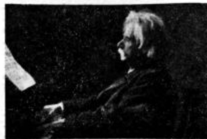
EDWARD GRIEG, slavni skladatelj