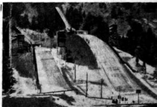
SMUŠKA SKAKALNICA V GA-PA

Mi se trudimo za vas. Ali ste vi že kaj strili za svoj list? Ali ste nam pridobili kakega novega naročnika? Dajte, pomagali boste svoji lastni in naši skupni stvari!