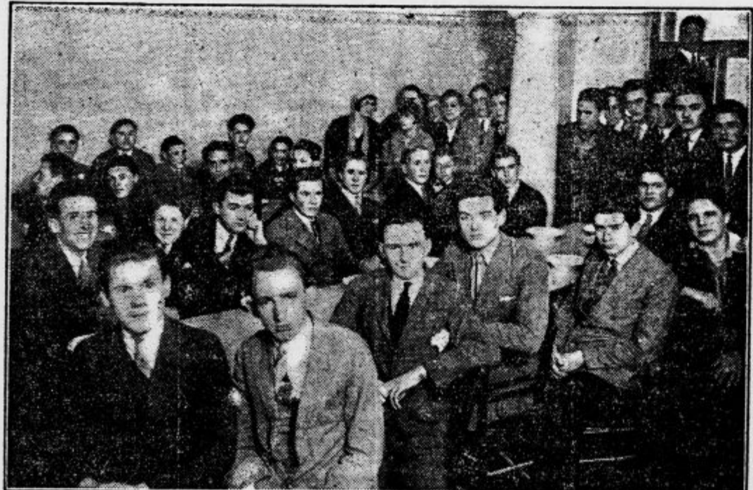
V veselem pričakovanju izdatnega kosila