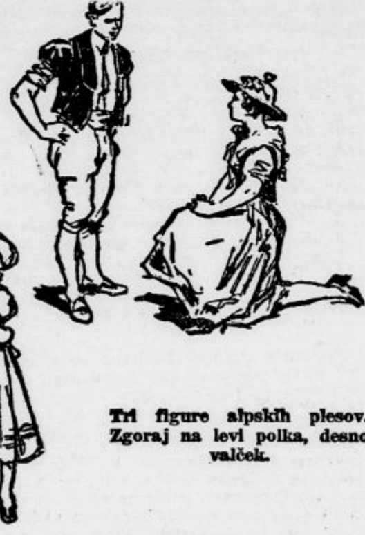
Tri figure alpskih plesov. Zgoraj na levi polka, desno valček.

vine. Da ne sežemo predač, omenjamo, da je bil ples že pri Grkih in Rimcih sestavni del obrednih svečanosti. A ples ni verska manifestacija, vsaj ne več dandanes. V njem izraža tudi najpreprostejši, še napol divji človek svoje mimično čustvovanje, išče svojemu pogledu na svet kolikor mogoče dovršene oblike. O tem pričajo plesi primitivnih ljudstev, ki so še na najnižji kulturni stopnji. Ni torej nobenega dvoma o tem, da razodeva ples umetnostni nagib, kar je popolnoma pravilno, saj je materijalizacija ritma, o katerem vemo, da spada med elemente življenjske sile.