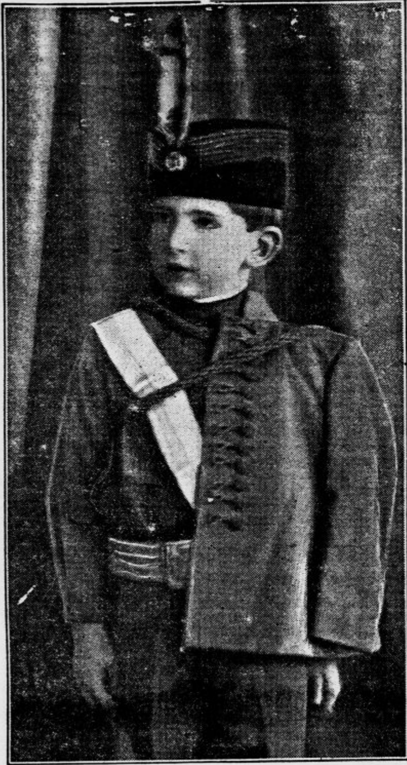
Prestolonaslednik Peter v sokolskem kroju kot starešina Sokola kraljevine Jugoslavije