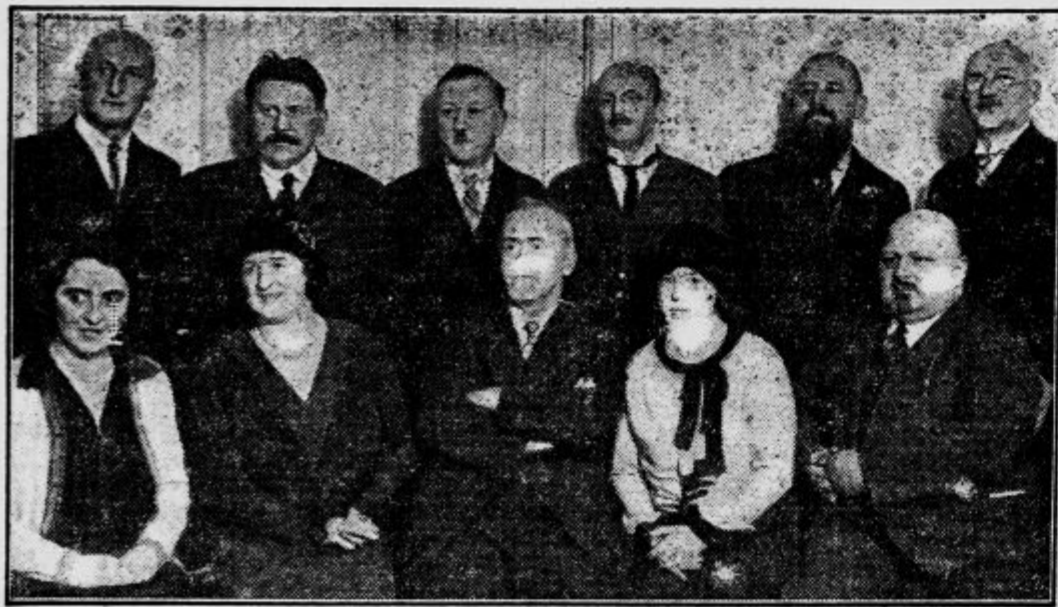
Sedanji odbor dijaške kuhinje „Domovine“