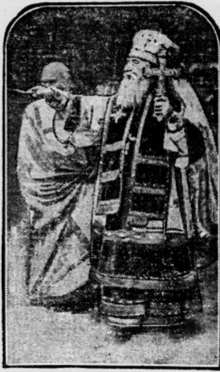
Blagoslovljenje vode v Parizu

bajke arktičnih plemen Azije in Amerike. Vendar se bo dala ta domneva težko dokazati, saj je znano, da so živeli polarni narodi do nedavna v kulturnih razmerah, ki imajo vse tipične znake človeške kulture iz kamnite dobe.