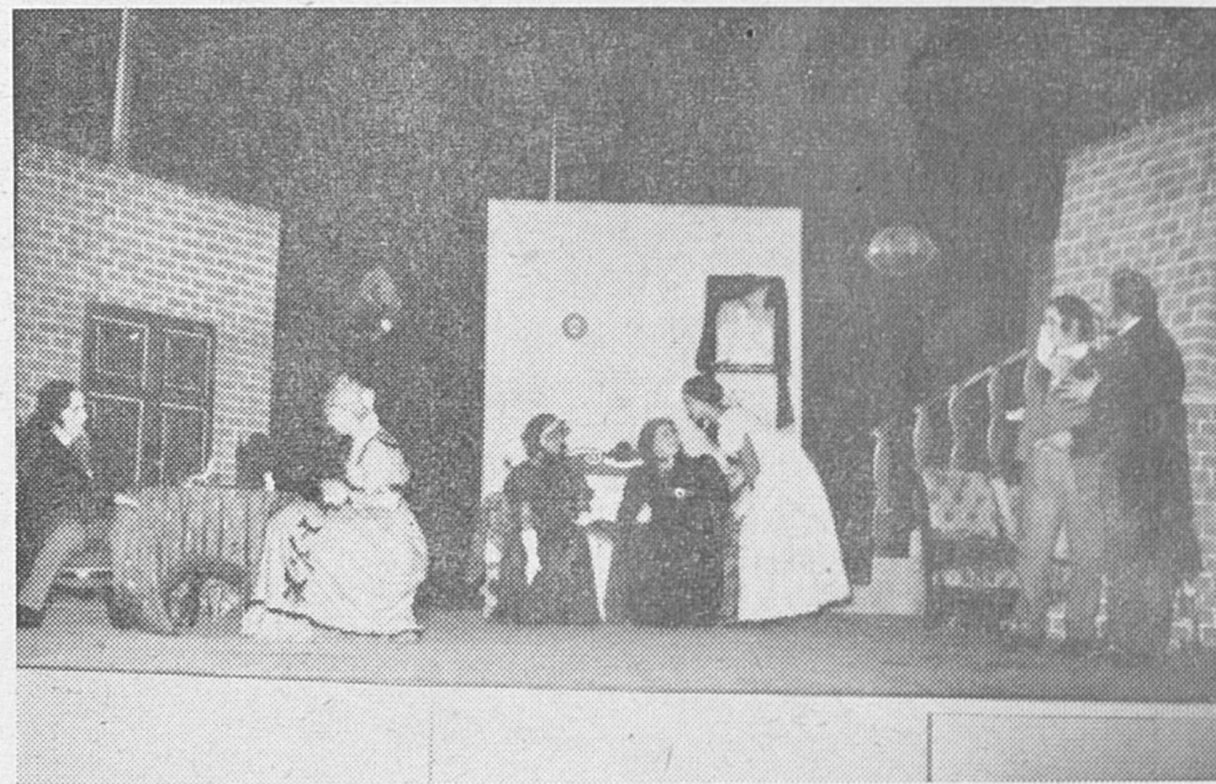
Prizor iz I. dejanja — sprejem v Slaparjevi hiši