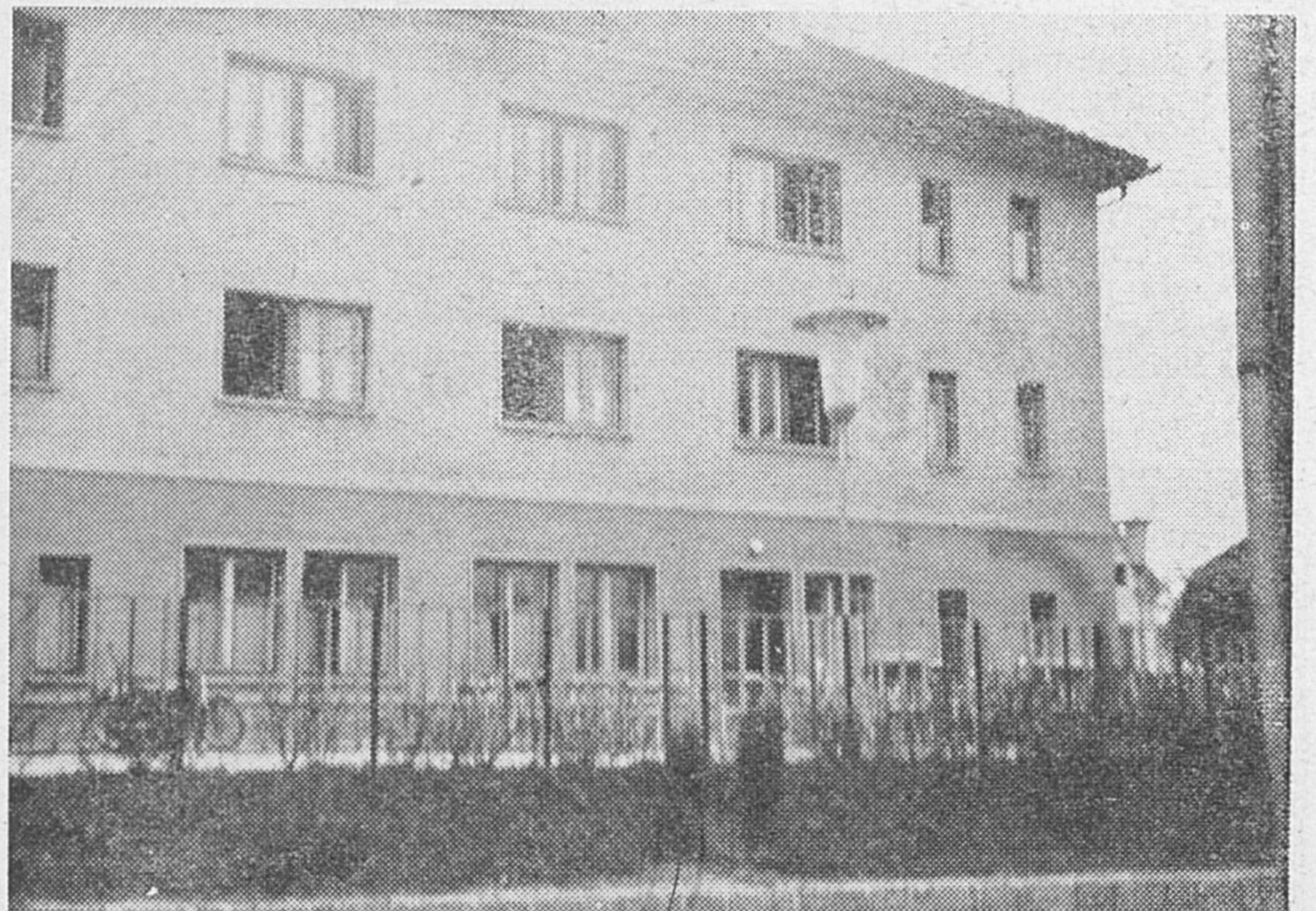
Letne sezone je konec. Mnogoštevilni gostje so se preselili v toplejše prostore. Plesni prostor hotela »Jezero« v Cerknici pa bo počakal na toplejše spomladanske dni