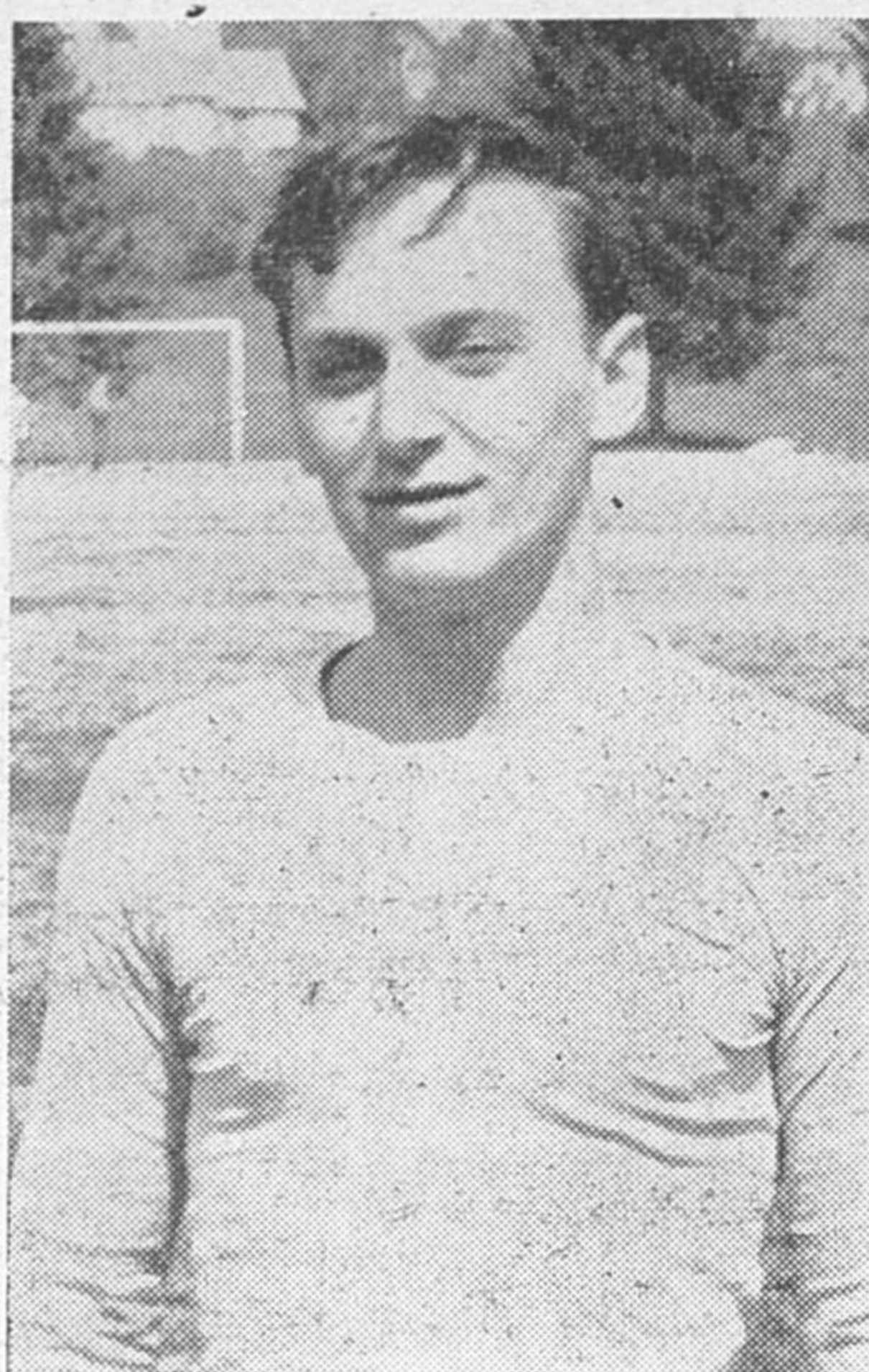
Raljevič iz Rakeka

kega spričevala, rabijo še nekaj rutine in športnega staža, da bodo dobri igralci.