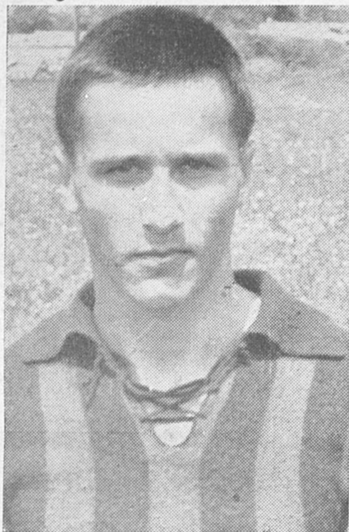
Razdrih iz Cerknice

Rakek je nastopil le z 10 igralci, ker so nekateri odpovedali! Klje je tekmovalna resnost, se vprašamo. V izenačeni borbi za