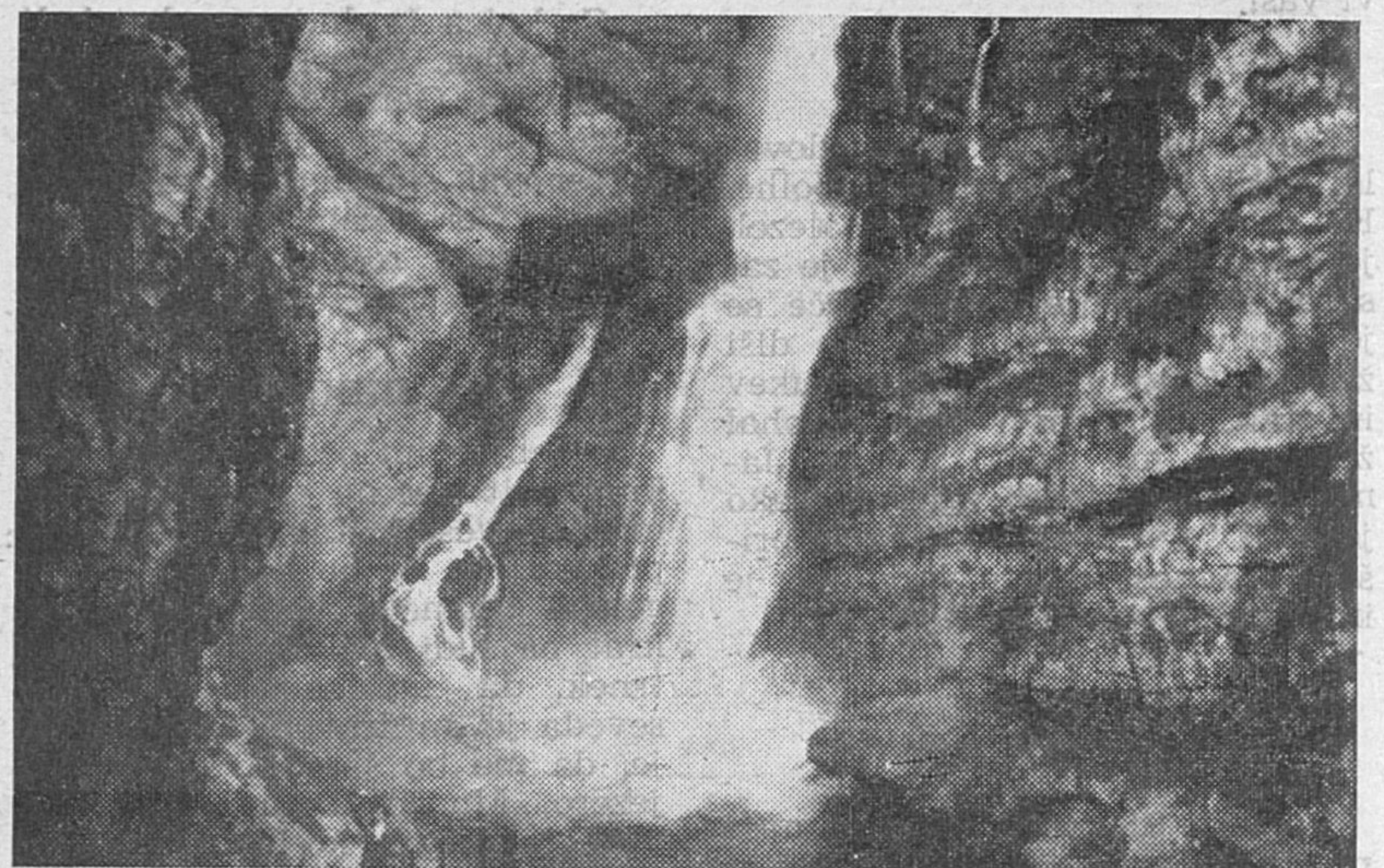
Slap Savica, ki so si ga ogledali posamezni člani kolektiva tovarne pohištva Brest Cerknica

Z rezultatom smo zadovoljni, sam tekmovalec pa nas je opozoril na nujne predhodne priprave, ker je bil sam brez priprav. Tekmovanje pa je bilo zahtevno.