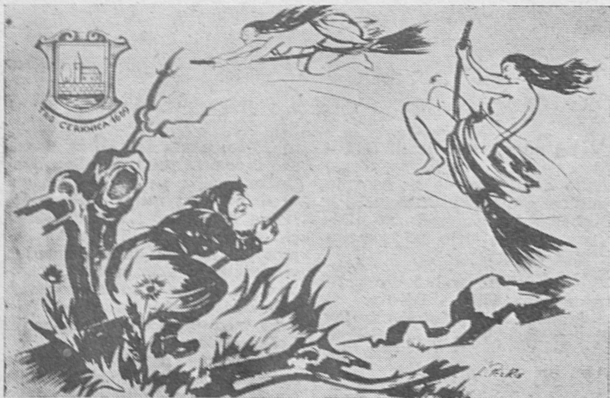
Posnetek Perkove zgrafite »Plen čarovnic«, upodobljen v Domu na Slivnici