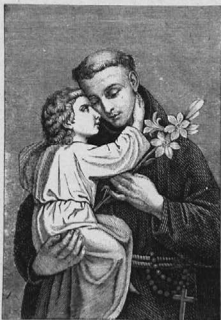
Sveti Anton Padovanski.