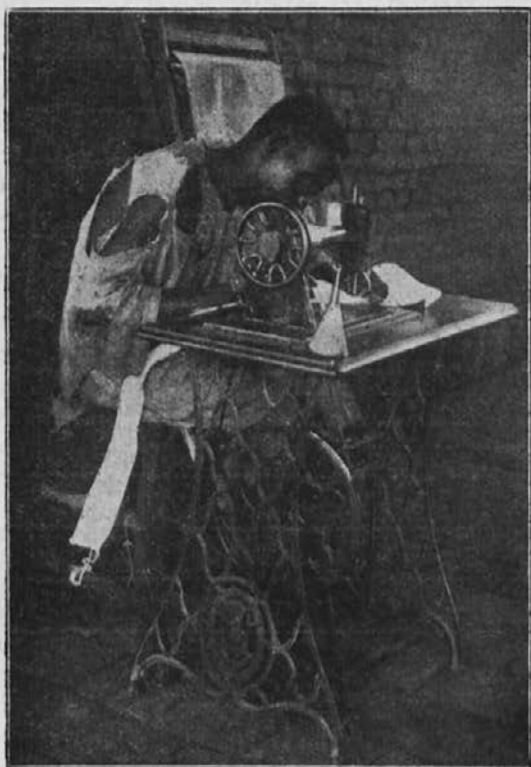
Zamorski krojač iz misijona o. Mlakiča.

Tukaj smo skozi 6 do 8 mesecev (deževna doba) na malem otoku. Kadar pa se naravni kanali in mlake posuše, obiskujemo vasi. Najbližja vas je od nas oddaljena eno in četrt ure. Nuari se držijo daleč od obale. Radi trgovcev sužnjev so prišli v dolgih letih do žalostne izkušnje. Mi pa se moramo držati obale radi živeža itd., ki nam ga dovaža parnik; zato bi potrebovali motorno kolo. Če