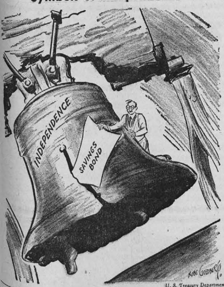
U. S. Treasury Department