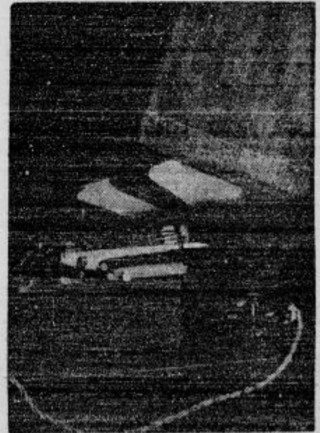
Stroj za sušenje in likanje čevljev na električni pogon so iznašli.

d Pecen nevesta. Za 100 din in za enega osla je prodal ženo neki Ajdah Ačifovič