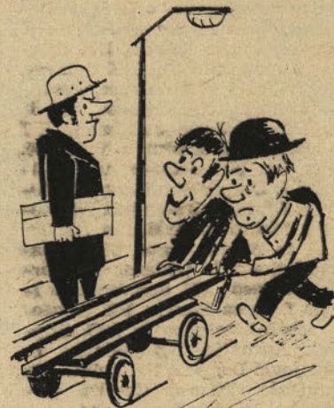
Kar po asfaltu z železniškim vozikom. V inovacijskem letu 1975 bodo že kaj pogruntali