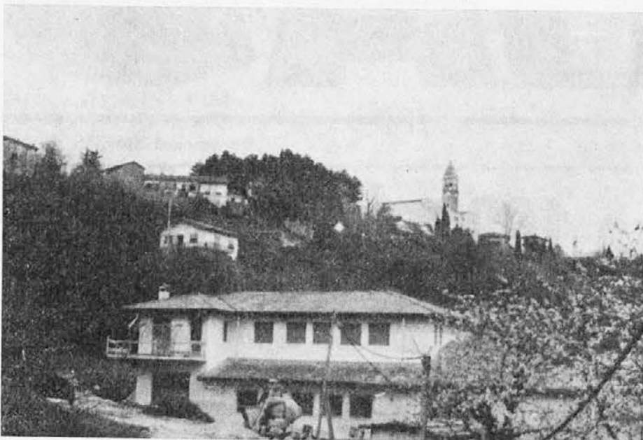
Pogled na Števerjan z jugovzhoda: spodaj nova šola, višje Borovci, zraven župnijski dom, v ozadju zvonik farne cerkve sv. Florijana

Najprej zakaj Števerjan? Zato, ker je zapisano v knjigah pred prvo svetovno vojno St. Ferjan, Nemci pišejo St. Verjan, (V = F), ŠTEVRJAŃ po domače, brez samoglasnikov e - a; za lepšo izgovorjavo je nastala beseda »Števerjan«.