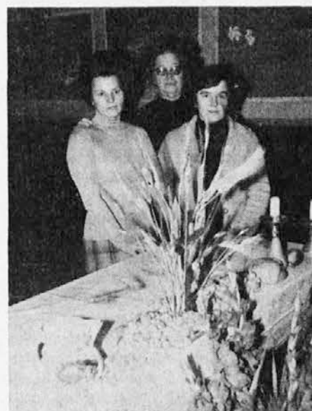
Tri zveste krasilke oltarja v nabrežinski župnijski cerkvi

Zahvalna nedelja. Udeležba pri službi božji je bila lepa, vreme primerno. Oltar je bil okrašen z vrtnimi in poljskimi pridelki. Prošnje so bile prazniku primerne, nato zahvalna pesem. Pred cerkvijo je bil blagoslov vozil, nato pa je sledilo pokušanje novega vina ob pečenem kostanju. Župnijski svet je tudi letos preskrbel vse potrebno za prijeten družabni večer v župnijskih prostorih.