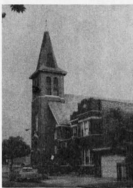
Cerkve sv. Stefana v Chicagu