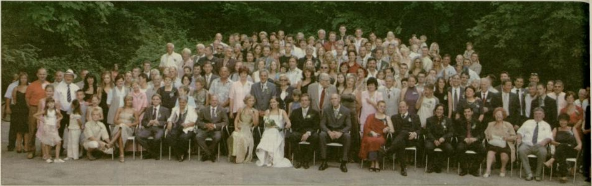
Na gasilski fotografiji je tudi »mali Perke«, ki bo privekal čez nekaj mesecev. Prvo, pa muško!