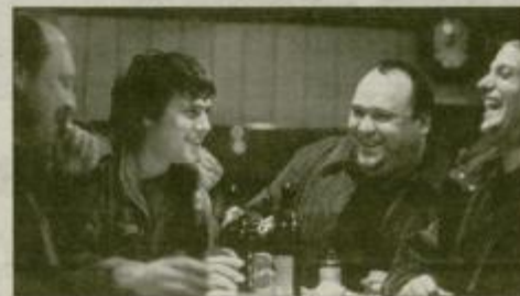
Med izbranimi filmi je tudi film Rezervni deli Damjana Kozoleta