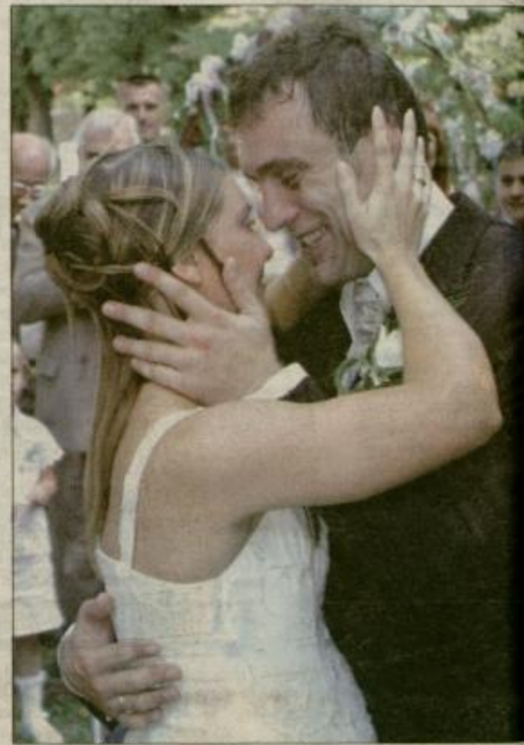
Ženin nevesti: »Sreča moja, postaraj se z mano!«