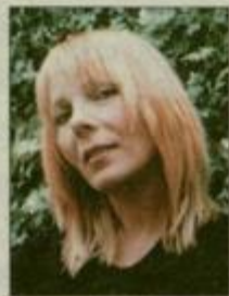
Pripravila: VLASTA ČAH ŽEROVNIK

Obljubljam, da ne bomo kar takoj iz novomodnega kosa natrosili vseh novosti (in, roko na srce, tudi norosti), ki nam jih prinašajo novi jesenski modni trendi. Novosti, ki