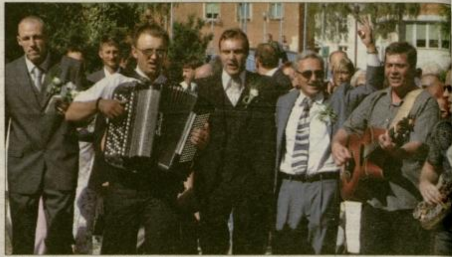
Daleč naokoli so odmevali hitri ritmi »naše« glasbe. V sredini mladoporočenec, levo pa njegova poročna