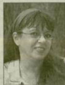
Piše: METKA OBRUL - ZOYA

Težave z zdravjem vašega moža ne bodo minile same po sebi, vendar pa tudi večjih nepredvidenih težav ne bo.