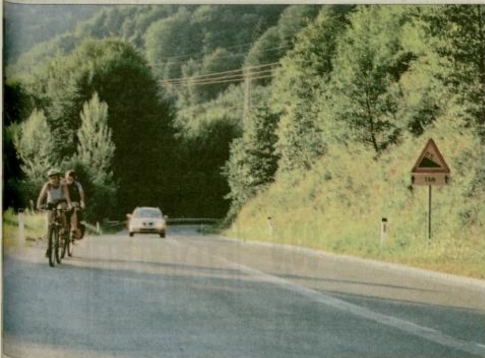
Kilometer za kilometrom, enkrat navzgor, drugič navzdol.

PROVAŠKA V ARCEL: PRINOSTEN, APP BILOKAPIC, 1/4, od 23.8. in 28.08., 71.400 SIT, 30.08., 83.600 SIT, VILA REMI, 1/4, slika, 105.900 SIT, BRILA, H. BOLINE, 23. in 30.08., 7 dni, 78.200 SIT, H. MARINA, 23. in 30.08., 7 dni, 89.900 SIT, DUGI OTOK, HOTELI BOŽAVA, od 23.08., 7 dni, od 88.880 SIT, RAD-POVLJANA, VILA LANA, 1/4, od 30.08., 7 dni, 83.900 SIT