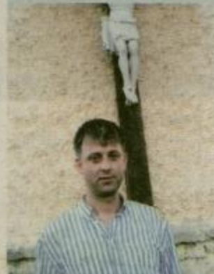
ŽUPNIK ZA ŠEST CERKVA Stran 8