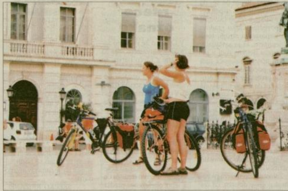
Tartinijev trg navdušuje tudi v poletni vročini.

In kar naenkrat smo prispele pod vrhniški klanec. S tretjo prestavo sem počasi premagovala meter za metrom in kilometer za kilometrom. Vedno znova prepričana, da sem že na vrhu, sem ugotovljala, da klanca ne bo nikoli konec. Nikjer nobene vode, naša pa je bila že topla. Če bi nas na vrhu pričakal potok, bi ga vsega izpile, če bi bila železniška postaja, bi ves dan čakala na vlak do Obale. Tako pa ni bilo ni-