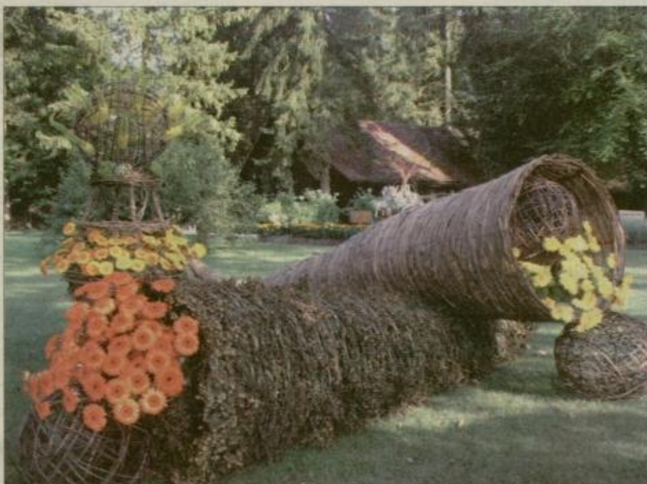
Rožice pa poganjajo in poganjajo