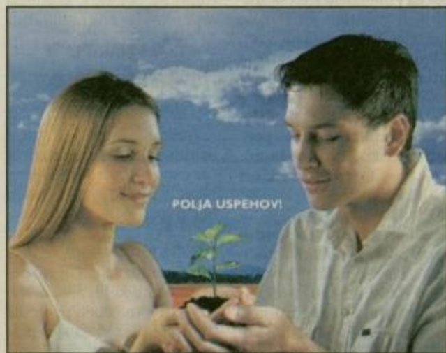
41. MEDNARODNI KMETIJSKO-ŽIVILSKI SEJEM