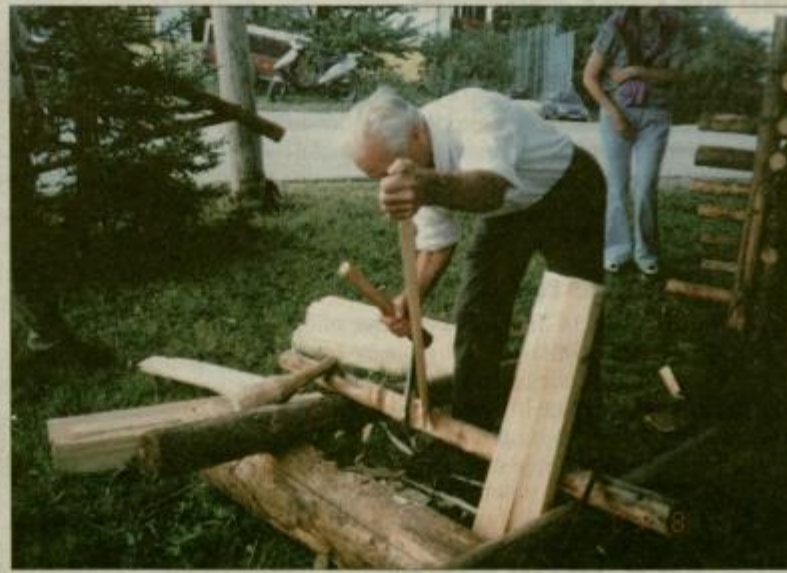
Škodlar Jesevnik izdeluje šikelne ali škodle, iz katerih po njegovem nastane najboljše streha, ki jo lahko uniči samo ogenj.