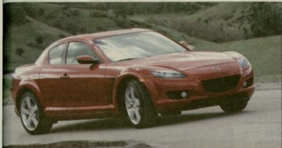
Razkošna tehnična posebnost - mazda RX8

Pred časom smo že pisali o novi seriji 6. Avto se bo na trgih pojavil konec tega oziroma v začetku prihodnjega leta. Konec leta 2005 bodo ponudili M6, avto pa naj bi vozil v zelje mercedesu SL 55 AMG, pa porscheju 911, aston martinu DB8 ipd. Motor naj bi bil v osnovi enak tistemu v M5, saj bo razvijal okroglih 500 KM, kar naj bi recimo zadoščevalo za pospešek do 100 km/h točno pet sekund.