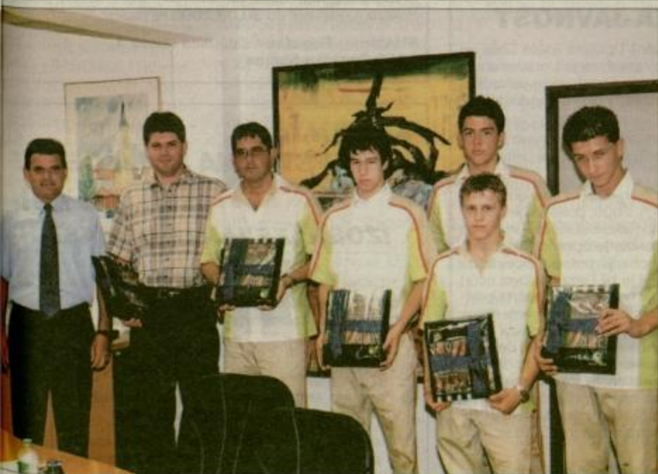
Župan Lojze Posedel in dobitniki medalj na Olimpiadi mladih v Parizu.