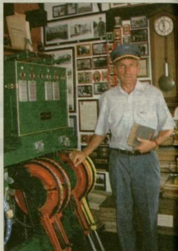
Srce vsake železniške postaje je signalno-varnostna bločna naprava, ki jo za območje Štajerske največ izdelali okoli leta 1900.