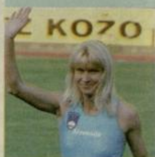
NOBENA PRED JOLANDO Stran 15