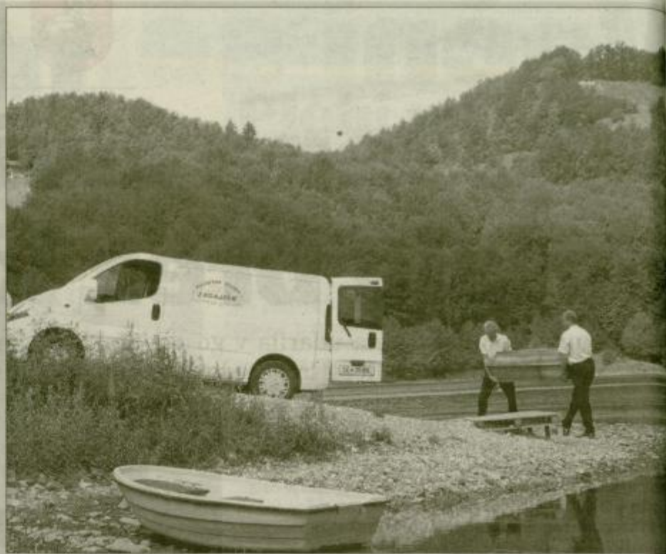
Kombi pogrebne službe je z Ramne plaže ob Slivniškem jezeru v torek odpeljal dvakrat.