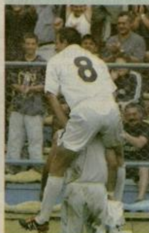
ORKAN ZA MAKEDONCE Stran 14