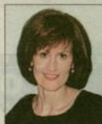
Piše: MAJDA KLANŠEK

Modelčke namažemo s surovim maslom in jih posujemo z moko. Moko presejemo v skledo in naredimo na sredi jamico. Vanjo nadrobimo kvas in ga zmešamo z mlekom in malo moka. Pokrijemo in damo za 15 minut na toplo, da kvasec vzhaja. Jajca penasto umešamo s sladkorjem, dodamo vaniljin sladkor in sol. Surovo maslo razpustimo, a ga ne segrejemo. Damo k rumenjaku in ga s kvascem in vso moko zamešamo v skoraj tekoče kvašeno testo. Stepemo ga. Testo naj pokrito vzhaja 30 minut. Modelčke za venčke do polovice napolnimo s testom, ki ga damo ponovno vzhajat. V pokritih modelčkih naj vzhaja 20 minut. Pečico razgrejemo na 210 stopinj Celzija. Tortice pečemo 30 minut na drugi višini od spodaj. Zvrnemo jih na rešetko in ohladimo. Vodo s sladkorjem, limonino lupinico, rumom in belim vinom