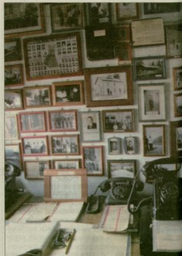
Ure in ure terenskega dela, zatem pa nešteto prečutih noči, da si obiskovalci v Muzeju južne železnice zdaj lahko ogledujejo zbrano gradivo.