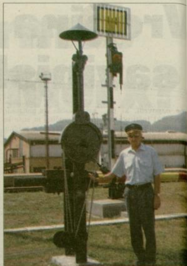
Na območju Železniške postaje Šentjur so na ogled tudi Franc Jožefov prometni urad, signalna postavljalna in žicevodilna naprava, likovni, glavni in predsignali - oprema s petrolejsko razsvetljavo, signalna postavljalna in žicevodilna...