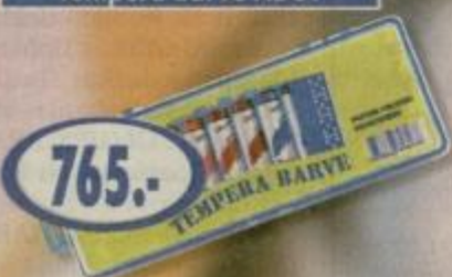
Tempera barve ADUT