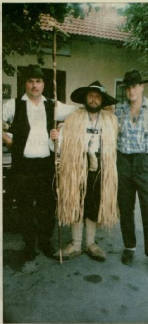
Pastirski sprejem v Šmihelu