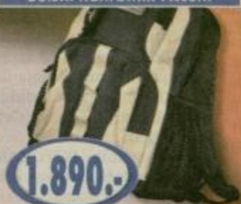
Šolski nahrbtnik Accent