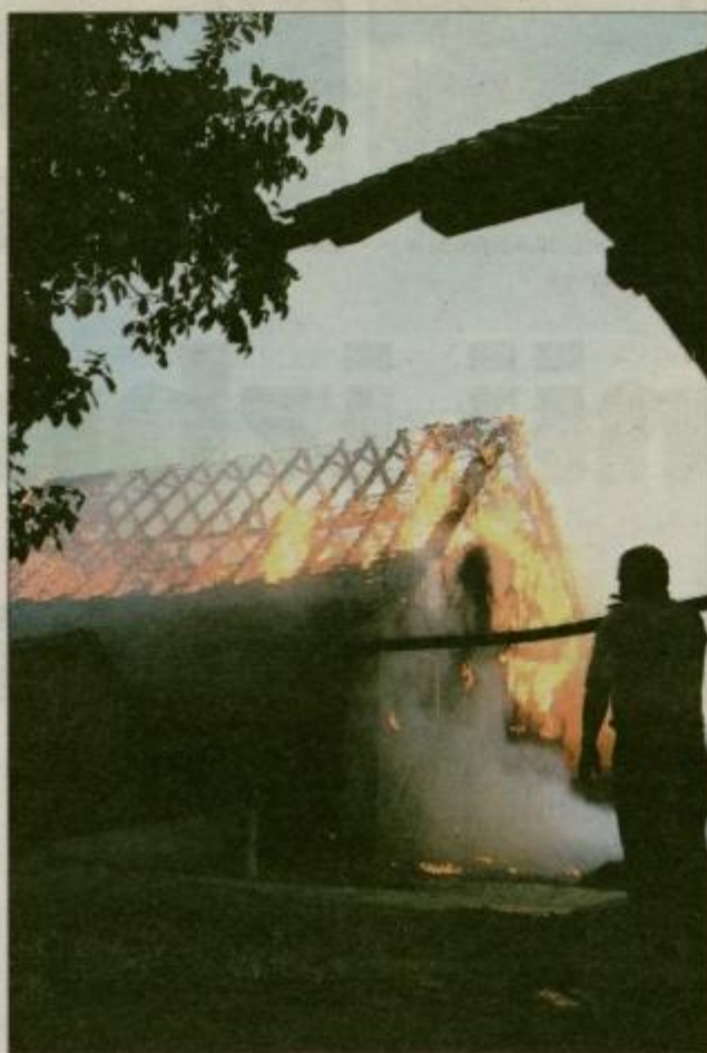
Strela, ki je udarila v vrh gospodarskega poslopja, je zanjela požar v suhi krmi. Celotno ostrešje je bilo v hipu ena sama goreča bakla.

Prav za Kačičnika je bilo četrtkovo popoldne še posebej hudo, saj je letošnje prvo neurje s točo in orkanskim vetrom, ki se je v Lazah pri Dramljah razbesnelo 13. maja, pri njih podrlo staro lipo