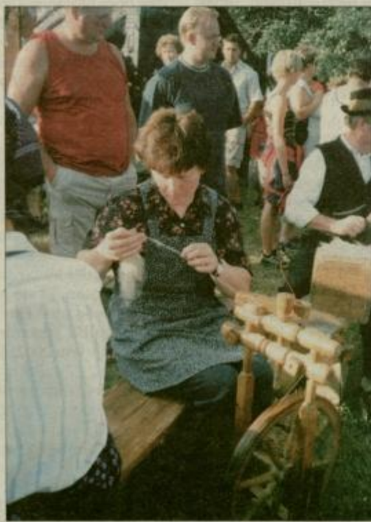
Vsako deklo ni moglo postati predica, saj vsem ni nikoli uspelo vleči nit in obenem poganjati še kolovrat.

Obiskovalce je najbolj nasmejalo pranje ovac. To opravilo je zlasti za pastirje večjih čred pomenilo pravi mali praznik. Kadar so bile ovce zelo umazane, največkrat od blata, pa jih je bilo potrebno tudi namiliti. Toda te neubogljive živali so pogosto poskrbele, da so se z njimi oprali tudi možje.