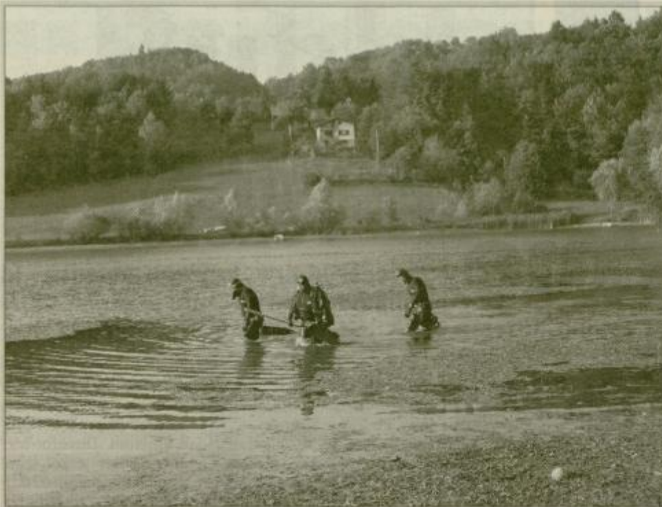
V ponedeljek so z iskanjem v vodi začeli trije potapljači celjske poklicne gasilske brigade, v torek se je ekipa reševalcev okrepila na 12 potapljačev iz Celja, Velenja in Maribora.