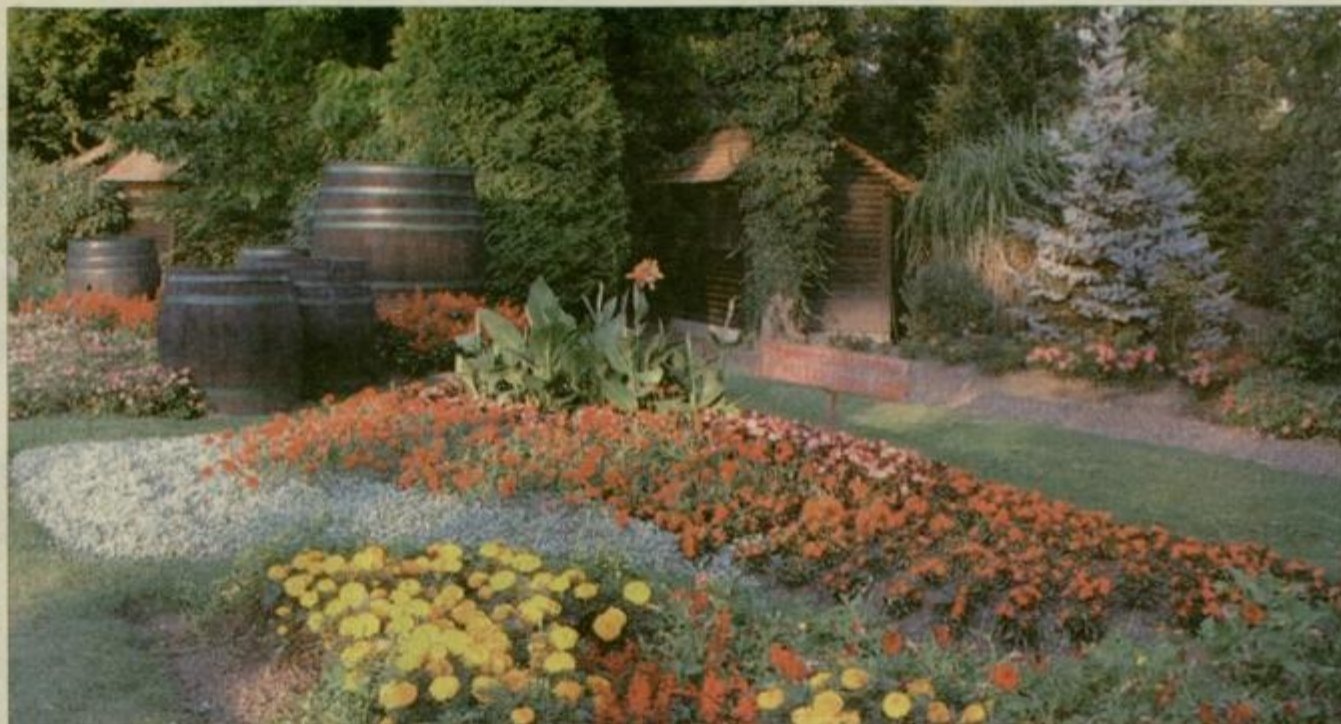
Skrbno urejene grede so prava paša za oči