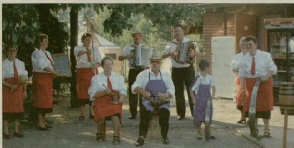
Konovski štrajharji na »cvetličnem« koncertu