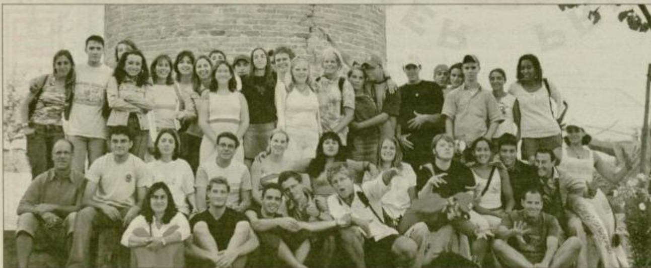
Zbrani udeleženci poletne mladinske izmenjave na Portugalskem.