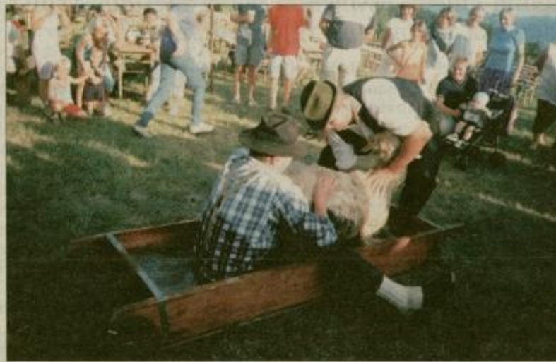
Obiskovalce je najbolj nasmejalo pranje ovac, saj so neubogljive živali pogosto oprale tudi možje.