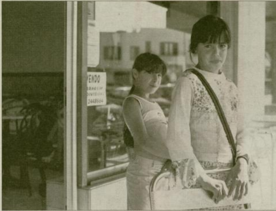
Otroci iz portugalskega Centra za socialno pomoč Ermesinde so prepuščeni ulici, Center je zadnja rešilna bilka, da jih voda ne odnese.