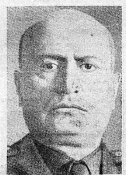
Benito Mussolini, Predsednik Kraljevske Italijanske vlade in Duce italijanskega naroda.

koli valuti in zadevnih odrezkov s katerega si bodi drugega ozemlja kakor z ozemlja Italijanske Države ali Kraljevine Albanije je dovoljen samo s poštno pošiljko, naslovljeno na eno izmed zgoraj navedenih Bank ali Kreditnih poslovalnic. Omenjene Banke in Poslovalnice, ki prejmejo po pošti od drugod kakor z ozemlja Italijanske