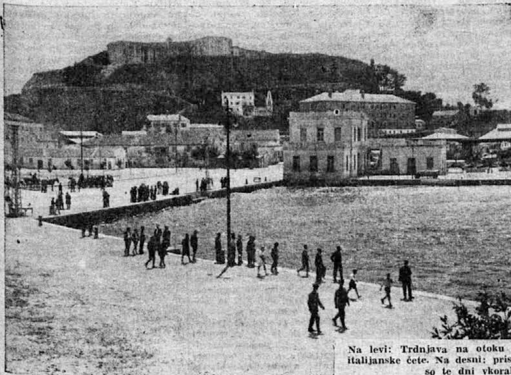
Na levi: Trdnjava na otoku Krfu, ki so ga te dni zavzele italijanske čete. Na desni: pristanišče Piraj pri Atenah, kamor so te dni vkorakale nemške čete.

Uporaba italijanske lire kot plačilnega sredstva na slovenskem ozemlju, zasedenem po italijanski vojski, se ne sme smatrati kot ukrep za konvertiranje ali zamenjavo med obema valutama, temveč le kot obveznost za pravne osebe in zasebnike, da morajo sprejemati italijansko liro kot plačilo