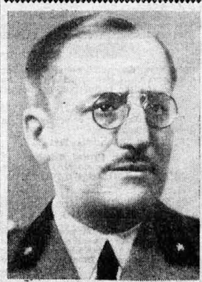
General Ugo Cavallero, vrhovni poveljnik italijanskih oboroženih sil na grškem bojišču.

Prav tako je prepovedano uvažati italijanske lire iz tujih držav in iz