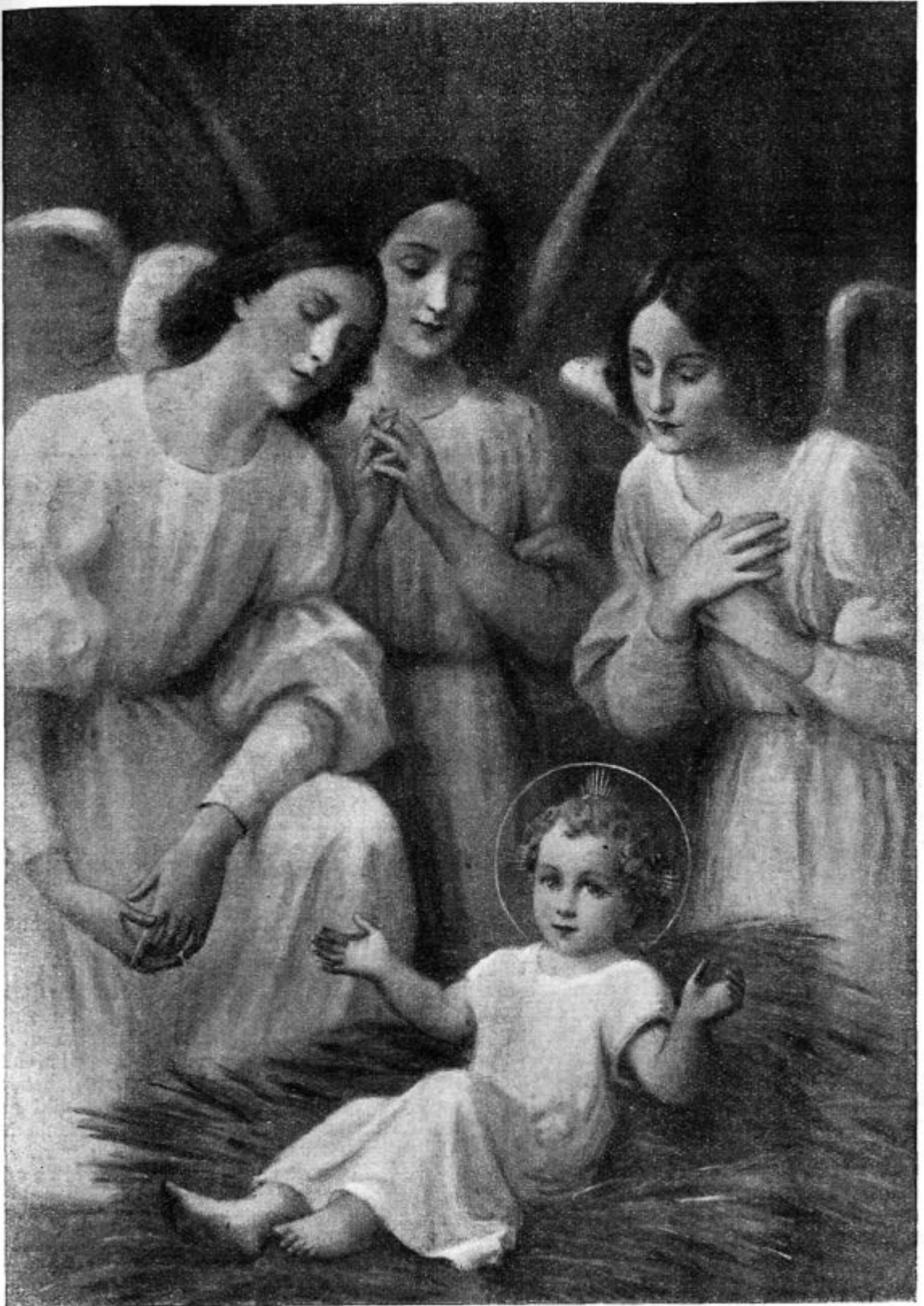
Jezus, veselje angelov.