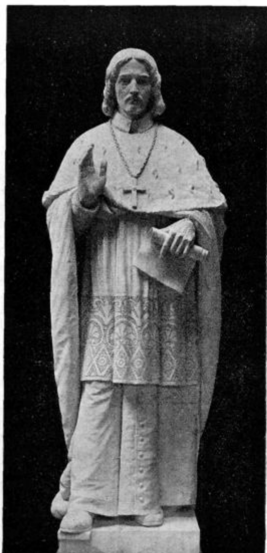
Sigmund Lamberg, prvi ljubljanski škof.