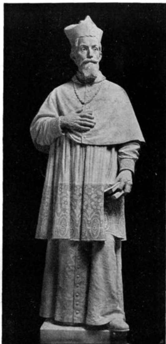
Tomaž Hren, najslavnejši ljubljanski škof.