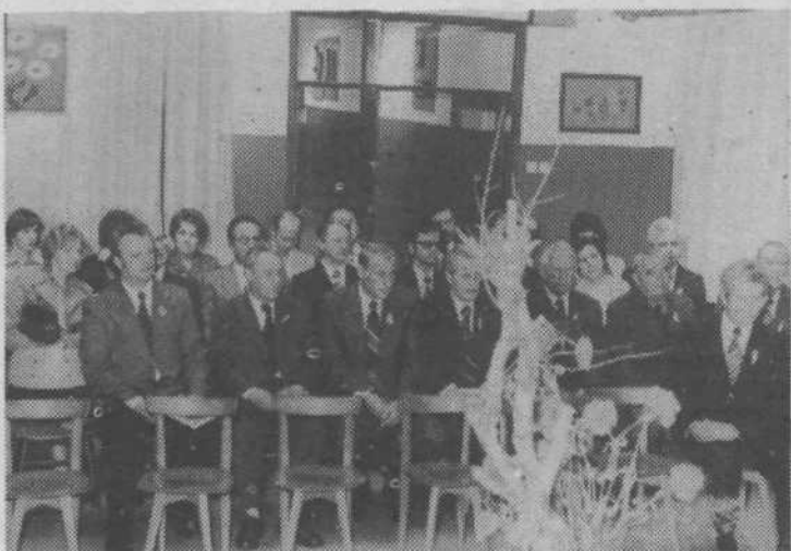
Slavnostna seja sveta KS Zelena jama, na kateri so proglasili 20. maj za krajevni praznik

Proslava se je pričela s slavnostno sejo, na kateri so 20. maja svečano proglasili za krajevni praznik. Pred spomenikom pad-