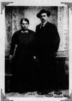
KALENDAR LIETO 1999 ANNO