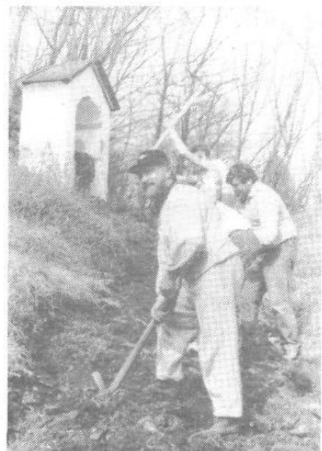
Člani polhogradskega turističnega društva širijo pot na Kalvarijo

razmjeitev vidna le na hišnih številkah, kajti vse delo v kraju morajo že od nekdanj opraviti sami.