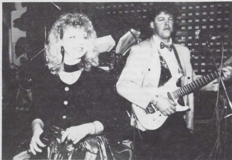
Za zmeraj polno plesišče je poskrbel ansambel CLASSIC

In menda se nikoli ni bilo tako bogatega srečolova kot na Slovenskem plesu '95, zahvaljujoč slovenskim in madžarskim podjetjem: Tovarni kos iz Monoštra, tovarni Mura, Blagovnici Potrošnik, podjetju Petrol, Pomurskim mlekarnam, Pomurski banki, tiskarni Solidarnost, Zavarovalnici Triglav, Pomurski založbi iz Murske Sobote, Elektromateriale in Iliriji Vedrog iz Lendave, Radenski iz Radencev, Radgonskim goricam iz Gornje Radgone, Mleko-prometu in obratu Mure ter obratu Krke iz Ljutomera in Tekstilu "Pletilstvo" iz Prosenjakovcev.