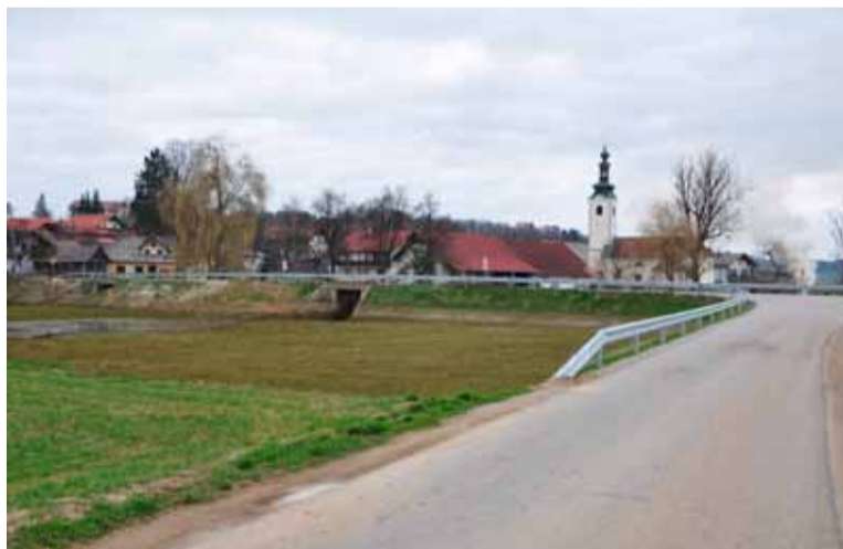
V Dobu je postavljena varnostna ograja ob glavni cesti v dolžini 250 m.