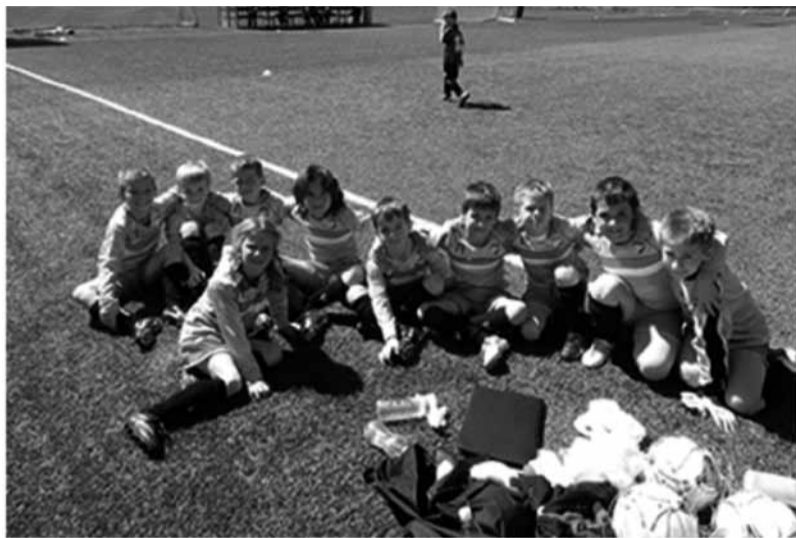
Naši mladi asi - prijatelji iz U-7

Selekcija U-10 je tudi začela s pomladanskim ligaškim tekmovanjem. V prvi tekmi, 13. 4. so v gosteh pri ekipi Bravo C tesno izgubili z 1:2. A puške v