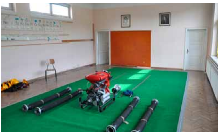
Sklenjen je dogovor, da se začne nekdanja podružnična šola v Hrastovem Dolu urediti v »družbeni center« za področje KS Dob, v katerem bo večnamenska dvorana in prostori za posamezna krajevna društva.