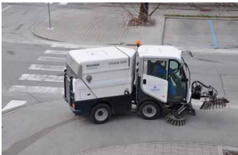
Občina je naročila pometanje cest in pločnikov v krajevnih središčih.