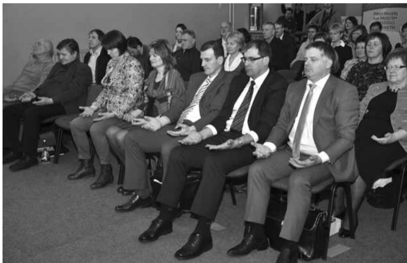
Vaje za sprostitvev