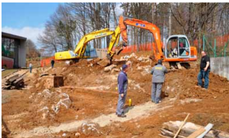
Petrol je začel graditi kotlovnica za daljinsko ogrevanje na lesno biomaso pri šolskem centru.