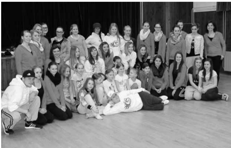
V aprilu so nas obiskale članice plesne skupine iz Hirschaida

Ne nazadnje moramo omeniti tudi to, da je v tem mesecu na pobudo pobratenih občin Ivančna Gorica in Hirschaid steklo tudi sodelovanje plesnih skupin. Na več dnevni obisk naše Dolenjske so prišle plesalke iz Hirschaida in se poleg ogledov naravne in kulturne dediščine Dolenjske in Slovenije pridružile tudi nam. Pod taktirko našega gostujočega učitelja