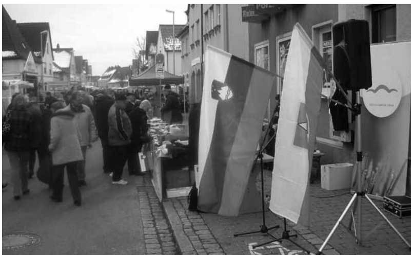
Ivanška stojnica na sejmu v Hirschaidu