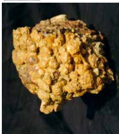
Limonit včasih neverjetno spominja na limone. Vendar je večinoma črno rjav ali rdečerjav.