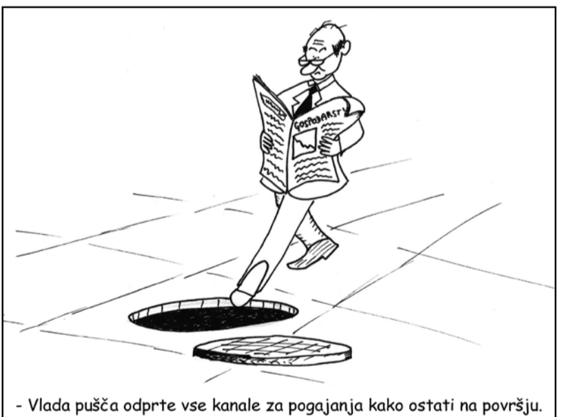
- Vlada pušča odprte vse kanale za pogajanja kako ostati na površju.

O, še bodo pomladi, bo rožic poln gaj in ptički bodo peli; le kdo bo užival maj?