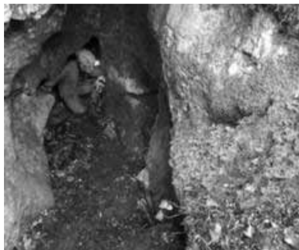
Levo slikana notranjost jame pred in desno jama po izvedeni očiščevalni akciji.