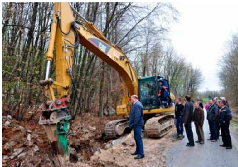
Začela se je gradnja vodovoda Kuželjevec – Korinj