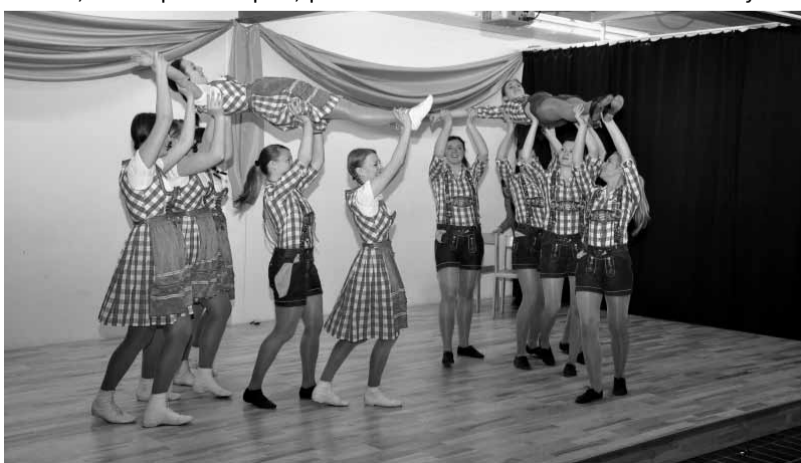
Nastop v Srednji šoli Josipa Jurčiča