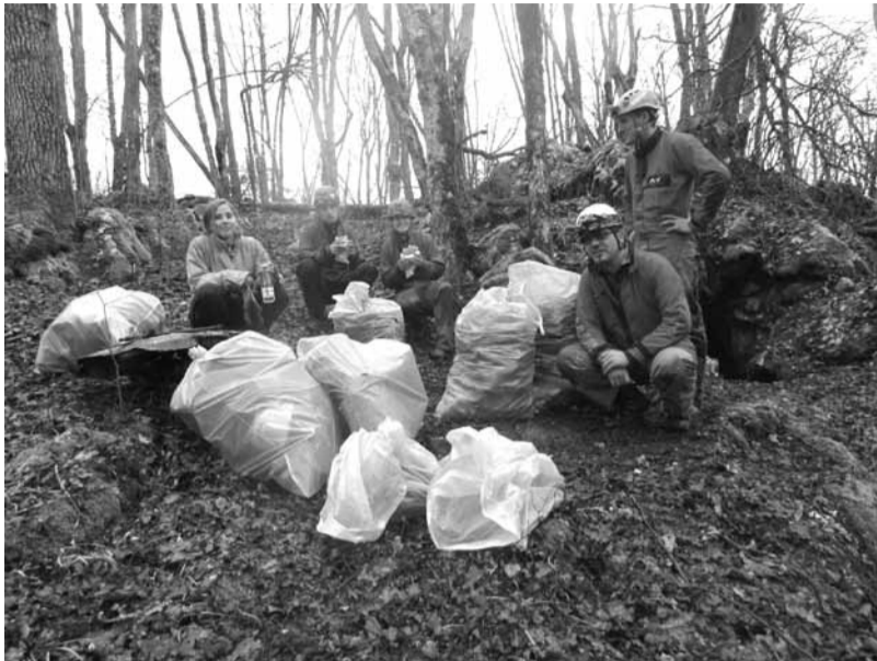
Večji del zbranih in razvrščenih odpadkov tik pred jamo.

mokolnico in jih prepeljali do ceste, kjer je čakala avtomobilska prikolica. Dobro natovorjeno prikolico smo zapeljali nedaleč stran do zbirnega mesta, saj je ravno v soboto, 20. 4. potekala tudi čistilna akcija v Krajevni skupnosti Šentvid. Sobotno popoldne smo nato izkoristili še za barvanje ograje z zaščitnim premazom, ki vodi proti Jami Poltarici in uredili dostop. Pred jamo smo pospravili še manjše vejevje, ki je omagalo pod težo letošnjega snega. Na steni nad vhodom v jamo Poltarico namreč redno izvajamo praktični del naše jamarske šole in nam služi tudi v druge izobraževalne namene. Čeprav je bila naslednji dan nedelja, se je skupina jamarjev v okviru čistilne akcije, ki jo je na ta dan organiziralo Turistično društvo Krka, lotila še vsakoletnega pregleda in čiščenja