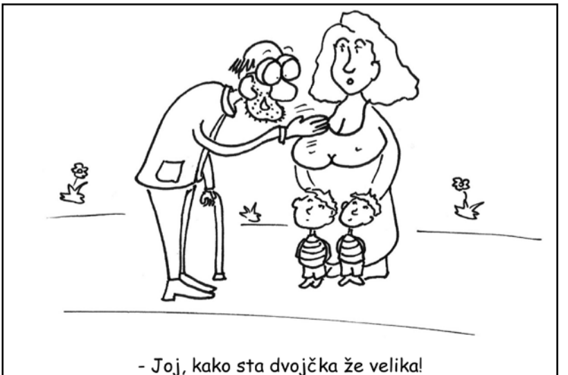
- Joj, kako sta dvojčka že velika!