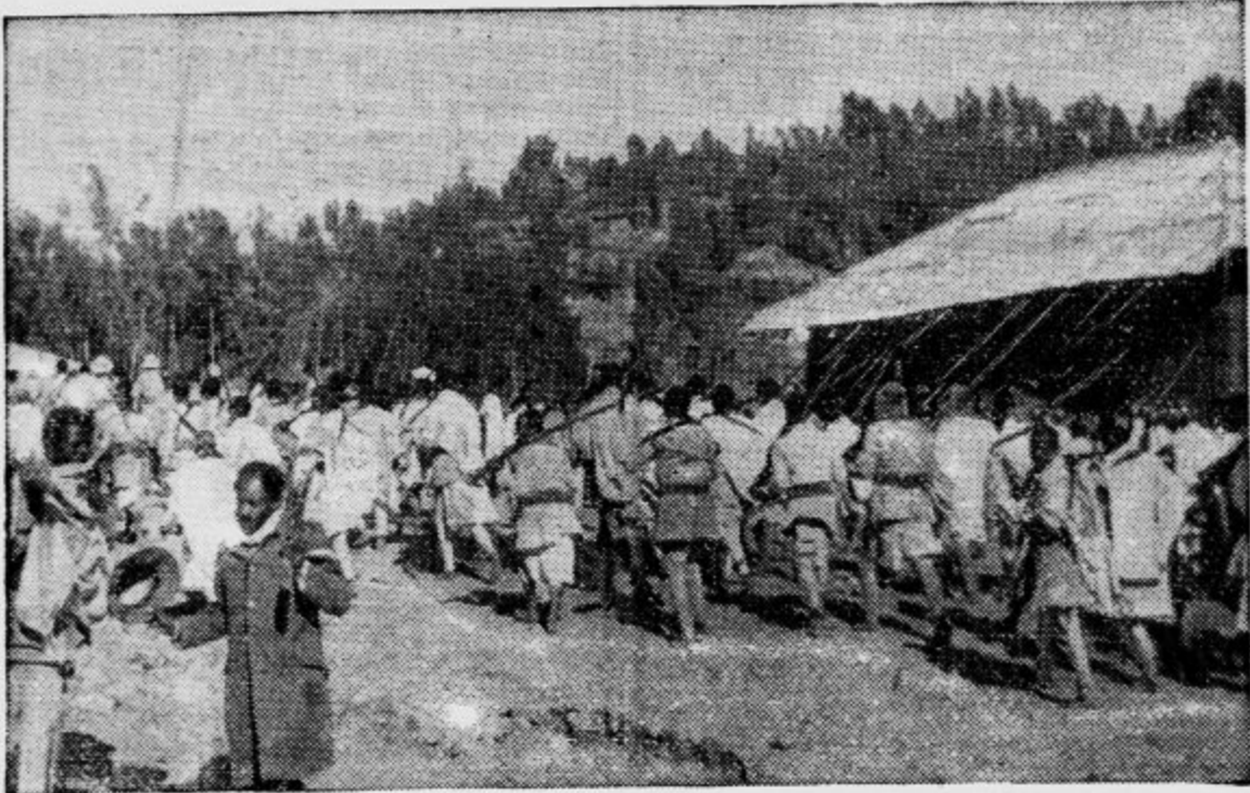
Abesinska vojska se pred Italijani umika v nove postojanke na jugozapadni strani Addis Abebe