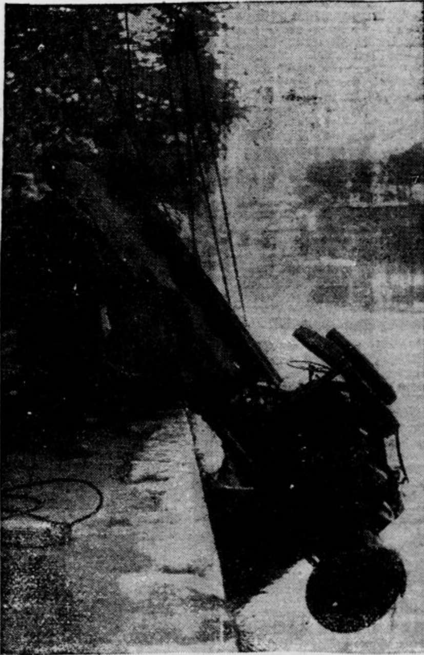
V Gournayu-sur-Marne se je primerila nenavadna nesreča. Neki avto je v polnem diru preskočil rob ceste in treščil v reko. Vozač je utonil, vozilo pa so pozneje s vrvmi potegnili na suho