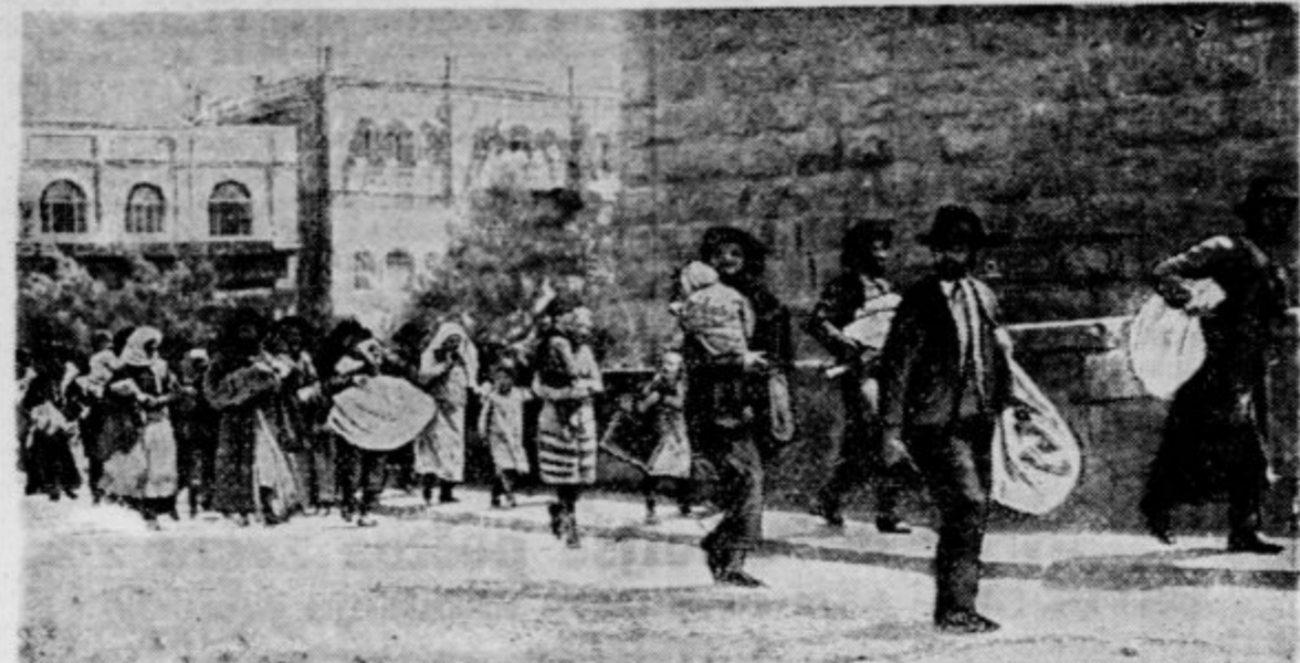
V Palestini je nanovo vzplamtelo staro sovraštvo med Arabci in Židi. Prvi zahtevajo od vlade prepoved židovskega prekopčevanja s palestinsko zemljo in prepoved židovskega priseljavanja v deželo. — Na sliki: Beg Židov pred arabskim življem