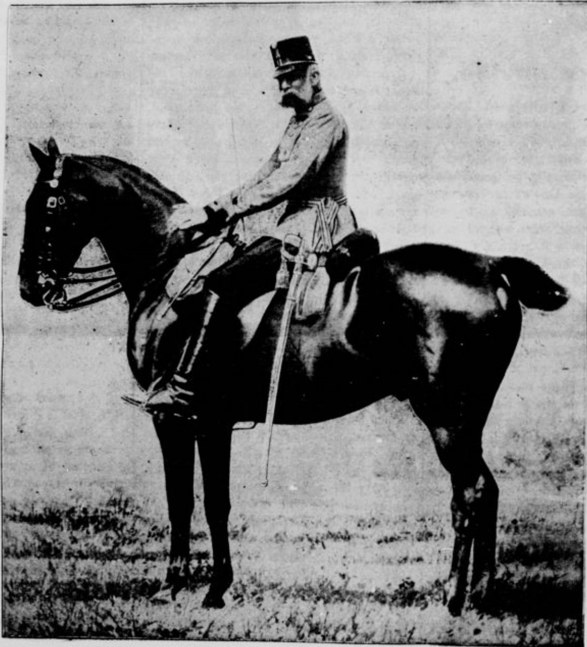
Cesar Franc Jožef I., k petinsedemdesetletnici njegovega rojstva.

življenje. Vso skrb so posvetili mladeniški Marijini družbi, ravno tako izobraževalnemu društvu; koliko so se trudili za hranilnico in posojilnico, sami predobro vede. Oskrbeli so nam zares krasno zastavo, vpeljali češčenje sv. Rešnjega Telesa za fante in može. Zasnivali so nam precej bogate knjižnico, in so tudi sami nekaj prav lepih knjig v darovali. Bog naj jim bo za vse to plačnik, in za ves trud, ki so ga z nami imeli. — Za