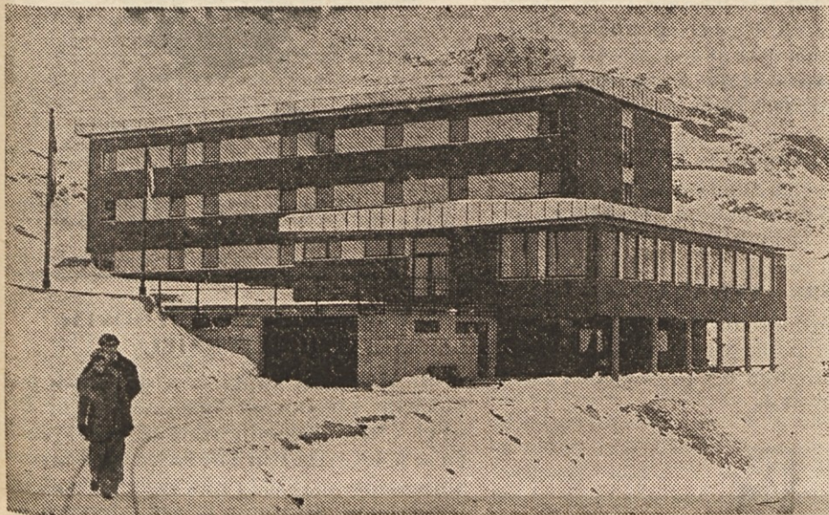
Nov planinski dom na Reißecku je resnično pravi biser koroškega turizma

V pičlih dveh urah, vključno romantične vožnje skozi rov, se pelješ prav do planin-