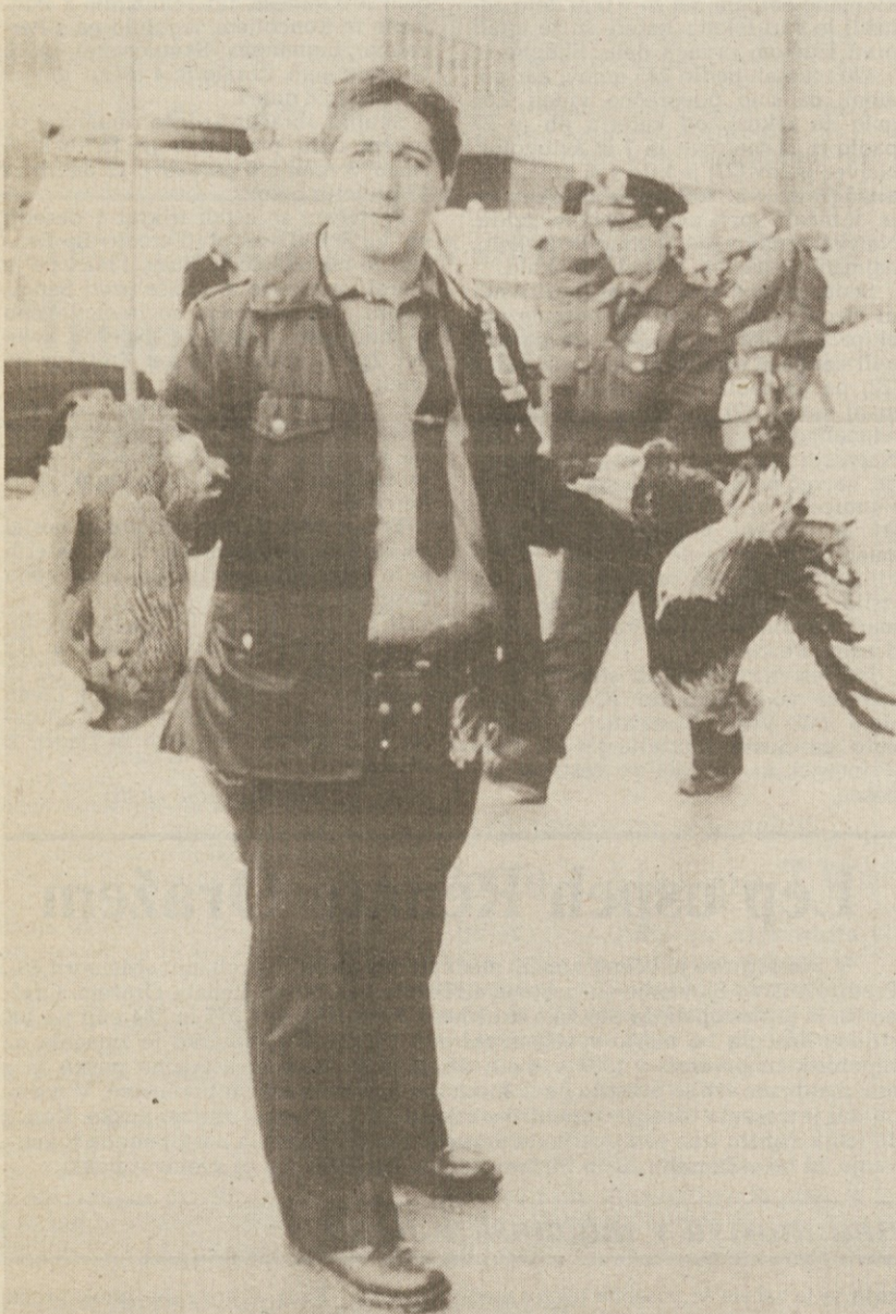
Newyorški policist je očitno presenečen nad svojim petelinjim plenom, ki ga je našel kar pred vhodom policijskega urada