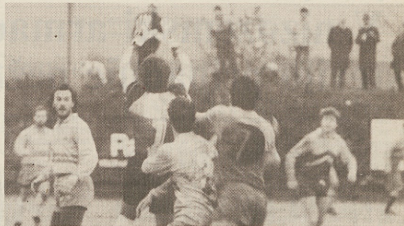
S prvenstvene tekme Primorje - Latisana

Nogometni prvenstvi 1. in 2. AL sta na pol poti. V nedeljo, 10. t. m., so namreč igrali tekme zadnjega kola zimskega dela in zato vam posredujejo nekaj statističnih podatkov o teh prvenstvih, kjer nastopajo naše enajsterice.