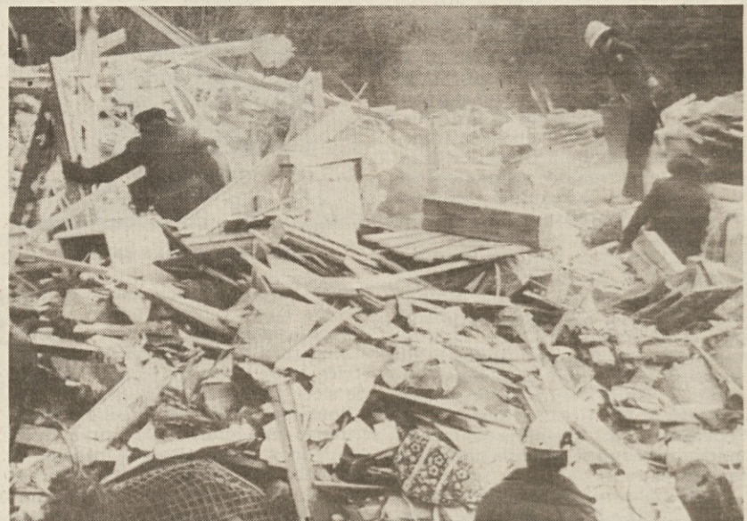
Okvara na plinski pečici je povzročila v zahodnem Berlinu močno eksplozijo, v kateri je ena ženska izgubila življenje, drugo osebo pa pogrešajo