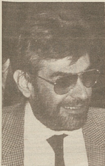
Predsednik vlade Gorio in minister za delo Formica

Socialistični minister se iz protesta ni udeležil vladne seje - Danes bo vodstvo PSI analiziralo položaj in sprejelo protiukrepe