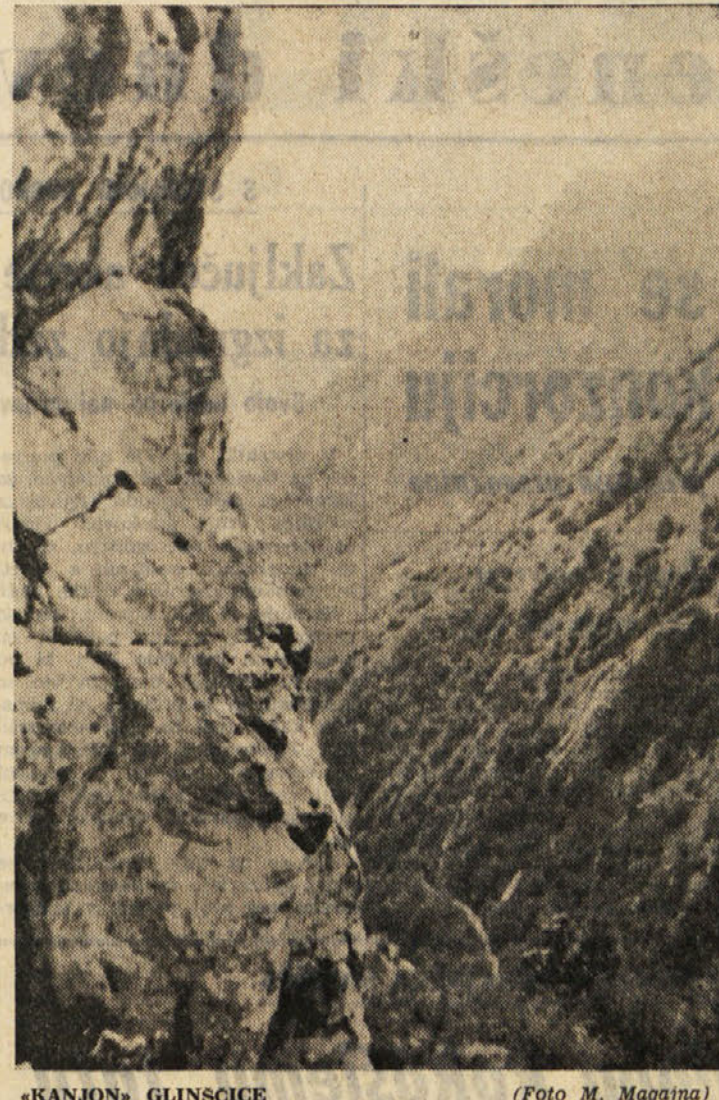
«KANJON» GLINICE

«Zelo očitno je, zakaj se državni sekretar jezi. To nima nobene zveze z lahkovernostjo vseučilišnih ljudi. On se jezi zaradi tega, ker so dejstva in nadaljnja razglabljanja, prikazana s strani kritikov, v nasprotju z uradnimi izjavami. Niso vseučilišni profesorji, pač pa so šefi državne pravne tisti, ki so pokazali trmasto omalovaževanje dejstev.