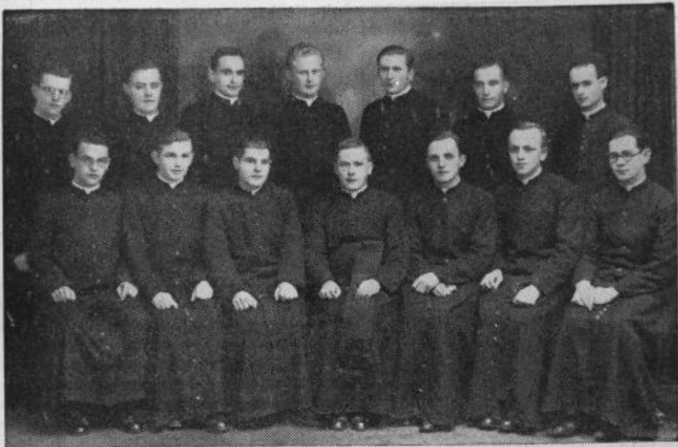
Novomašniki ljubljanske škofije.