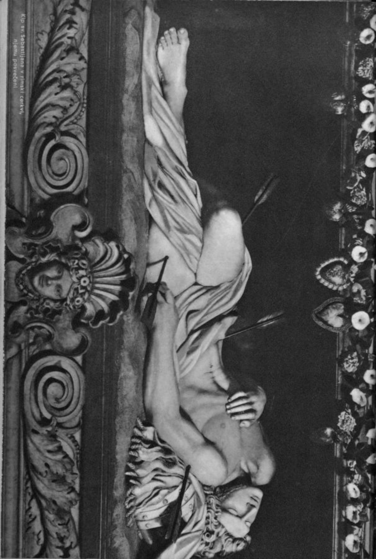
Kip sv. Sebastijana v Rimski cerkvi, njemu posvečeni