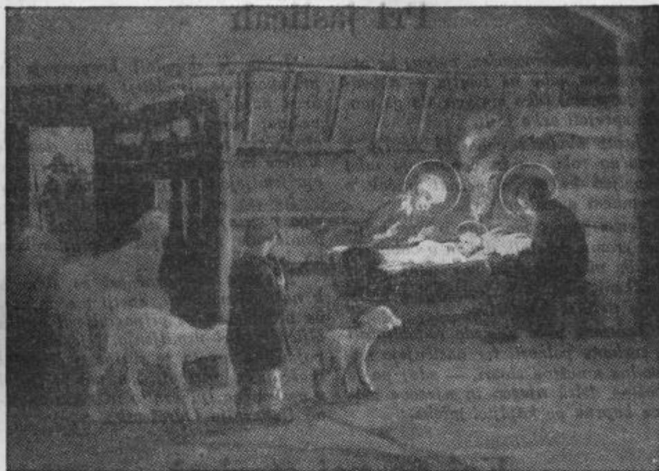
Pastirji prihajajo k jaslicam.

Kaj sledi iz te dvojne resnice? To, da bomo o božičnih praznikih res prav iz srca peli: »Bodi češčeno, o Dete preblago, samo ljubezen do nas Te rodi.« Pa tudi ono preprosto: »Le k Njemu hitimo, saj rad nas ima; zaupno odkrijmo mu rane srca.«