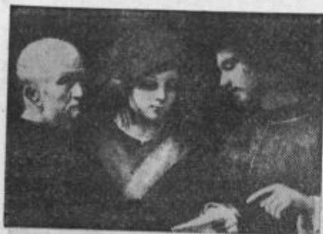
Za novo leto: Tri človeške dobe. (Firenze: Gall. Pitti.)

narodove moči. Veliko je narodov in držav na svetu, kjer je kmečki stan najštevilnejši. Za nas Slovence to še vedno velja, čeprav naš narod prehaja iz nekdanjega čisto kmečkega značaja v mešanico kmečkega in delavskega stanu. Še vedno je za našo bodočnost silno važno, kakšen bo naš kmečki rod. Ako gledamo na to vprašanje s stališča Katoliške akcije, nam je najbolj pri srcu verska in nravna vzgoja našega kmečkega stanu.