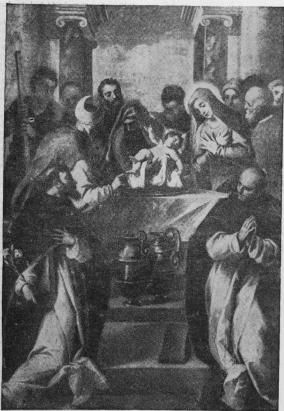
Obrezovanje Gospodovo. (Novo leto.) (Trogir: Cerkev sv. Dominika.)