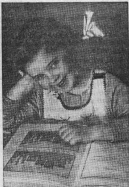
So. Miklavž mi je prinesel.

Sicer vedno pravimo, da hočemo ostati dobri kristjani, dobri katoličani, a to svojo voljo moramo uresničiti v najnavadnejših življenjskih okoliščinah vsakega stanu. Ako nameravamo po verskih in nraavnih načelih vzgojiti novega kmečkega fanta, hočemo takega fanta, ki bo vero imel za najvišji vzor življenja in bo verske dolžnosti spolnjeval iz notranjega prepričanja; sam naj se z odločno voljo postavi brezbožnemu svetu v bran in tudi druge naj k temu spodbuja. Le mladega fanta bo mogoče navdušiti za lepoto krščanskega življenja in mu dati moč, da bo stalno živel v milosti božji. To ga bo varovalo pred materializmom, ki je ravno za kmečki