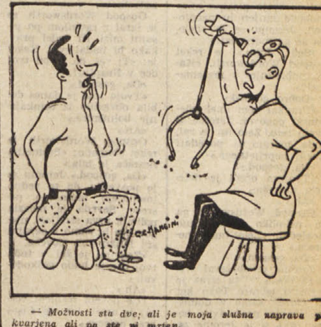
Možnosti sta dve; ali je moja slušna naprava pokvarjena ali pa ste ni mrseva.

OVEN (od 21. 3. do 20. 4.) Čakajo vas ovire, ki pa jih boste premostili. Pazite predvsem na zdravje in si privoščite počitek. BIK (od 21. 4. do 20. 5.) Bodite previdni. Oseba, ki ste ji vedno zaupali, vas v resnici vara. DVOJČKA (od 21. 5. do 22. 6.) Majhen preprič in ljubljeno osebo. Sprejmite vabilo za obisk. RAK (od 23. 6. do 22. 7.) Ne bodite preveč zahtevni. Skromnost je lepa čednost, ne pozabite tega. LEV (od 23. 7. do 22. 8.) Srečni boste zelo simpatično osebo. Izkoristite novo poznanstvo za prijeten izlet. DEVICA (od 23. 8. do 22. 9.) Poslušajte prijatelje, ki vam govorijo dobro. Ne bodite trmast in pazite na zdravje. TEHTNICA (od 23. 9. do 23. 10.) Nič kaj ugoden dan za reševanje srčnih zadev. Ne pragnite se. SKORPION (od 24. 10. do 22. 11.) Odložite svoje načrte za kasneje, sedaj ni ugoden trenutek. STRELEC (od 23. 11. do 20. 12.) Pokažite več razumevanja z vašimi sodelavci. Prijetno potovanje. KOZOROG (od 21. 12. do 20. 1.) Vaše ambicije bodo natele na ovirah in morali boste spreminiti svoj načrt. VODNAR (od 21. 1. do 19. 2.) Srečen dan in nove možnosti za izboljšanje položaja v službi. RIBE (od 20. 2. do 20. 3.) Čaka vas prijetno presenečenje. Obiskal vas bo nekdo, ki ste ga že dolgo želeli videti.