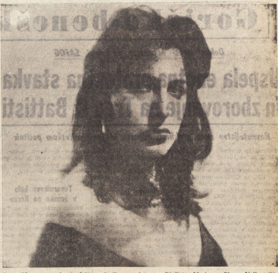
Anna Magnani se bo še letos pojavila na platnu z Giulietto Masino v filmu «Nella città inferno», ki ga režira Renato Castellani

vsako zblizevanje, Ameriški komentator Walter Lippman je v zvezi s tem napisal: «Predsednik Eisenhower je narlel, pri svojem poskusu zboljšanja odnosov s državami Latinske Amerike, na močno opozicijo med svojimi najbližjimi sodelavci.»