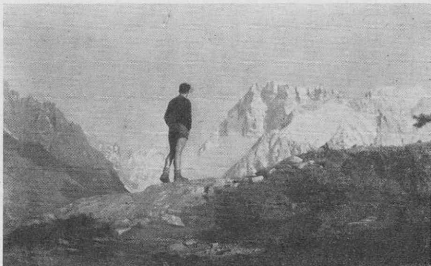
Grandes Jorasses v večernem soncu