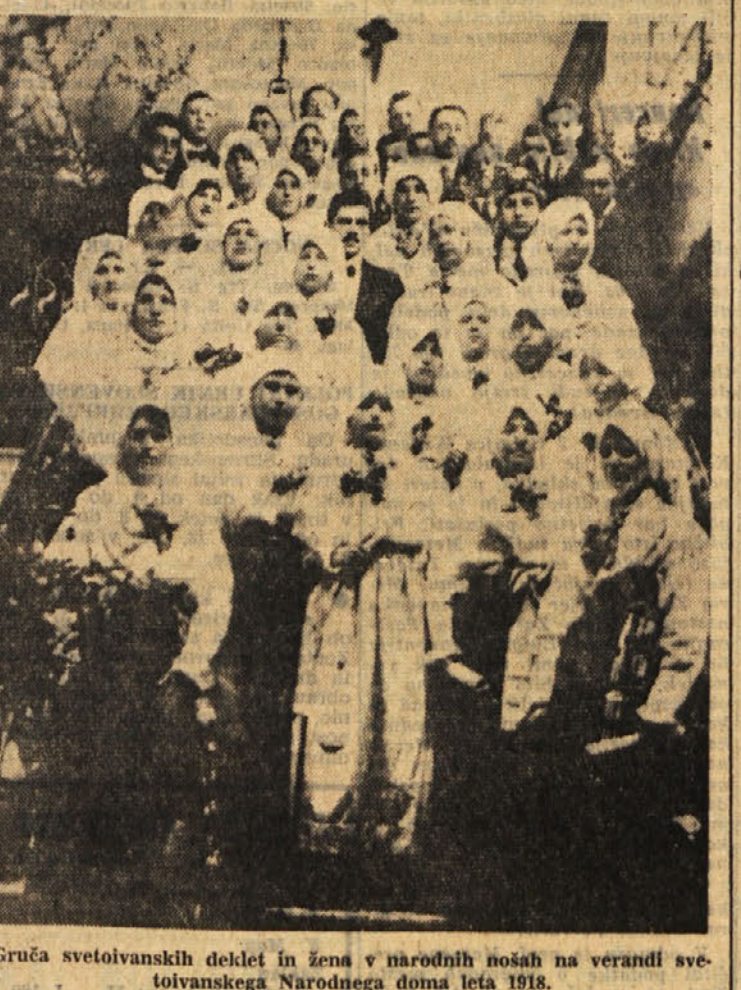
Gruča svetovivanskih delcih in žena v narodnih nošah na verandi svetovivanskega Narodnega doma leta 1918.

čie trave, bele gorečke tvorijo tak šopek, ki se pripne na nedrja z zlato brosko sformo». Tudi zlato nujno spada k no-ši. Nobena žena ni šla v noši brez zlata v procesijo. Poleg broške in gumbov-dvojkov ob vr-tu morajo od ušes bližjati zlati ubani z obeskom euarengli-ne s kuaškame. Ne smejo manj-čati zlati prstani. Zlate vezice so prišle v modo poznje.