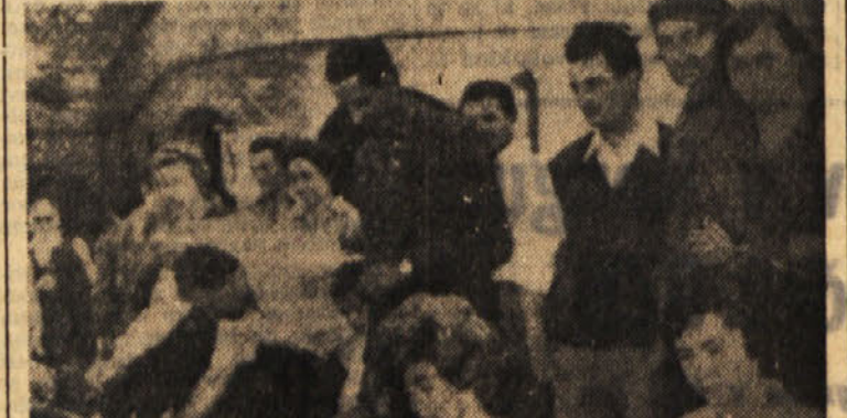
V Pecettu pri Turinu prodajajo kar na trgu in po ulicah češnje po 150 lir kg, medtem ko so v trgovinah enake dvakrat tako drage