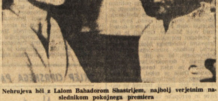
Nehrujeva hči z Lalom Bahadorom Shastrijem, najboljšim verjetnim naslednikom pokojnega premiera

Agencija Nova Kitajska pa je sporočila, da je Sufanuvong brzojavno protestiral pri Suvani Fumi proti odstranitvi njegove stranke iz vlade koalicijske ter poudaril, da so bili s tem kršeni veljavni sporazumi, zlasti pa načelo soglasnosti treh političnih skupin. Poleg tega je zahteval, naj soproedsednika ženavejske konference o Laosu zaščitita evakvacije oseba Neo Lao Haksta iz Vientiana v Kang Kaj ali pa v Saneua. Iz Washingtona pa sporočajo, da je predstavniki vlade danes izjavili, da koalicijska vlada v Laosu za ZDA še vedno obstaja ter da Sufanuvongova zahteva o umiku čet Patet Laa iz Vientiana ne predstavlja prekinitve koalicijske. Kot je bilo napovedano, se začne jutri v Vientianu posvetovanja veleposlanikov ZDA, Anglije, Južnega Vietnama, Tajlandije in Kanade. Ne izključuje se možnost, da bodo upoštevali poljski predlog za sestanke v Zenevi, ki bi bil omejen na oba soproedsednika konference, to je Anglijo in ZSSR, na člane mednarodne nadzorstvene komisije, ki so Indija, Kanada in Poljska ter tri laoska gibanja. V zadnjih dneh ni bilo v Laosu posebnih vojaških spopadov. Iz Pekinga pa so sporočili, da kitajska vlada nasprotuje konferenci veleposlanikov.