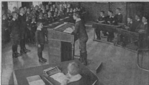
Šolski sodni dvor.