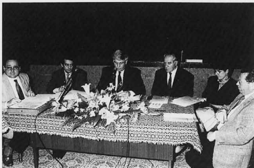
Predsedstvo občnega zbora sovodenske hranilnice

ši načrti so se uresničili, saj smo januarja letos odprli podružnico v Štandrežu, ki je takoj začela zadovoljivo poslovati.«