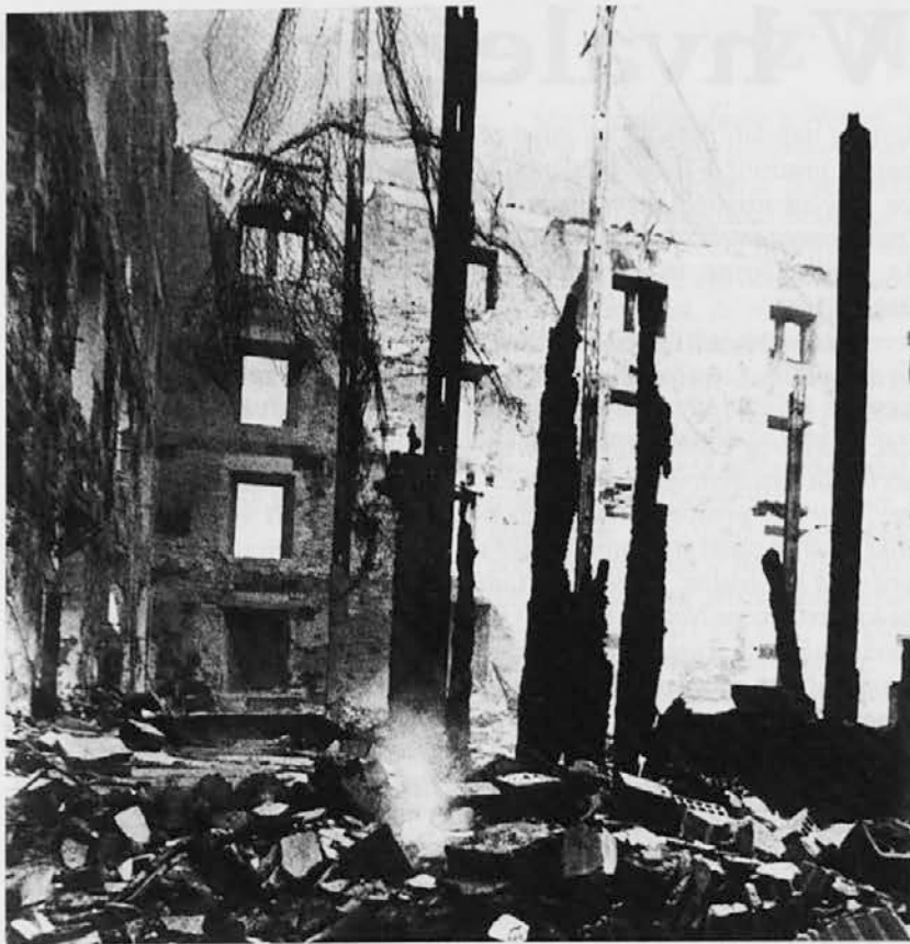
Rižarna v Trstu po odhodu Nemcev, ki so jo uničili, da bi za seboj izbrisali sledove okrutnih dejanj

Mutatis mutandis, v Italiji lahko govorimo o prisotnosti nekaj deset tisoč Judov v največjih mestih, o odnosno manjšem obsegu deportirancev, a o enako visokem odstotku žrtev. V Rimu je od 12.799 Judov bilo odpeljanih v taborišča 1.727, od teh je osta-