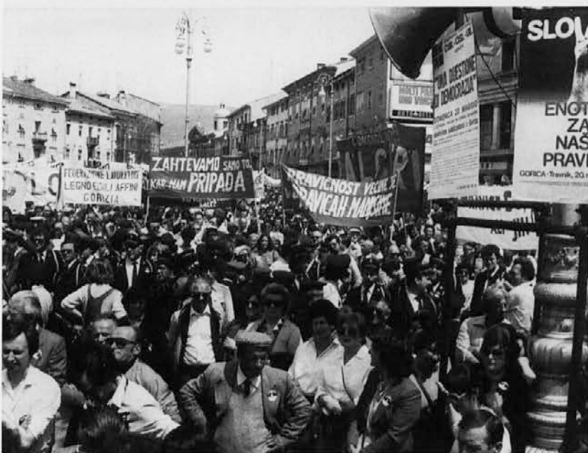
Na Goriškem Travniku pred desetimi leti

Od takrat do danes se je marsikaj spremenilo. Zrušil se je berlinski zid, naša matična Slovenija je postala samostojna in mednarodno priznana država. Mi pa smo ostali taki, kot nekoč, saj za reševanje vprašanj naše narodnostne skupnosti še vedno ne znamo najti skupne poti, čeprav vsi radi govorimo o enotnosti, ki je nujno potrebna za našo ohranitev in našo rast. Ne smemo si torej dovoliti, da bi le pasivno čakali na novo obletnico Travnika.