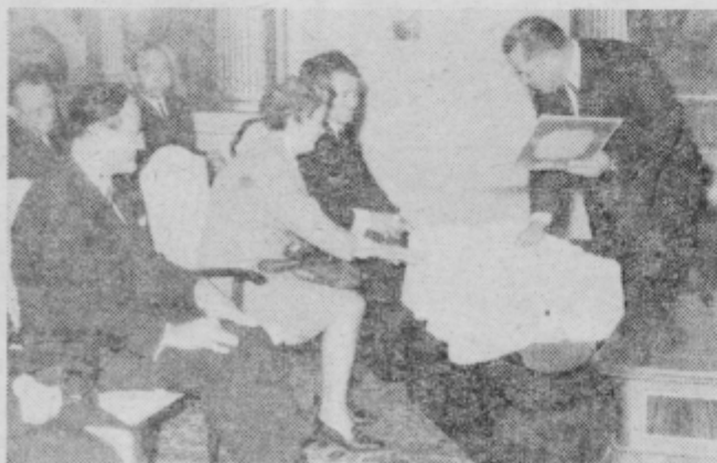
V obratu za proizvodnjo zaščitnih rokovnic