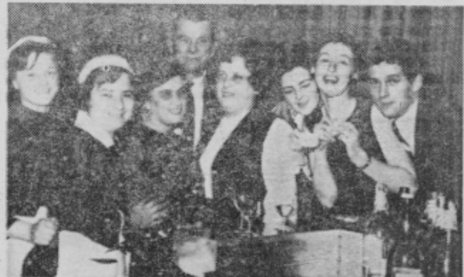
Vesela družba v ptujskem hotelu

kar spuščal zapornice. Kmalu zatem je mimo zdrvel pot-