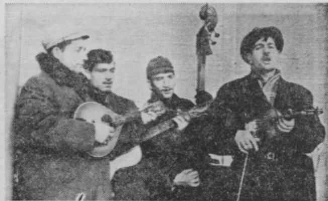
Vsako leto igrajo za novo leto v ptujski in ormoški občini

sedo specialitete in druge dobre jedi. Bilo je veselo in prav gotovo so doživeli eno tistih noči, ki ostane dolgo v spominu.