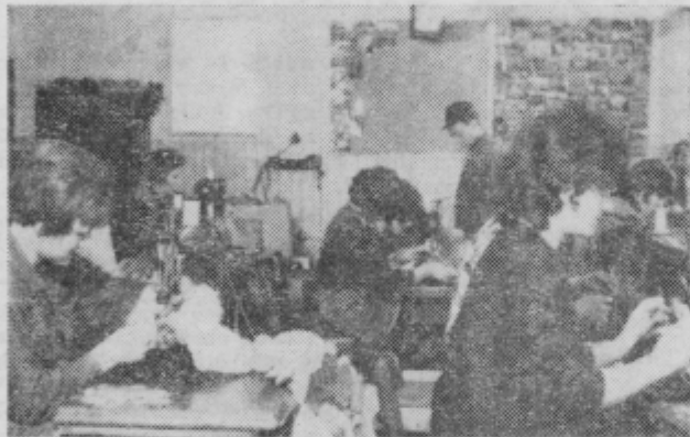
V obratu za proizvodnjo zaščitnih rokavic

V bodoče bodo preusmerjali proizvodnjo predvsem v izdelovanje rokavic. V tem letu nameravajo modernizirati proizvodnjo. Zamenjali bodo strojni park. Z ustreznimi tečajji bodo poskrbeli tudi za kvalifikacijo delovne sile.