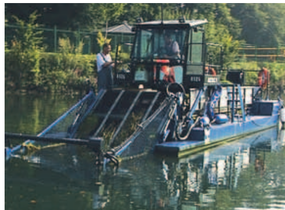
Zbiljsko jezero so prvič kosili v začetku avgusta.

Kljub lepšemu pogledu na jezeru pa z obiskom v čolnarni v TD Zbilje niso najbolj zadovoljni, sploh v juliju, ko je bilo slabše vreme, so precej manj obiskovalcev našli tako v čolnarni kot tudi na otroškem igrišču. Boljši je bil avgust, pa tudi začetek septembra. ”Za veslanje je v lepih septembrskih dneh kar precej za-