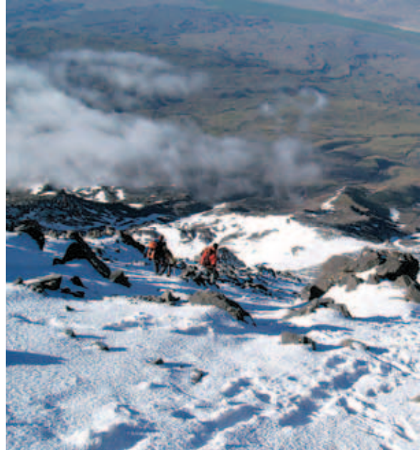
Pot z Ararata