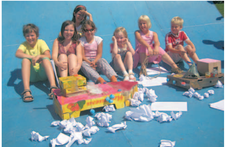
Poletne ustvarjalnice so med otroki vse bolj priljubljene.