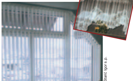
Starič Igor s.p.

SNEBERSKA 20E, LJUBLJANA - POLJE tel., fax: 01/5282-145, PE Zgornje Pirniče 44b tel., fax: 01/3621-700, GSM: 041/629-521 internet: http://www.sencila-staric.si e-mail: info@sencila-staric.si