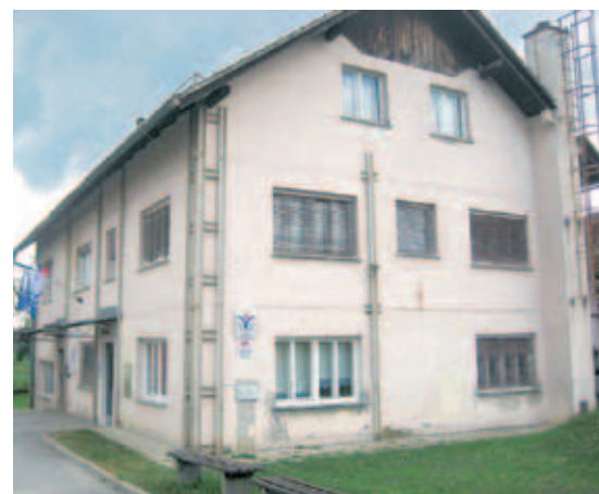
Mnenja o lokaciji gradnje novega vrtca v Smledniku so različna. Gradnjo na lokaciji sedanjega v Valburgi zagovarjajo predstavniki civilne iniciative.