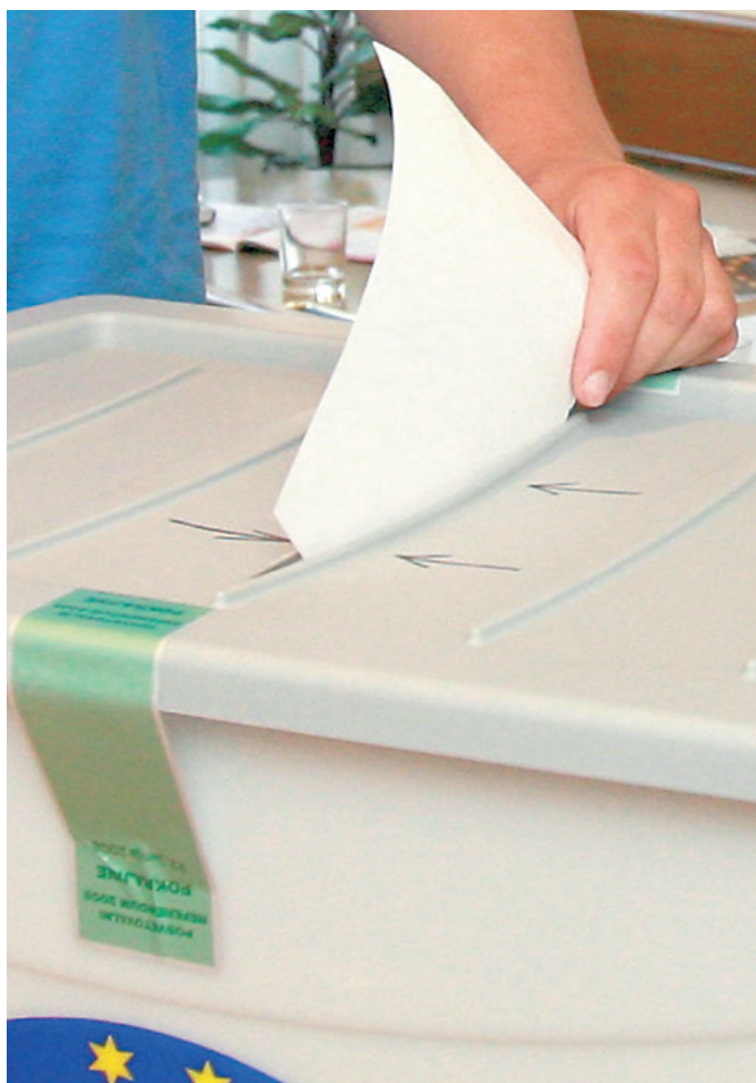
Kdo bodo zmagovalci in kdo poraženci volitev, bo znano kmalu.