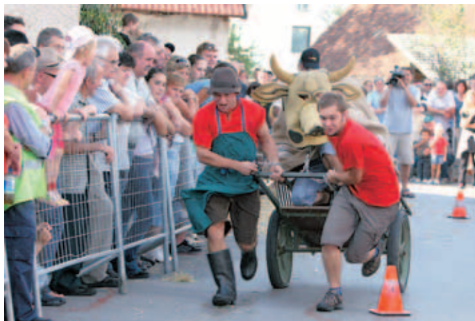
Takole pa je tekmovala ekipa Rosen tele.

Pirniče - Turistično društvo Pirniče je v nedeljo, 7. septembra, tretje leto zapored pripravilo prireditev Semanja dan na Telečjem. Vrhunec dneva je bila dirka telet, v kateri so v konkurenci štirih ekip slavile Turistke.