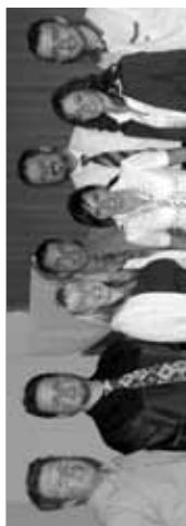
oddaje vam pripravljamo v vseh mavričnih barvah

Delovni čas: od 8. do 19. ure, sobota: od 8. do 13. ure