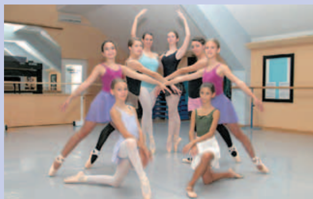
Med udeleženci baletnega seminarja so bile tudi Medvoščanke.