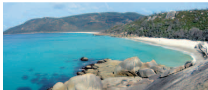
Wilson's Promontory, narodni park, najjužnejši del kontinentalne Avstralije

večino obveznosti preko predstavitve in debat na vajah, esejev, skupinskih nalog itd.”