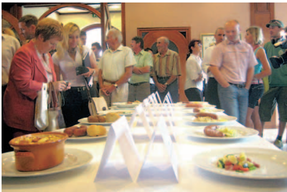
Poleg ocenjevanja kranjskih klobas so pripravili tudi razstavo dvanajstih načinov postrežbe kranjske klobase.