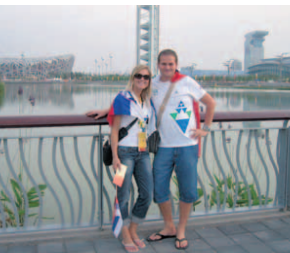
V ozadju levo stadion Ptičje gnezdo, kjer so med drugim potekala atletska tekmovanja in otvoritvena in zaključna slovesnost.

Maja Bertonec