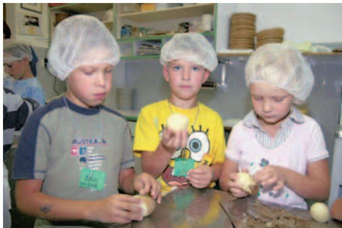
Mladi kuharji so v Pirničah pripravljali kosilo zase in za svoje vrstnike.