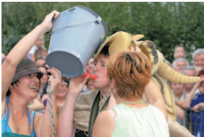
Turistke so bile najboljše v dirki telet. Hitro jim je šlo tudi pitje mleka.

Na Semanjem dnevu na Telečjem v Pirničah se vse vrtilo okrog teličkov in teletine.