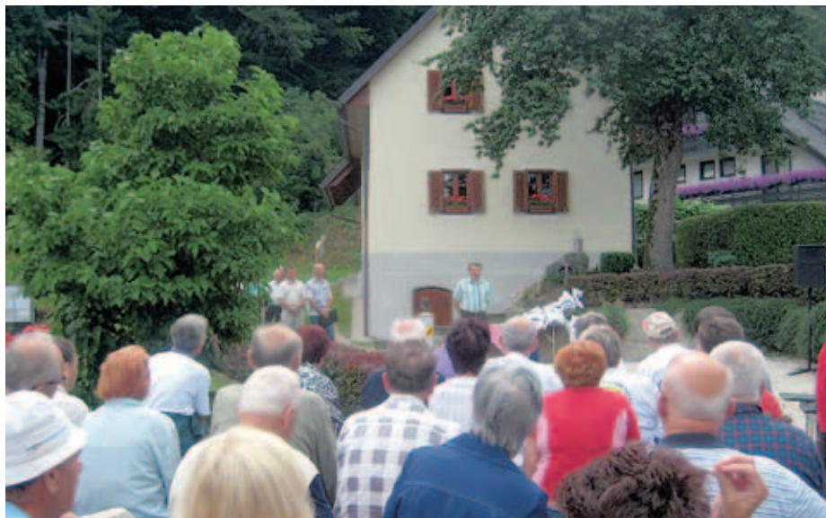
Zunanost Aljaževe hiše je obnovljena, opreme v njej še ni.