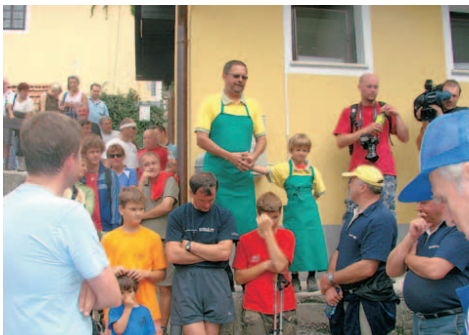
Ob odprtju nove biološke čistilne naprave na Šmarni gori

Obstoječi objekti na območju sedla in gostinski lokal na vrhu Šmarne gore imajo sedaj vendarle urejeno vodooskrbo, medtem ko so