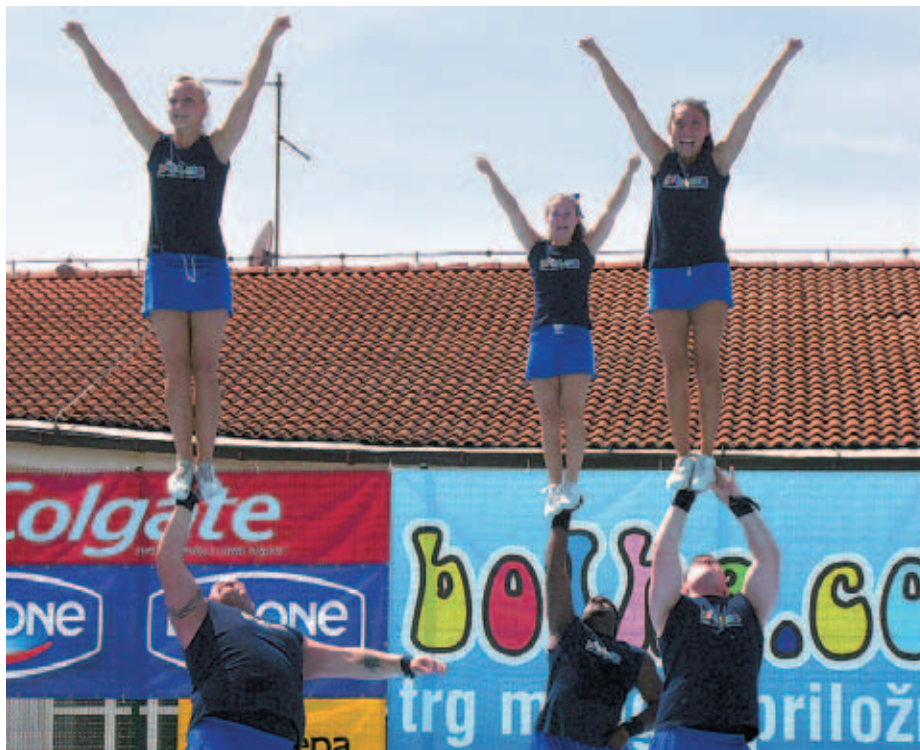
Udeleženci tabora plesnih in navijaških skupin so se naučili marsikaj novega.