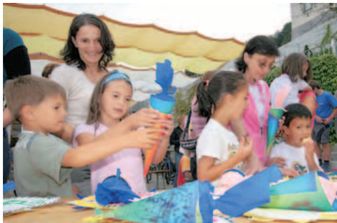
V Sori so otroci na zaključek oratorija pripeljali starše in jim pokazali svoje izdelke.