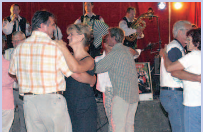
Obiskovalci Hokejske noči so zaplesali po taktih Veselih Gorenjcev.