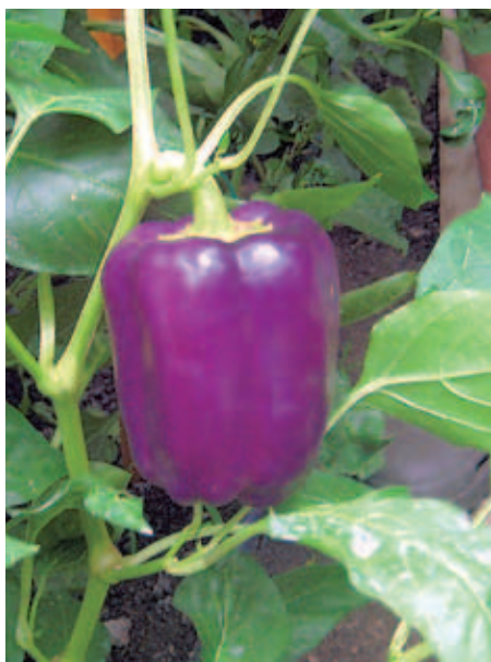
Doma ima tudi vijolične paprike.

bolj trpežne, vseč so tudi moji mami, dodam pa potem kakšno novo rožo. Doslej mi je še vse uspevalo. Tudi letos mi lepo rastejo. Imam zmajeva krila, sladke krompir, moljevke, drobnocvetne kasije, viseče abutilone in še bi se našlo,” pojasni. Ker doma nima dovolj prostora, prezimi le tiste trajnice, ki so bolj redke, večino pa vsako leto kupi na novo. ”Pozimi narišem zasaditev, spomladi grem najprej v vrtnarijo pogledat, če imajo kaj novega, potem pa v nakup. Rože doma zasadi sam,” je dejal.