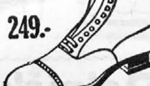
Vrsta 9677-22 Din. 249.-

Moški čevlji iz I boksa za napor, s kovanim podpla- tom. Izdržljivi in dobri, ne žulfo ne noge in ne čepa.