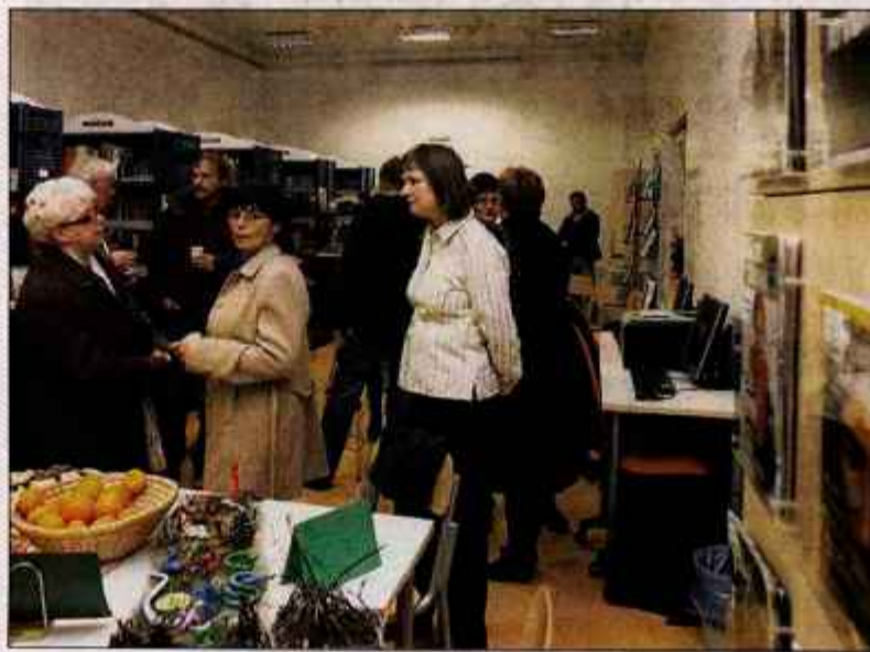
Novi prostori knjižnice