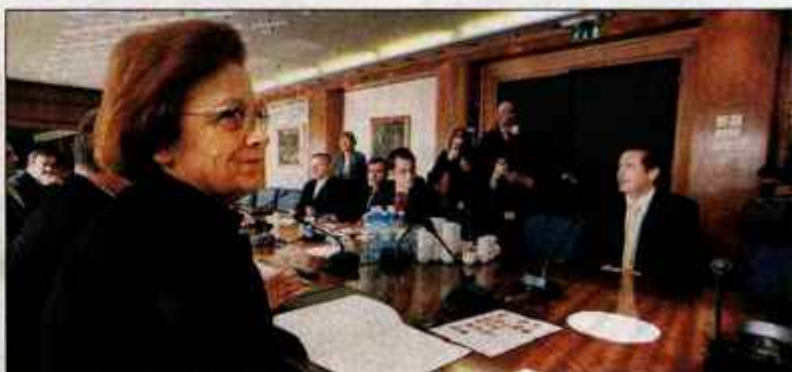
Ministrski kandidat Karl Erjavec pred parlamentarnim odborom za okolje in prostor

Ljubljana - Odbori državnega zbora so včeraj končali zaslišanja kandidatov za ministre, ki jih državnemu zboru v potrditev predlaga mandatkar Borut Pahor . Danes bodo poslanci glasovali o celotni vladni ekipi. V sredo je pred parlamentarni odbor za okolje in prostor prišel tudi kandidat za okoljskega ministra Karl Erjavec in predstavil svoje videnje dela v resorju, ki naj bi ga vodil prihodnja štiri leta. Kot vemo, si je Erjavec v času kadrovskega usklajevanja med koalicijskimi partnericami želel vse kaj drugega kot ministrstvo za okolje, enako nezaupljive do Erjavca na čelu tega resorja so bile tudi okoljevarstvene organizacije. Sedaj pa je Erjavec sprejel izziv in v predstavitvi nakazal, da bo z vodenjem okoljskega ministrstva skušal doseči ravnovesje med varstvom okolja in gospodarskim razvojem, pri tem pa slediti tudi direktivam Evropske unije. Pravi, da bo kot minister podpiral