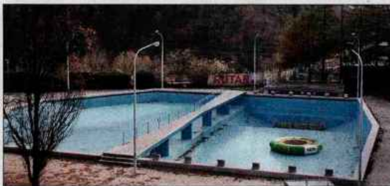
Kdo bo kupil tržičko kopališče, ni znano, a najbrž ne trgovec z reklame.