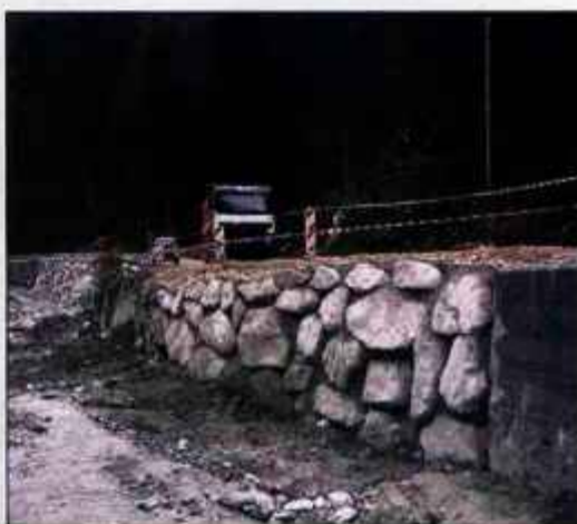
Regionalna cesta v Davčo je od ponedeljka spet odprta za promet.

Rangusova je še dodala, da se je po njihovem mnenju oporni zid nad zasebno mini elektrarno porušil zaradi nezakonitega posega lastnika te elektrarne: "Ta je namreč brez soglasja upravljavca vodotoka v strugo hudournika postavil nekaj neustreznih lesenih pregrad, kar je povzročilo vrtnčenje vode in s tem izpiranje temeljnih tal pod zidom."