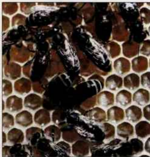
V čebelarstvu je bila letos slaba letina.

Ministrstvo za kmetijstvo, gozdarstvo in prehrano je objavilo javni razpis, s katerim namenja 140 tisoč evrov za povračilo škode, nastale zaradi boleznih rejnih živali, ko to ni urejeno z drugimi predpisi. S tem ukrepom naj bi ublažili slabšanje ekonomskega položaja na kmetijah, na katerih je zaradi ukrepov, povezanih s pojavom ptičje gripe, omejeno trgovanje. Posameznik lahko dobi največ 7.500 evrov pomoči. Agencija za kmetijske trge in razvoj podeželja bo sprejemala vloge do objave obvestila o zaprtju razpisa. C. Z.