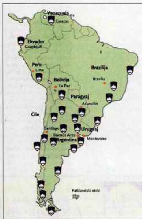
Slovenci v Južni Ameriki

Drugi val slovenske emigracije so bili begunci po drugi svetovni vojni, v Argentino jih je prišlo dobrih pet tisoč. Iz begunskih taborišč v Avstriji, kamor so pred komunističnim nasiljem pobegnili takoj po vojni in tam ostali kar tri leta. Izseljivanje v prekomorske dežele se je odprlo leta 1948, Kanada je sprejemala le mlada dekleta in fante, tudi ZDA in Avstralija nista marali majhnih otrok, nazadnje se je izkazalo, da družine z veliko otroki sprejema samo Argentina. Med izseljenci so bili tudi