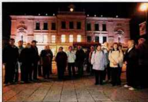
Osvetljena stavba Gimnazije Kranj ob svetovnem dnevu sladkorne bolezni

Štirinajste novembra je svetovni dan sladkorne bolezni. Ob tej priložnosti so približno petsto stavb po svetu, med njimi tudi stavbo Gimnazije Kranj, osvetlili z modro barvo, ki je mednarodna barva diabetesa. Tega dne so potekale brezplačne meritve sladkorja in številne druge aktivnosti, ki pripomorejo k ozaveščanju o problematiki sladkorne bolezni. S. K.