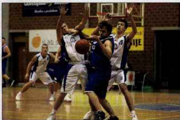
Košarkarji Triglava (v svetlejših dresih) so v sredo v domači dvorani sicer premagali ekipo TCG Mercatorja, a so Ločani prejšnji teden na Podnu slavili z večjo razliko in se uvrstili na finalni turnir.

Med tednom pa se je že začel 8. krog v ligi UPC. V