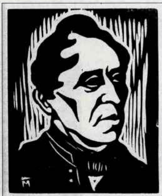
Dr. Janez Bleiweis (1808-1881) na lesorezu Mihe Maleša

Na ta vprašanja, ki so bila retorična in stvarna hkrati, je brž odgovoril kar sam. "Menim, da morem na vsa vprašanja odgovoriti s trdnim: 'Ne!' Zavoljo tega se naproša hvalevredno č. kr. policijsko direkcijo v interesu javnega zdravja, naj v bodoče v tako tehtnih zadevah dobrotljivo izvoli zapovedati poleg nemškega jezika skromen prostorček tudi deželnemu jeziku, kakor to počne tukajšnje deželno poglavarstvo v svojih oznanih." To zahtevo je tudi utemeljil, sklicujoč se na samrega cesarja in ustavo, ki jo je bil ta v tistem letu prisiljen dati svojim narodom. "Minili so časi, ko je na povsem slovanskem Kranjskem predla samo nemška Berta. Naš milostni cesar nam je dal konstitucijo in pod 59. paragrafom ustavnega pisma stoji na vrhu: 'Vsem narodnim plemenom je zagotovljena svetost njihove narodnosti in jezi-