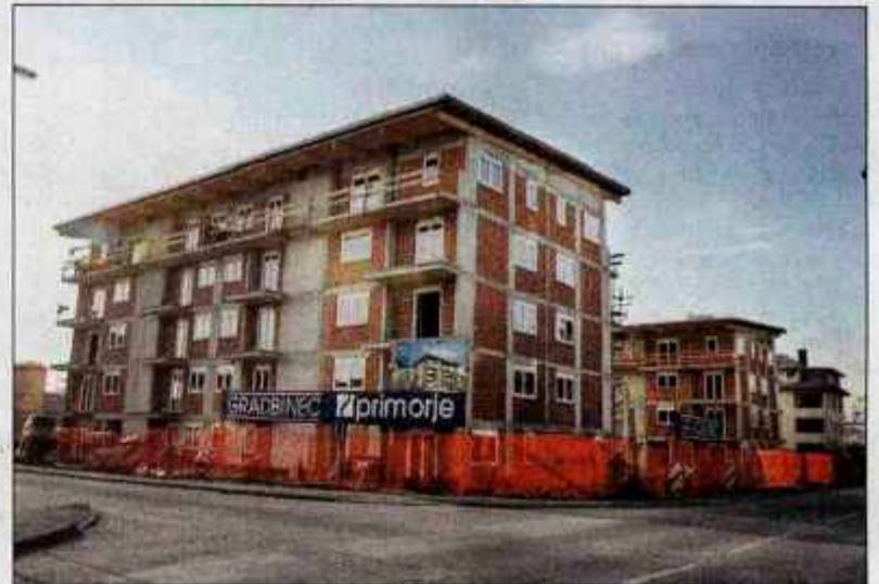
Med dejavnostmi, ki jih je že finančna kriza močno prizadela, je na prvem mestu stanovanjska gradnja.

skrbijo predvsem za uspešnost gospodarstva. Ukrep, ki je pomagal bankam, za svobodnejše dihanje, je bil nujen in neizbežen, ni pa bil zadosten za to, da bi gospodarstvo prišlo do tekočih likvidnih sredstev. Ker je bil prav izvoz oz. njegova rast v preteklosti eden pomembnih (poleg investicij) motorjev gospodarske rasti, pomeni njegovo upadanje tudi konec sanj o gospodarski rasti in država se bo morala prilagoditi tem novim razmeram. Zlasti za javno porabo. Podrobneje poročamo na 17. strani.