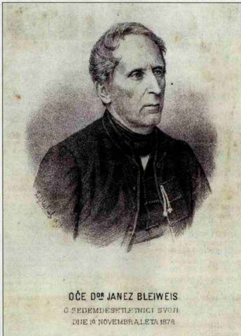
Oče naroda ob 70-letnici, slika iz njegovih Novic, 1878

Bleiweis ni bil revolucionar, bil je zmerno liberalen ali klerikalen, po potrebi. Bil je praktik, ne teoretik. Z drobnimi, konkretnimi koraki, ki pa jih je bilo veliko, je v štirih desetletjih aktivnega publicističnega in političnega dela tudi naredil veliko.