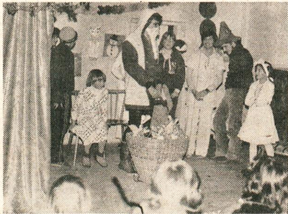
Na sliki: prizor iz letošnje novoletne predstave