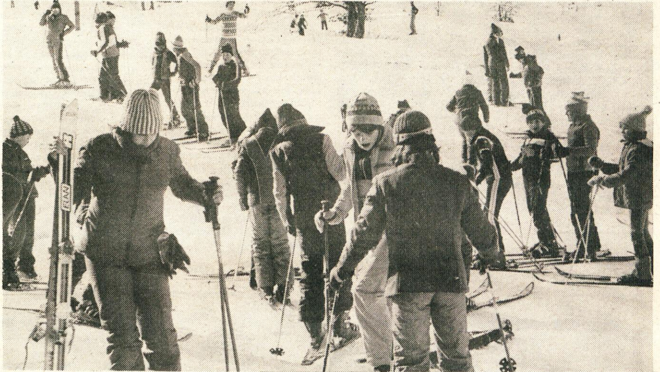
V petek se je prvo polletje šolskega leta končalo tudi za kamniške šolarje in dijake. Za štirinajst dni bodo odložili torbe in pozabili na knjige in zvezke ter se predali počitniškim radostim: smučanju, sankanju, prebiranju knjig, pogovorom s prijatelji. Toda, nekateri naši šolarji bodo tudi med počitnicami trdo delali, tako so vsaj odgovarjali v anketi, ki jo objavljamo na 4. strani.

trenutku. Kajti vse njegove misli in dejanja so bile prežete z zaupanjem v človeka, v posameznika in v množico hkrati, ki zna stopati po začrtani poti socialističnega samoupravljanja z jasnim ciljem. Zapisal ga je v svojem delu Smeri razvoja političnega sistema samoupravljanja: »Avantgardne sile socializma in socialistična družba imajo potemtakem lahko samo en cilj – da glede na možnosti danega zgodovinskega trenutka – ustvarjajo razmere, v katerih bo človek kar najbolj svoboden pri takšnem osebnem izražanju in ustvarjanju, da bo lahko – na podlagi družbene lastnine proizvodnih sredstev – svobodno delal in ustvarjal za svojo srečo. To je samoupravljanje.«