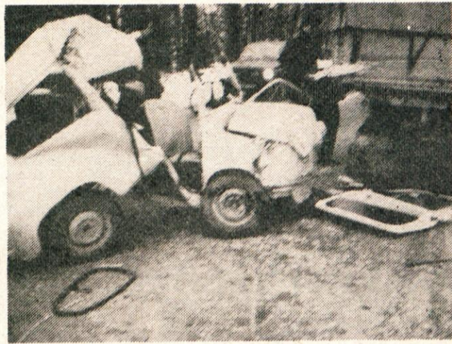
Uničen »fičko« in telesne poškodbe voznika so posledice ene od prometnih nesreč v letošnjem letu. Pripetila se je 14. januarja na cesti Moste–Brnik v bližini Nasovc.

Največ prometnih nesreč se je pripetilo na relacijah Kamnik–