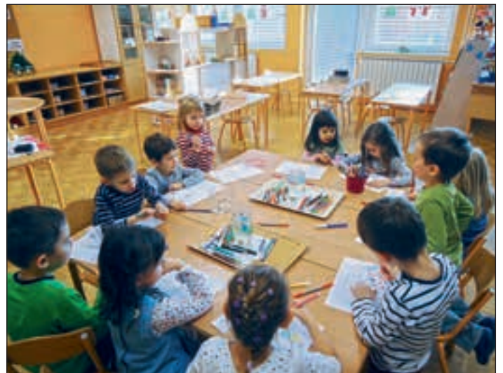
Mali raziskovalci v vrtcu Navihanček

Urejen kotiček zagotovo pomeni pomemben prispevek RKS OZ Ormož in vrtca Navihanček pri OŠ Središče ob Dravi k promociji zdravja.