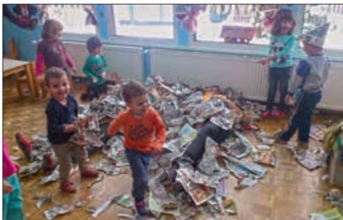
Dan brez igrač