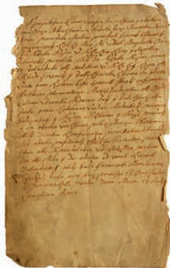
Prisega tržana, 1730

http://nl.ijs.si/e-zrc/prisege2/html/tr%C5%A1ke_skupnosti.html .