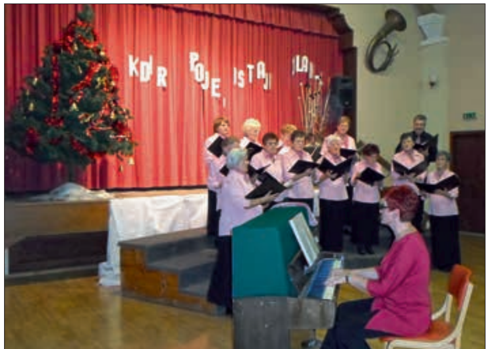
Koncert pevskega zbora Društva upokojencev.

Pripravili smo spomladanski izlet na Dolenjsko, jesenskega pa na Pohorje. Udeležili smo se zanimive in poučne ekskurzije v Semenarno v Ptuj. Bili smo na kopanju v Biotermah Mala Nedelja. V septembru smo uživali teden dni v Vodichah v Dalmaciji. Srečevali smo se še ob raznih drugih priložnostih: najprej na občnem zboru, potem ob občinskem prazniku na srečanju starejših občanov nad 70 let, v juniju na medobčinskem srečanju upokojencev v Ormožu, avgusta na poletni veselici in decembra na prednovoletnem praznovanju. Spomladi