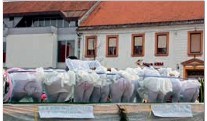
Na pustni povorki v Ljutomeru

Pod vodstvom nove predsednice RD Godeninci smo se letos predstavili člani društva na pustni povorki v Središču ob Dravi in v