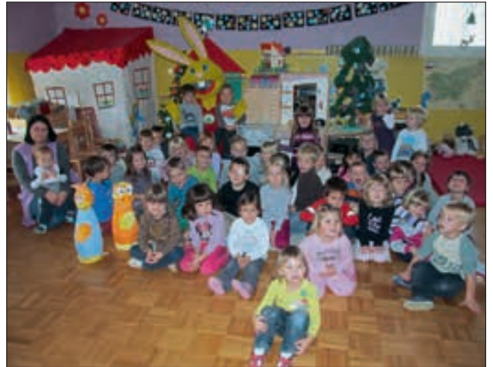
Sparky na obisku