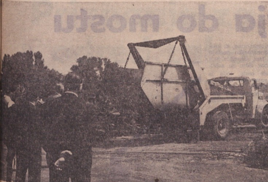
Posebni tovornjaki-nakladalci na dvorišču podjetja DINOS

Kot je še pripomnil Rudi Vavpetič, mora tovarna, ki proizvaja neposredno za tržišče, skrbeti za skrbno načrtovanje proizvodnje, levji del te proizvodnje ne sme biti ne prevelik ne premajhen in podjetje mora v kakršnihkoli razmerah najti pot na trg. Če je proizvodnja izdelkov za investicijske potrebe, v tem primeru instalacijski material, prevelika in ga tržišče ne absorbira, mora kolektiv v najkrajšem času poskrbeti za izravnavo tega, to se pravi za preusmeritev dela proizvodnje na izdelke za potrebe široke potrošnje. Poleg tega pa lahko z drugimi svojimi izdelki zalaga še del industrije. Če hoče tovarna uspevati, seveda ne sme zanemariti sodelovanja s sorodnimi podjetji, naj si bo to doma ali v tujini.