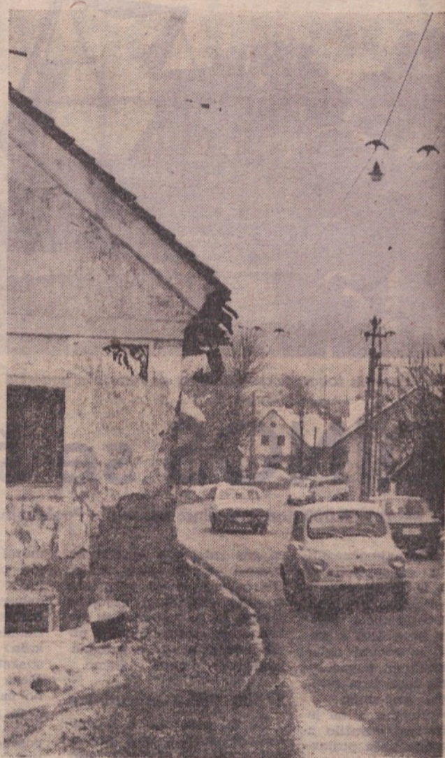
Cesta I. (ne)reda na Ježici

Občinska skupščina Ljubljana-Bežigrad je temu odseku posvetila precej pozornost.