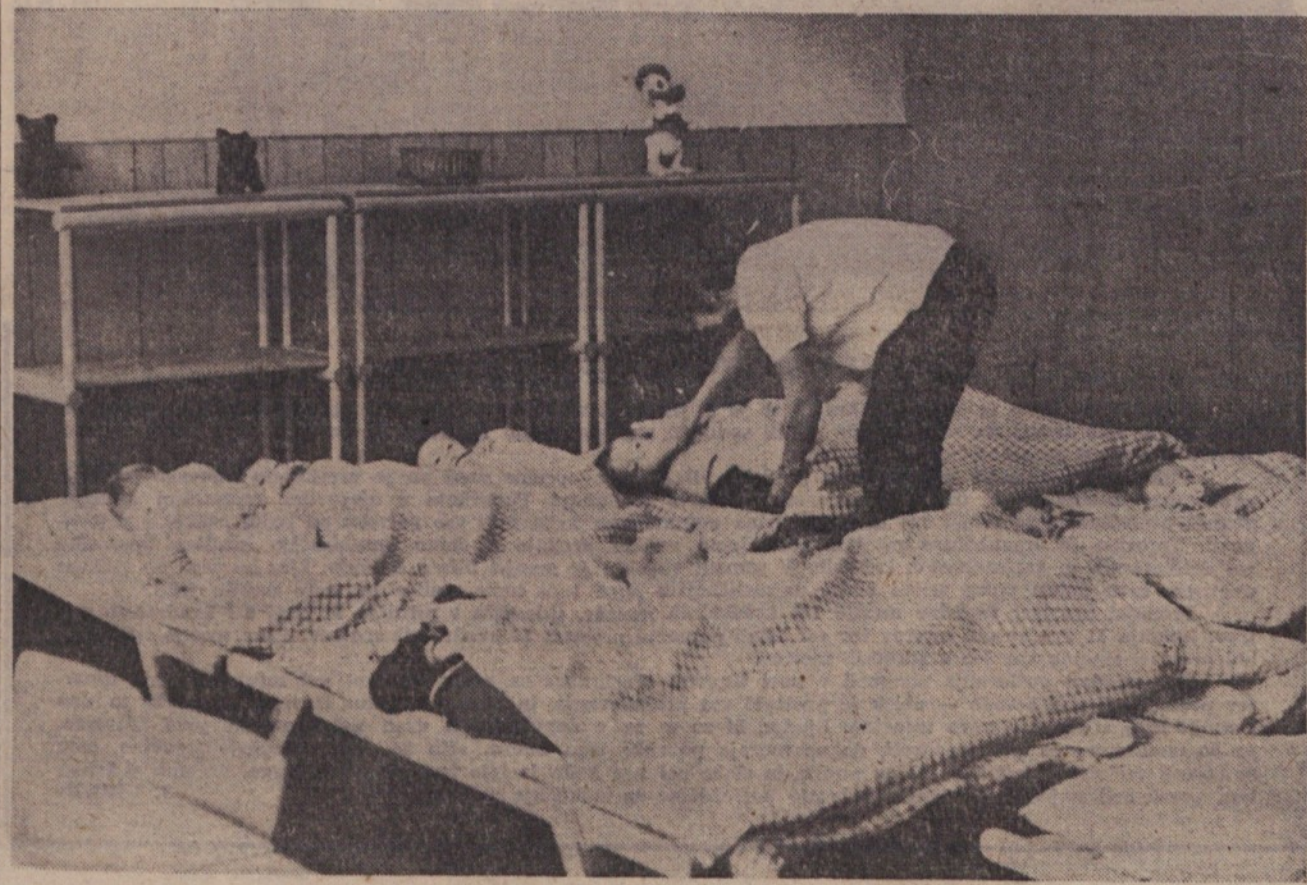
Otroci pri počitku v novem vrtcu »Ciciban« v Stožicah