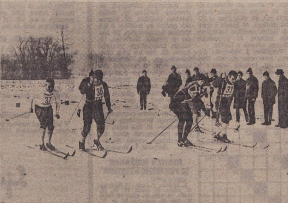
Zagrizene borbe smučarjev na dolskih smučinah — Pokrovitelj republiškega prvenstva je bila kemična tovarna JUB

Reprezentanca Slovenije je zmagala pri mladincih, mladinke pa so se uvrstile na tretje mesto. Strokovnjaki so zelo ugodno ocenili znanje nastopajočih na tej reviji jugoslovanske mladinske košarke.