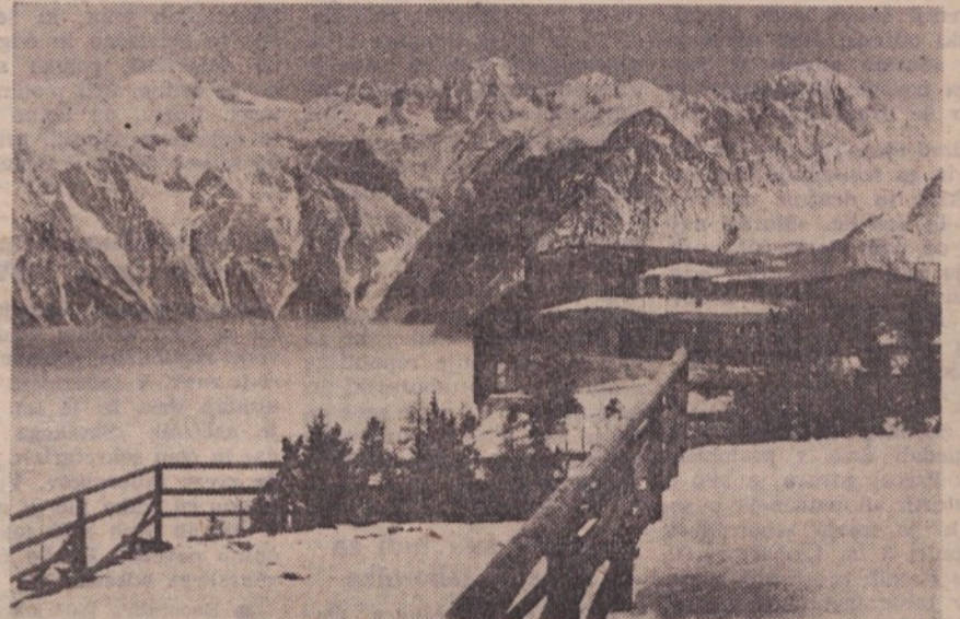
Zgornja postaja gondolske žičnice

Najbližja žičnica v gore: IZ LJUBLJANE V TRIČE-TRT URE NA VIŠINO 1600 METROV. Do spodnje postaje žičnice je 34 km poti, za Bežigradjane še kakšen kilometer manj.