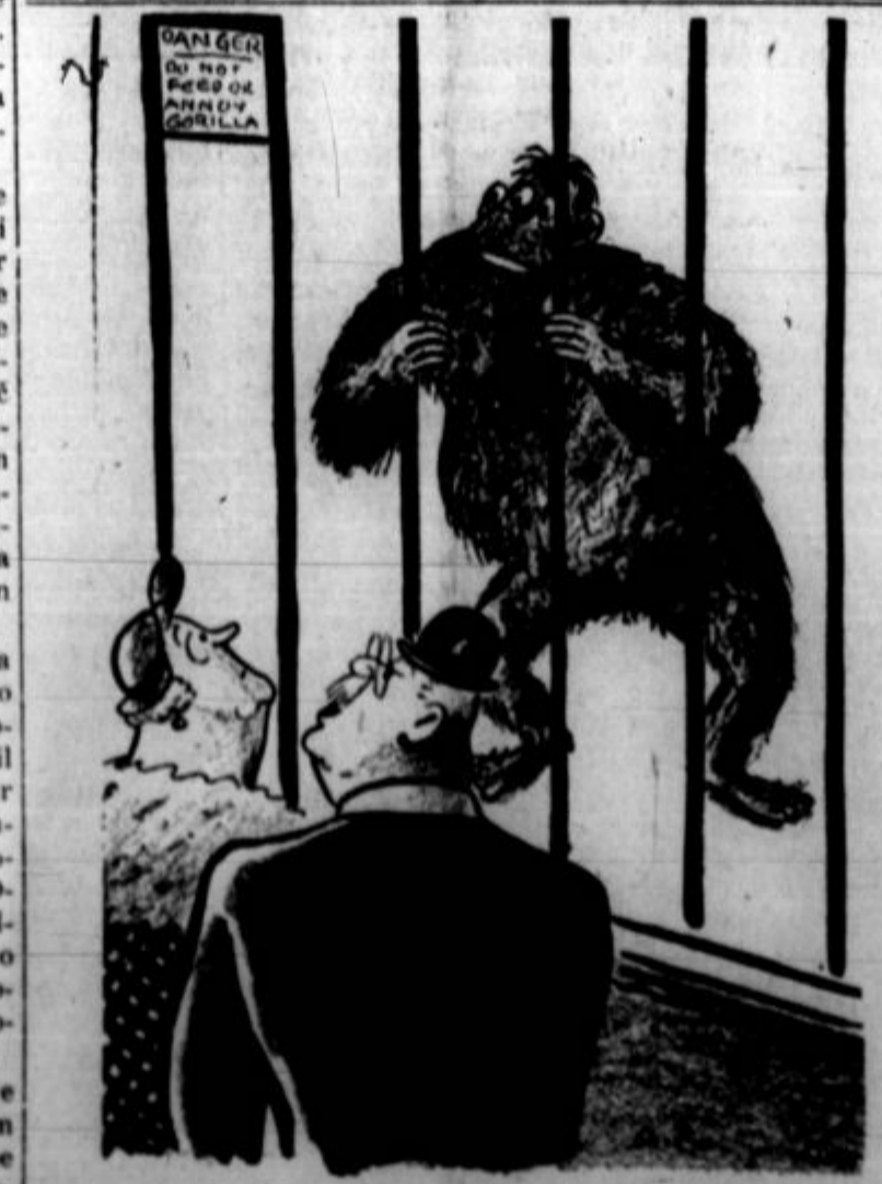
"Lahko prisežem, da sem to gorilo videl v Bergoffovi detektivski agenturi." (Narisal Redfield.)

Mnogi levičarji, ki so živeli v inostranstvu, so opazovali življenje tam in se jim vidi absurdno, da se ministrski uradi v Madridu odvijajo pred 11. dopoldne, da listi s jutraj izidejo pred 10., zvečer pa ne pred 11. urne, da pijejo Španci ob 5. ali 6. popoldne kavo, ob 8. zvečer čaj, da kosijo ob 3. popoldne in večerjajo okrog 10. ali 11. zvečer. "Kakšno življenje morajo imeti igralci?" vzklikajo referenclenje morajo imeti igralci?" vzklikajo referenciamotorji v nekem svojem proglašu. "Gledalci nista se otvorijo šele ob 11. zvečer, gledalci igralci ne gredo pred 3. jutraj spat. Ali je pametno, da se na ta način kršijo naravni zakoni? Ali je to zdravo?"