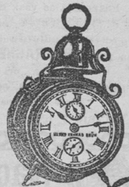
Budilnica z zvoncem

21 cm visoka, v krasnem poliranem okrovu s glasnim dolgo trajajočim, prijetnim zvonjenjem, na močno sidro iz jekla da se tudi zapreti, da ne zvoni, 1a kvaliteta samo 2'85 fl.