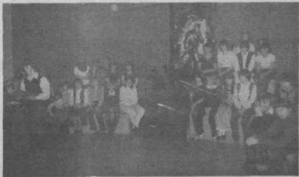
Z volilne konference občinske ZPM so poslali tovarišu Titu brzojavko z najboljšimi željami po skorajšnjem okrevanju

V okviru tega bo občinska ZPM reševala tudi probleme materialne osnove svojega dela. Pri tem se bo povezovala z občinskimi