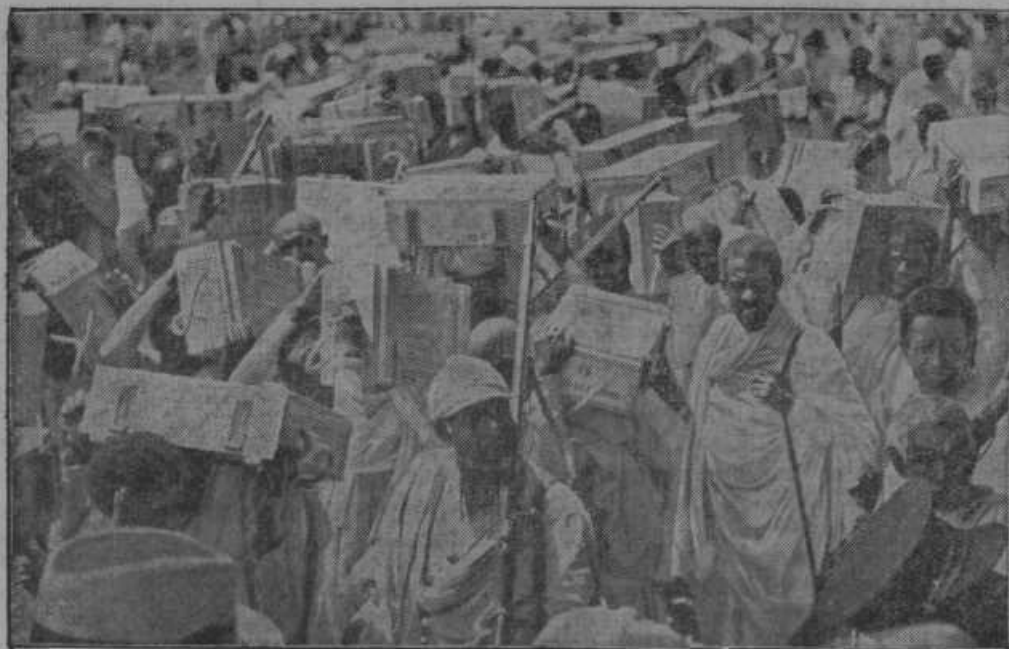
Frenos Abesincem namenjenega streliva in orožja. — Desno: Japonski letalec Ano je na svetovnem poletu iz Londona preko Evrope in Azije priletel na Japonsko.