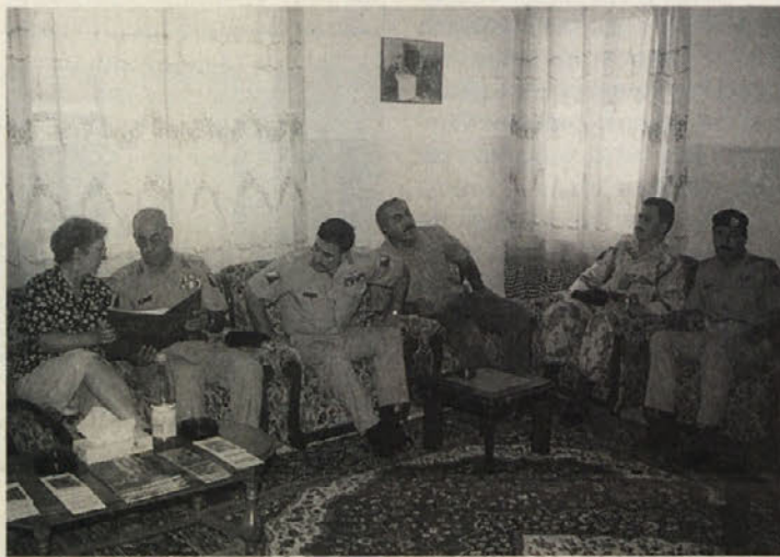
O prihodnosti, miru in sožitju odločajo politiki in oficirji

bilo tudi veliko kamel, na katerih smo lahko jahali, kar je zelo nenavadno, toda ko kamela stoji na vseh štirih, je zelo zanimivo. Beduini so nam tudi zaigrali tipično arabsko glasbo.