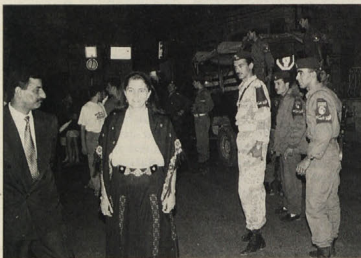
Varnost in vojaška zaščita na vsakem koraku

Med tem pa nikoli nismo pozabili na naš prvotni namen, da se intenzivno pogovarjamo z mladino o vseh njihovih problemih. Toda zanimanje jordanske mladine ni bilo bogve kako veliko – prav nasprotno kot v Izraelu – kajti, ko smo bili zmenjeni, da bi se srečali z mladimi, nekateri sploh niso prišli. Tako smo lahko govorili samo z majhno skupino desetih