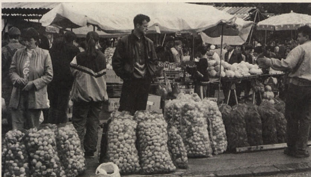
Življenje gre dalje tudi v Sarajevo in na tržnici prodajajo kmetje svoje pridelke ...

Prvo volišče je bilo v neki telovadnici. Začudena sva bila,