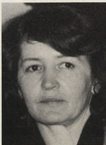
Piše Sonja Wakounig

za narod tudi skrb za oseben razvoj mladega človeka, ki vidi svoje življenje v luči današnjega hitrega življenja, nuditi mu/ji je treba možnosti, da se uresničuje drugače, kot se je še generacija pred recimo dvajsetimi leti. Humanistična in anti-fašistična miselnost tu zagotovo nista ovira, prej nasprotno.