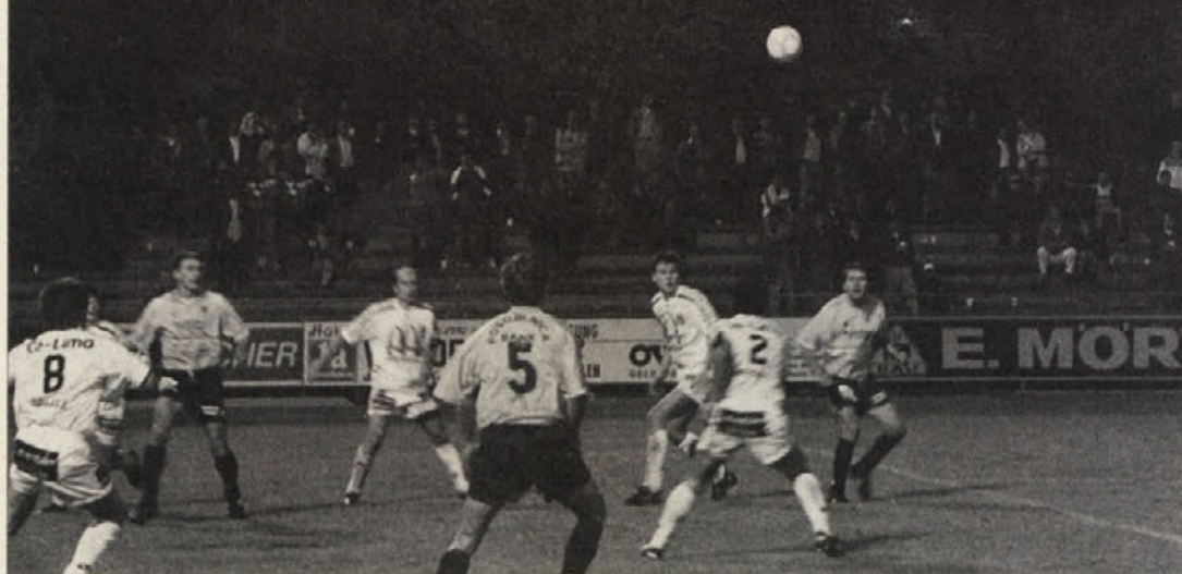
Igra je bila napeta in hitra