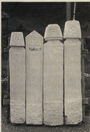
... napredaj so tudi nagrobniki.