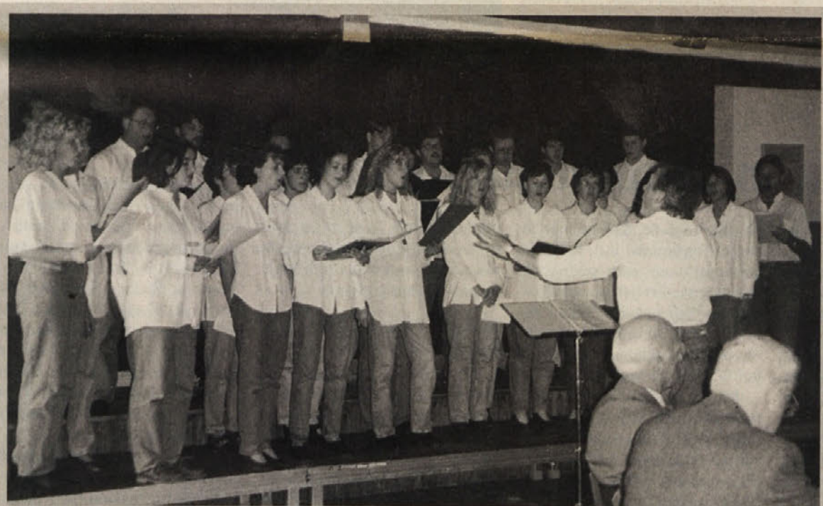
V radiškem kulturnem domu so imeli člani Zveze slovenskih izseljencev občni zbor. Potekal je v znamenju spomenika pregnancem, ki stoji na Radišah in še posebej povezuje ZSI in SPD »Radišek«. Na sliki MePZ Radiše, ki je s pesmimi popestril zborovanje. Več na strani 2.