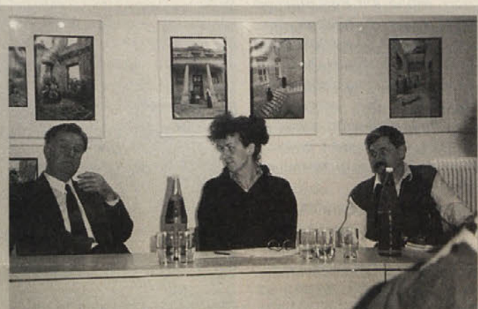
V šentjanškem k & K entru so brali bosanski avtorji iz svojih del. Bil je večer predvsem za sladokusce, ki znajo ceniti poezijo in ki so še po branju intenzivno diskutirali z umetniki.