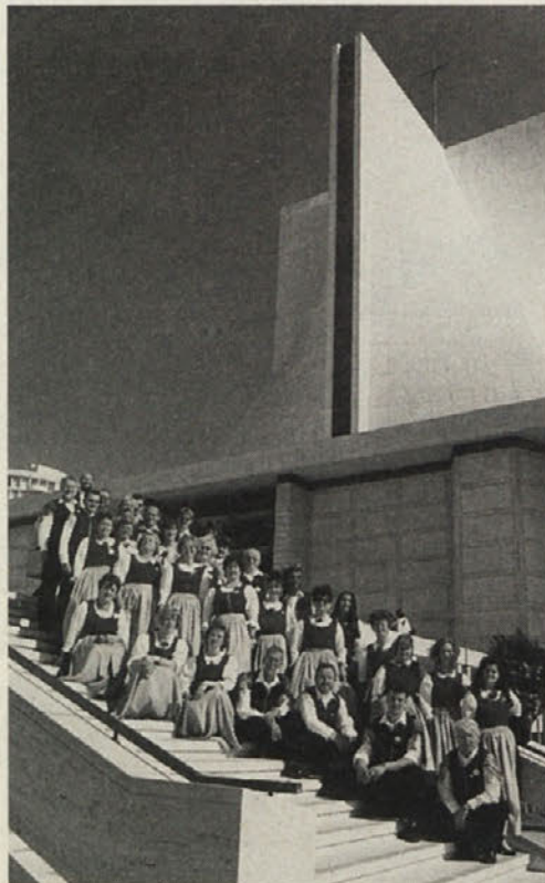
Še posnetek Gallusa za konec potopisa

Presenečenje nas je čakalo že ob prihodu na odcepu s Highwaya (avtoceste) v mesto. Na reklamnem stolpu so med drugim digitalno naznanjali prihod Gallusa iz Koroške, Avstrije ter kraj in čas pevskega nastopa. Ustrezen je bil odziv občinstva ob koncertu. V odprti dvorani kulturnega in zabavnega središča »Iron World Discovery