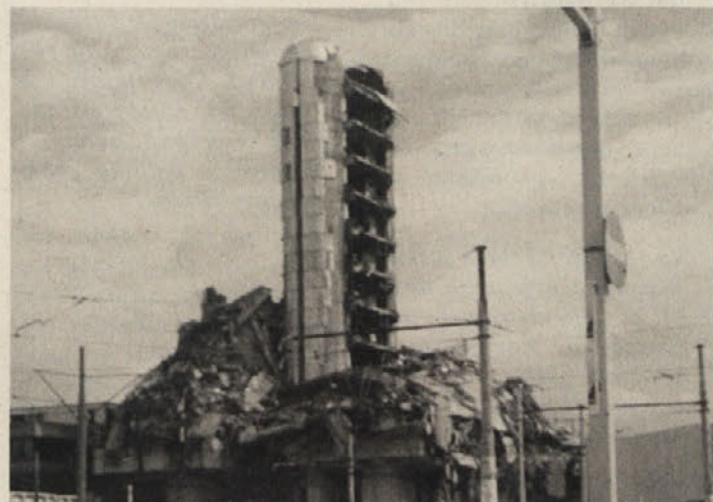
Okostja stavb bodo še dolgo štrlela v nebo v nemi grozi

Razgovor z družino me je zelo presenetil. Nisem verjel, da bom srečal take ljudi. Zato nisem spraševal drugih, ki bi mi najbrž povedali povsem nasprotno stališče. Zato so moji vtisi zgolj subjektivni in naključni. Pa še to: Združena lista je dosegla 9 odstotkov glasov. Ali bo to prispevalo k pomiritvi? Kdo bi vedel.