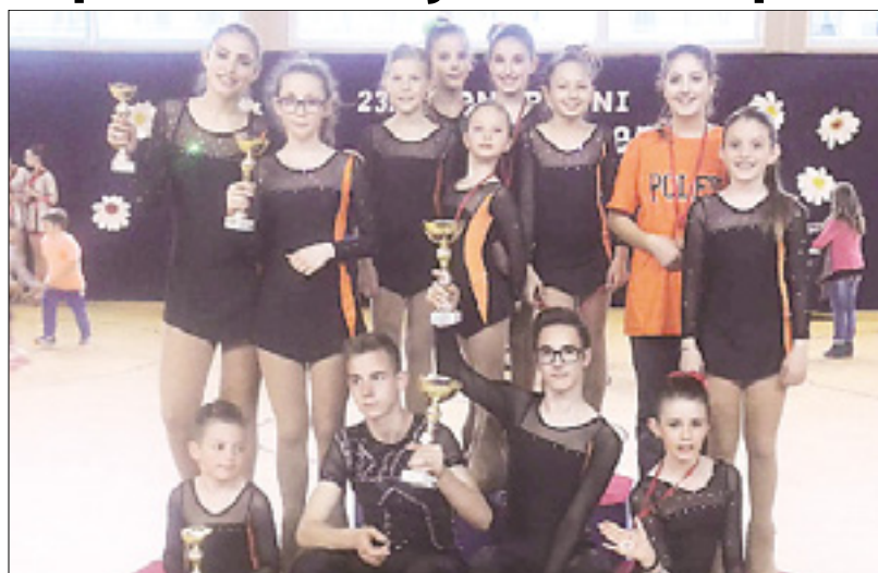
Tekmovalke in tekmovalci openskega Poleta na pokalu Renč

Kotalkarji Poleta in Vipave so pred kratkim nastopili na mednarodnih tekmovanjih. Oboji so nastopili na pokalu Renč, kotalkarji Poleta pa tudi na Goriški vrtnici v Novi Gorici.