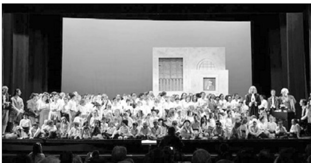
Izvajalci Mednarodne operne akademije Križ

Cena vstopnice znaša 10 evrov (redna) oz. 7 evrov (znižana za upokojece, študente in brezposelne); podrobnejše informacije so na voljo v Kulturnem domu.