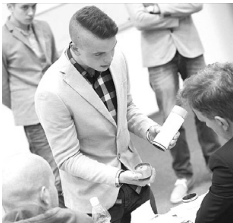
Predstavitve večnamenske stekleničke

Novi Gorici kot gostiteljici tekmovanja je na kožo pisana zmagovalna ideja v kategoriji študentov, diplomantov in ostalih odraslih: na višji strokovni šoli novogoriškega Šolskega centra so zasnovali Hišo vrtnic. Zaznali so praznino v ponudbi izdelkov vrtnic v mestu, ki se to rožo ponaša v grbu in na številnih mestnih gredicah. »Hiša vrtnic stremi k ponudbi izdelkov in promociji mestne vrtnice ter z njo povezanih produktov. Njej adut bo trgu ponuditi edinstveno eterično olje in gastronomske izdelke iz vrtnic burbonk,« so zapisali v svoji predstavitvi. Preko produktov v ponudbi želijo posamezniku približati cvetje kot gastronomsko surovino. Turistom, ki prihajajo v Novo Gorico, pa bodo ponudili celostno doživetje mestne znamenitosti - vrtnice burbonke, preko ogleda njihovih polj vrtnic,