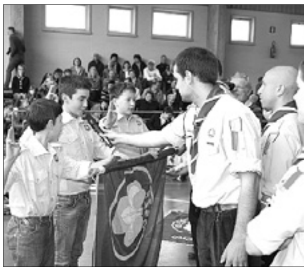
Skavtske obljube v sovodnjski telovadnici

Na jurjevanju so še napovedali, da bo v nedeljo, 7. junija, veliko praznovanje 50-letnice skavtizma na Goriškem. Tudi to so sadovi vztrajnosti. Ravno 50-letnici pa bo posvečeno »srečanje pod lipami«, ki bo potekalo jutri, 7. maja, ob 20.30 v komorni dvorani Kulturnega centra Lojze Bratuž v Gorici.