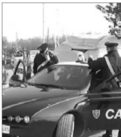
Karabinjerji v akciji

Karabinjerji so v soboto svoje preiskovalno delo sklenili z obiskom bivališča romunskega državljana v Pierisu; možkega so ovadili, ukradena čolna pa zasegli in ju vrnili lastnikoma. Romunskega državljana so sile javnega reda v preteklosti že nekajkrat obravnavale; na začetek novega sodnega postopka na goriškem sodišču bo čakal na prostosti.