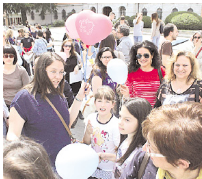
Protestni shod z barvnimi balončki na goriškem Travniku

Na Večstopenjski šoli Gorica so bili vsi vrtci zaprti; izjema je bil le vrtec v Ulici Brolo, ki je bil odprt samo med drugo izmeno in za le enega otroka. Med neu-