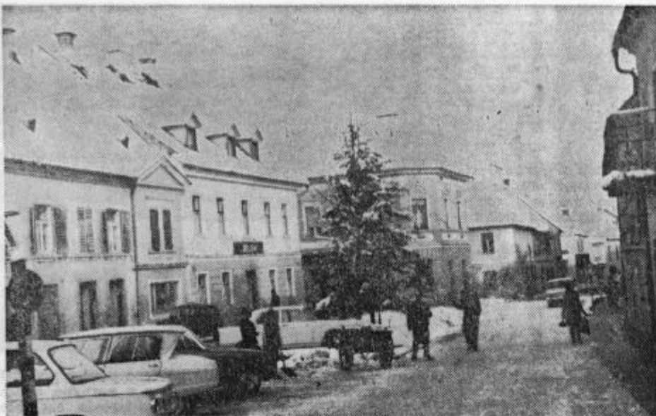
Konjiška zimska razglednica... Kakor povsod so imeli tudi v Konjicah nemalo težav z odstranjevanjem letošnje obilne snežne »letine«...