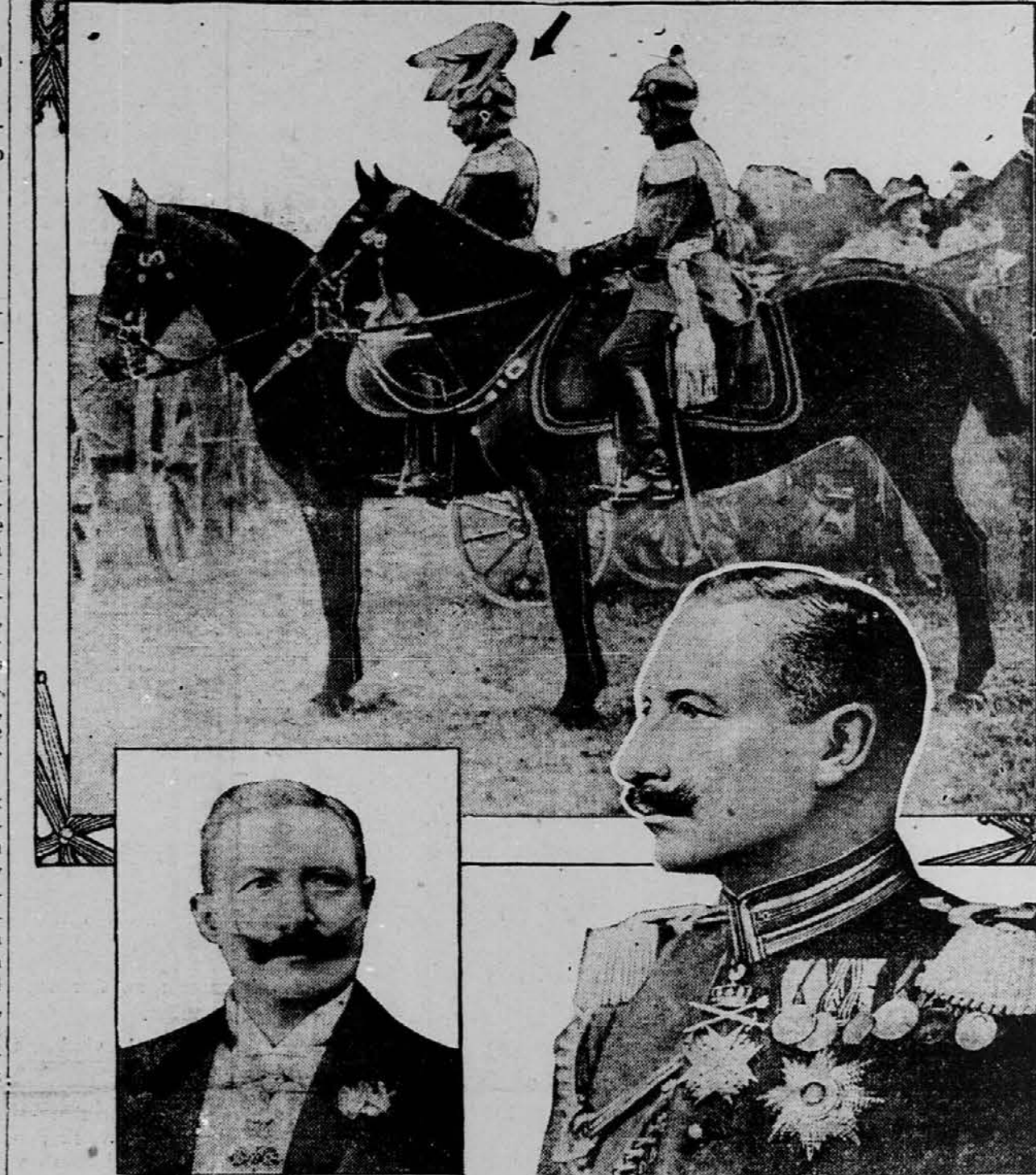
Slika nam kaže nemškega cesarja Viljema II., ki je glasom poročil iz Nemčije nevarno obolet. Trpi najbrže na isti bolezni, koji je podlegel njegov oče, namreč na raku v goltancu. Vlado je nastopil leta 1888.