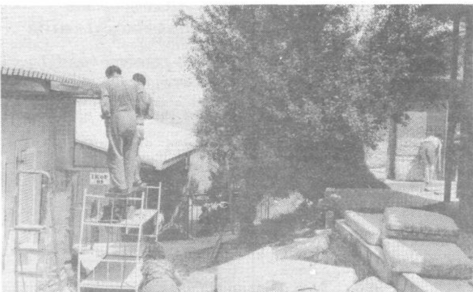
Delavca, ki sta nameščala nove žobove, sta se znašla – postelja na posteljo je lestev. Tovarišice iz vseh letošnjih izmen v Pacugu so prijelo v roke iztepeče in očistile jogi vzmetnice.