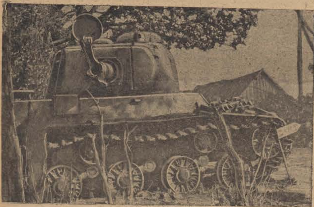
Sie mußten für Mosstümpfen und bluten.

Kaum hatten die Sowjets das polnische Ostpolen besetzt, da wurde auch schon die männliche Bevölkerung in ihre Reihen gepreßt. Panzergrenadiere der Division »Hermann Göring« nahmen viele dieser Polen mit, die erst wenige Wochen in der mit dem pompösen Namen »Polnische Freiheitsdivision« bekannten Sowjetarmee kämpften und unter dem Militärmantel teilweise noch Zivilleidung trugen.