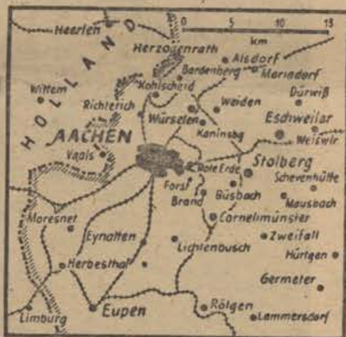
Karte zu der Schlacht um Aachen.

Iz poročila, ki je bilo izdano 17. oktobra, je bilo posneti, da se v teku trajajočih bojov za Westerschelde položaj ni bistveno spremenil. Vzhodno od mesta Brügge so bili zavrnjeni močni sovražni napadi. Vzhodno od Helmonda so vrgle naše čete sovražnika iz nekega vdornega mesta. Težka materijalna bitka za Aachen se je 16. t. m. stopnjevala do novega viška. Amerikanci so poskušali obkoliti mesto z dvema svežima pehotnima divizijama ter se pomočjo neke oklopniške divizije in letalcev v nizkem poletu. Uspelo jim je sicer zožiti zvezo z Aachenom, ne pa odrezati Fort Driant ob reki Mosel je po mimogrede izvedenem vdoru sovražnika zopet popolnoma v naših rokah. Hudi boji za gozdove in hribovske postojanke so se vršili v gozdu Parroy, vzhodno od Epinala, na obeh straneh doline Moselotte in jugovzhodno od Remiremonta. Sovražnik v teh bojih ni prišel do svojega cilja. Na zapadni fronti