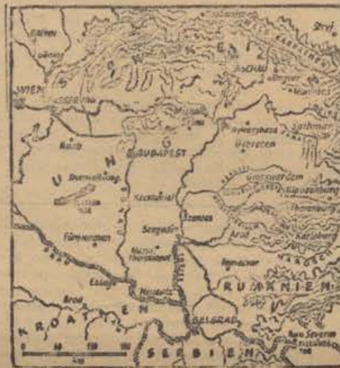
Karte zu den schweren Abwehrkämpfen im ungarischen Raum.

je bil položaj ob spodnji Tisi bistveno neizpremenjen, se je jugozapadno od Debrecina nadaljevala srdita bitka. Severno od Varšave in v mostiščih Nareva pri Serocu in Rozanu so izvojevale naše čete v težkih bojih nov obrambni uspeh. Kljub najjači vpostavi tankov, artilerije in letalstva niso boljševiki nikjer izvojevali nameravanega prodora. Pri Memelu je sovražnik spriču hudih izgub iz prejšnjih dni napadal le brez zveze in tudi brez uspeha. Da bi skrajšale fronto, so se naše čete neovirano od sovjetskih odredov ob Düni umaknile, prepuščajoč sovražniku zapadni del mesta Riga. Nemško letalstvo je pri Debrecinu in Velikem Varačinu slično kakor pri Varšavi ter pri Memelu posegalo z dobrim uspehom v boje na zemlji. Do srditih bojov je prišlo zlasti nad srednjim odsekom vzhodne fronte. V dveh dneh je bilo uničenih nad sto sovjetskih letal.