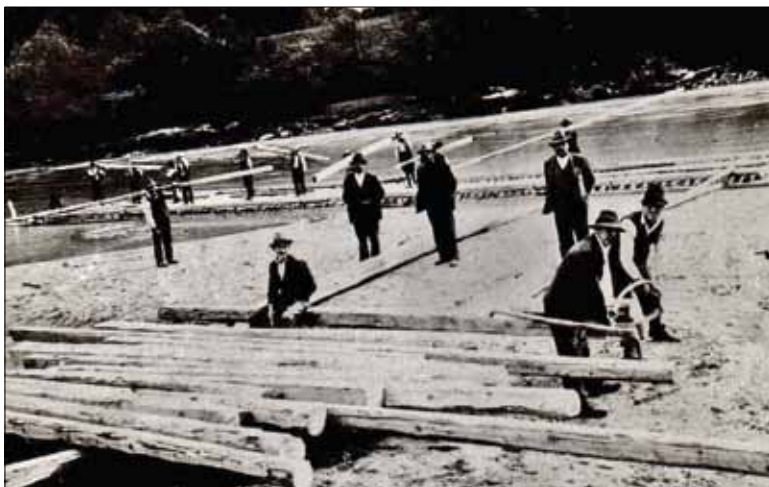
Slika 1: Vežanje splava v 40.ih in 50.ih letih prejšnjega stoletja. Ožbalt. Pahernik F., Šajke in splavi na Dravi, 1962

Film, ki traja dobre pol ure, ostaja kot zapis in doprinos k etnološki dedi-