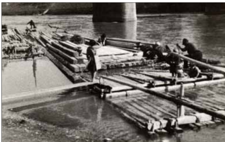
Slika 2: Končna dela pri izdelavi splava v 40.ih in 50.ih letih prejšnjega stoletja. Podvelka. Pahernik, Šajke...,1962

Prevažali so okrogli, pretežno pa tesan in rezan les za gradbene potrebe in vinogradniško kolje. Razlog, da je splavarstvo, kljub razvijajočemu se cestnemu in železniškemu transportu, obstajalo še naprej, je bila konkurenčnost te vrste transporta.