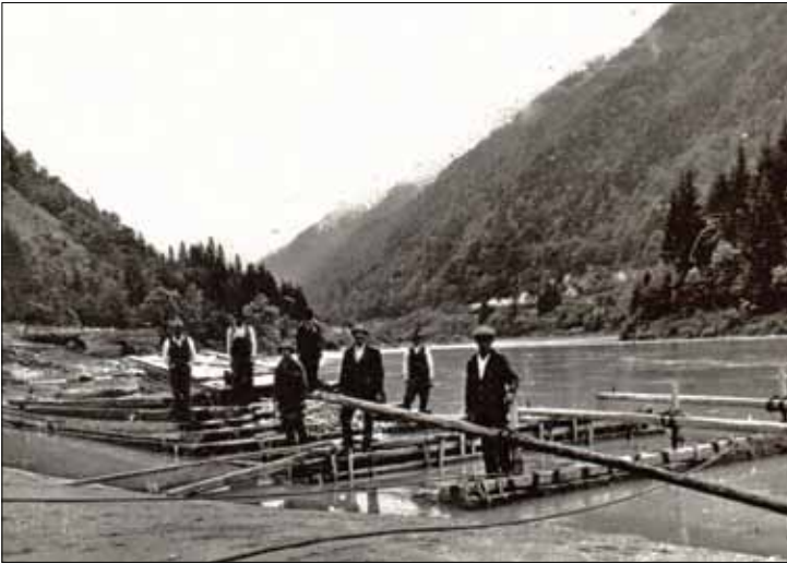
Slika 3: Splavarji pred odhodom na vožnjo v 40.ih in 50.ih letih prejšnjega stoletja. Ožbalt. Pahernik, Šajke ..., 1962

letnico 1829 in ladjo. Hranjen je v Pokrajinskem muzeju v Mariboru. (Mravljak 1927, Juvan 1972, Praper 2007).